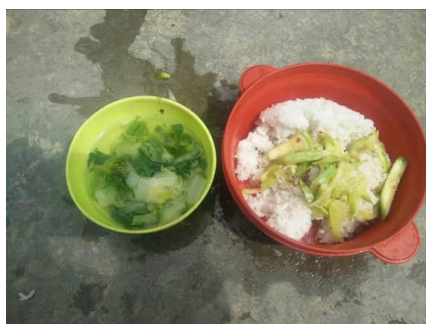
图 13 学生的午餐图

学校规定周三统一吃素,调查当日为周四,原定菜谱为“白瓜炒肉”,因供货商没有把肉及时运送到学校,当天临时调整为素菜。校方回应:因修路交通受阻等客观原因,造成食材配送出现失误。调查人员与校方交换意见后,校方及时派人与供货商进行沟通解决相关事宜。通过察看近期微博公示情况,本周只有周二有肉,其余有四天为吃素,周平均餐值为 3.15 元/人/天。3 月 21 日至 23 日这三天均有肉吃。(如图 14、15)