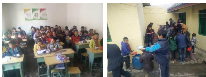
图5 学生餐具的存放与清洗组图

(2) “餐具消毒”取1分, 扣分原因为学生餐具部分为塑料制品无法高温消毒, 均由学生自行清洗, 存放在教室课桌内, 存在安全隐患。(如图5)