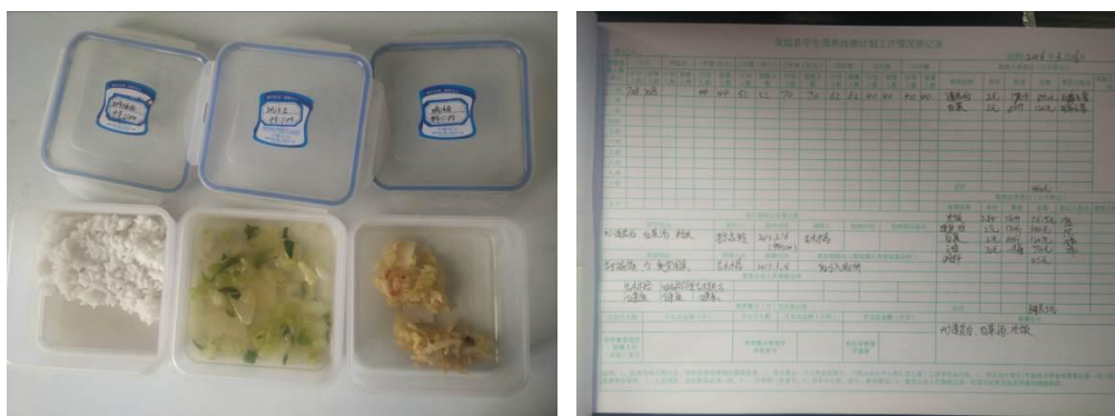
图 16 菜品留样与登记组图

“菜品留样”取 3 分, 扣分原因为有菜品留样和相关登记, 留样标签未写菜品名称, 因停电留样未能采用冰柜妥善保存。(如图 16)