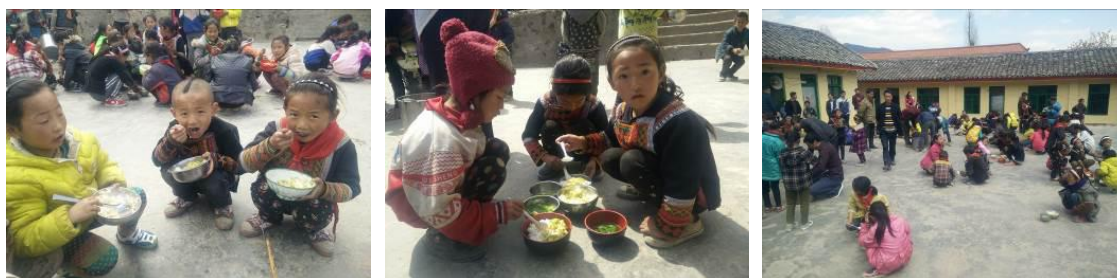
图 20 学生分餐、用餐情况组图