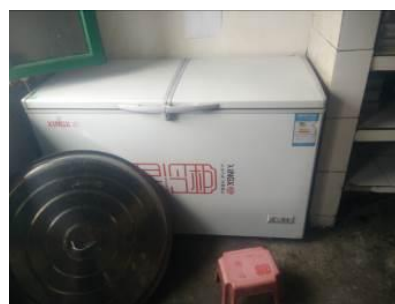
图 18 正常使用的厨房设备组图