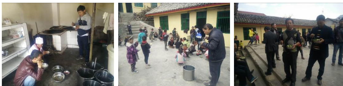
图 21 教职工用餐组图