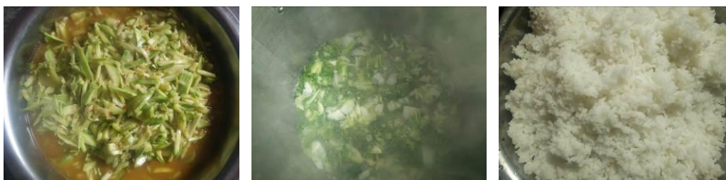
图 12 当日菜品组图