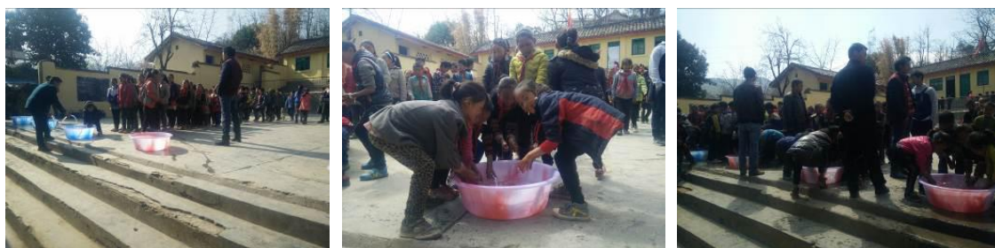
图 11 学生餐前洗手组图