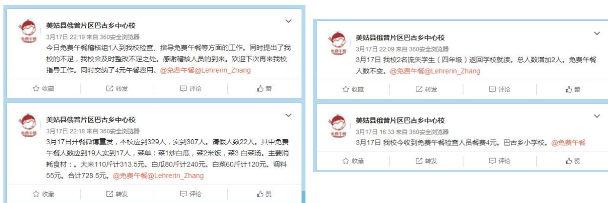
图4 就餐人数的微博截图

当日就餐人数:学生290人(20人请假)+老师13人(2人请假)+保安1人+厨师3人+稽核员1人=308人。稽核员缴餐费4元。实际用餐人数与该校微博公示内容完全一致。