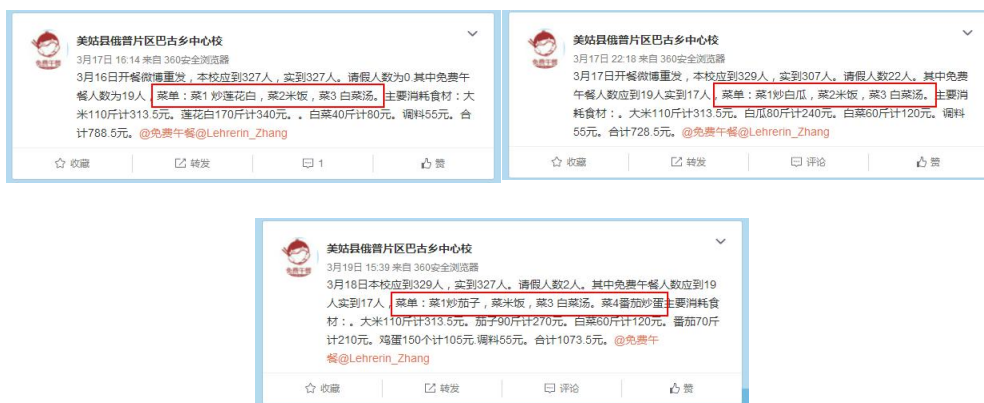
图 14 3月14日至18日一周内的微博公示截图