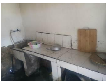
图7 厨房工作台组图