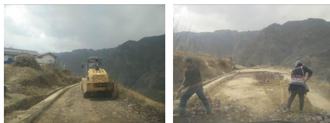
图2 沿途修路情况组图