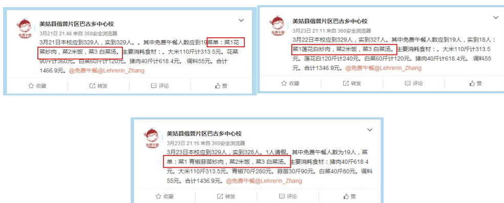
图 15 3月21日至23日的微博公示截图