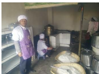
图6 厨工正规着装工作图