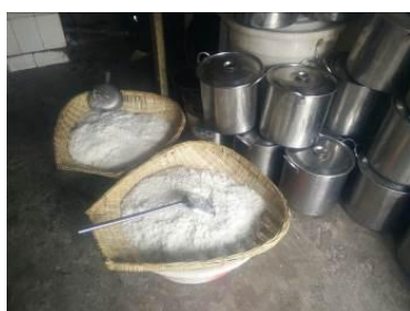
图8 工作台生熟食分开图