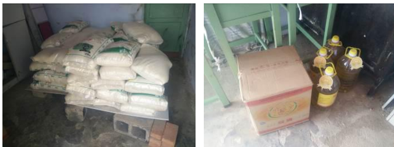
图 10 食材安全有序储藏组图