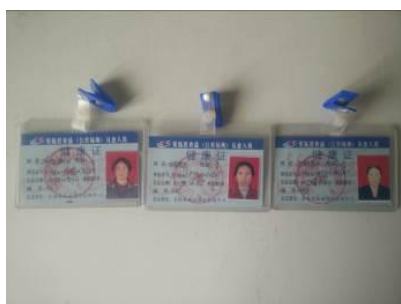
图 17 厨师健康证图