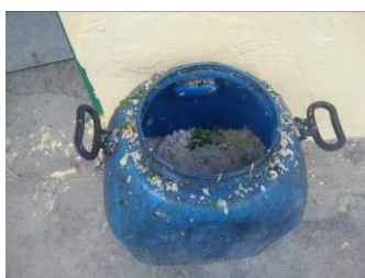
图 22 餐后的剩菜剩饭组图（300 余人用餐后的餐余）