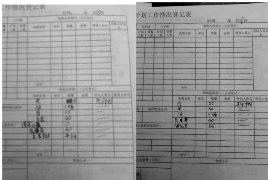
图 13 入、出库登记表组图