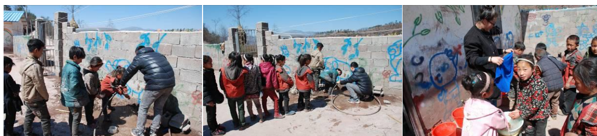
图5 学生餐前洗餐具洗手组图