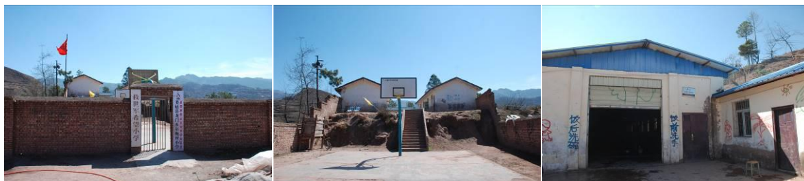
图 1 学校外景内景组图

免费午餐于 2013 年 9 月 2 日在该校正式开餐。中国社会福利基金会免费午餐基金向该校提供一笔开餐资金（用于购置冰箱等或厨房用品等）。免费午餐基金现向该校 9 名教职工和 47 名学前班儿童提供 4 元/人的午餐，且向 2 名厨师发放工资 900 元/月。小学生有由国家营养改善计划提供的 4 元/人的午餐费。该校没有寄宿生。