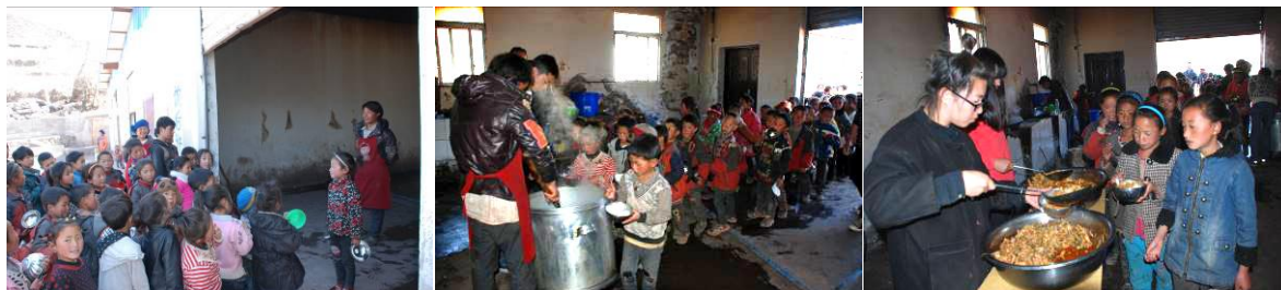
图 9 学生排队分餐图组