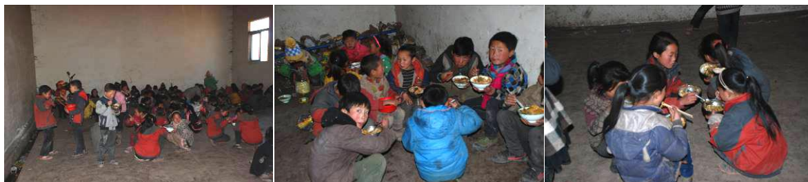
图 10 学生厨房用餐图组