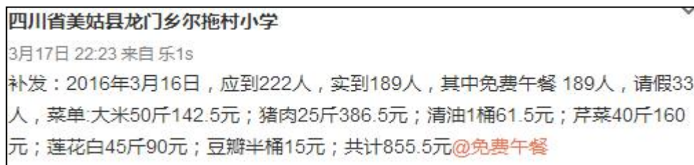
图 2 该校就餐情况微博公示截图

当日就餐人数：学生 189 人+教职工 10 人+调查者 2 人=201 人(调查者缴餐费 5 元)。实际用餐人数与该校微博公示人数不符。