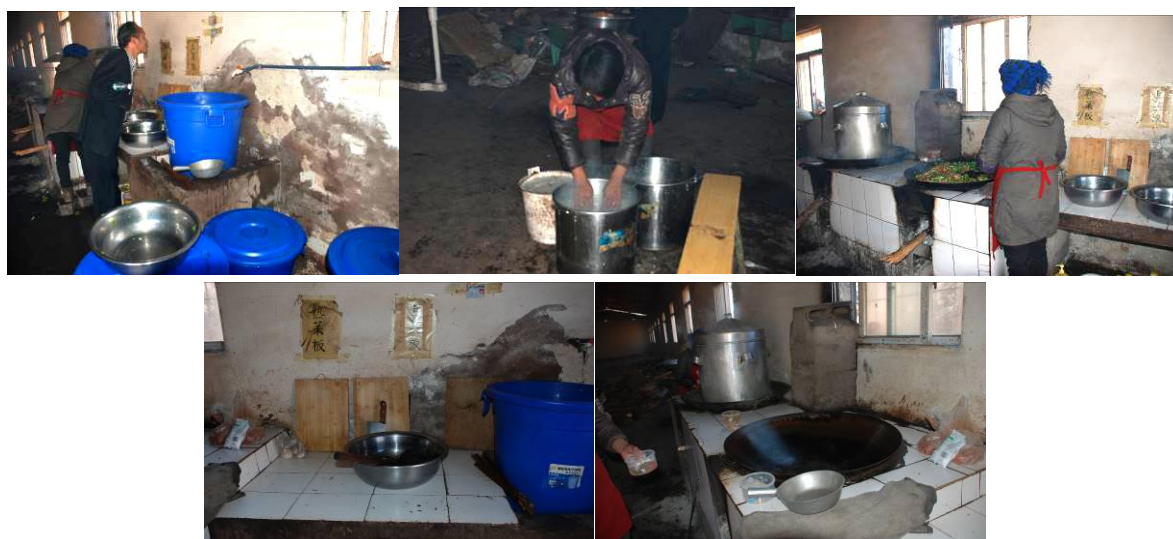
图3 厨房厨师情况组图