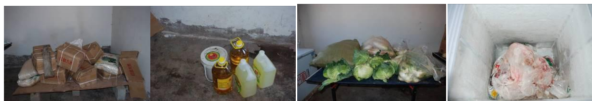
图4 该校食材储存情况组图