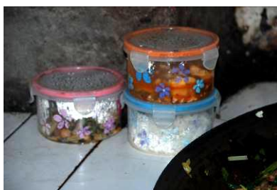
图 8 学校菜品留样不合规