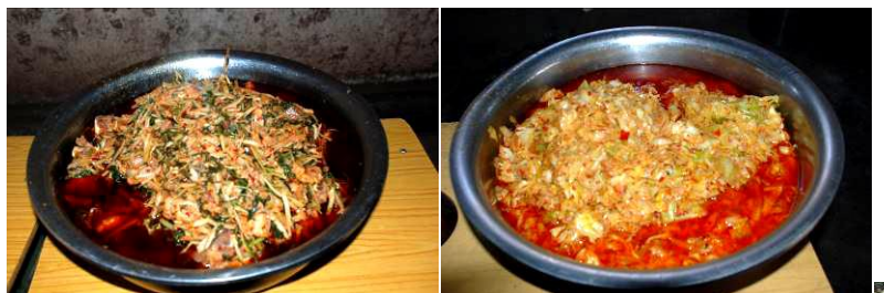
图 6 学校菜品组图

学校当天菜品是芹菜炒肉、烧莲花白，主食为米饭；调查者当天在学校与师生同餐，感觉菜品味道正常、无异味，且口感较好，米饭已煮熟无夹生，未见食品中有异物。现场所见学生和老​​师都能吃饱；查看学校微博及入、出库单，该校菜品品种符合免费午餐的要求。（见图 6）