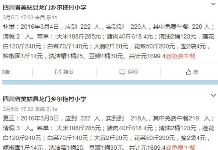
图 14 该校公示的微博