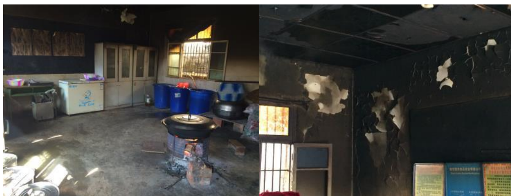
图5 厨房全景及局部

关于“墙地面卫生”，该校厨房房屋相对老旧，墙面烟尘明显，局部存在掉渣风险（图5）。根据稽核评分规则，该项评分取3分；