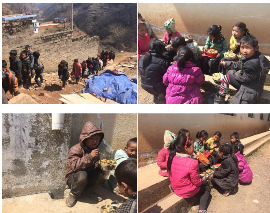
图 13 就餐现场组图