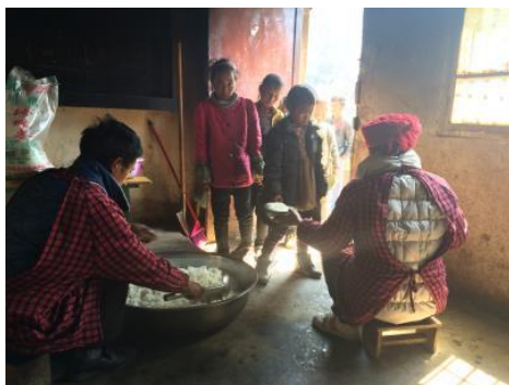
图4 在岗炊事员（未着工作帽）

关于“厨工头部卫生”，当日在岗两名炊事员均未按要求戴工作帽上岗。根据稽核评分规则，该项评分取3分；