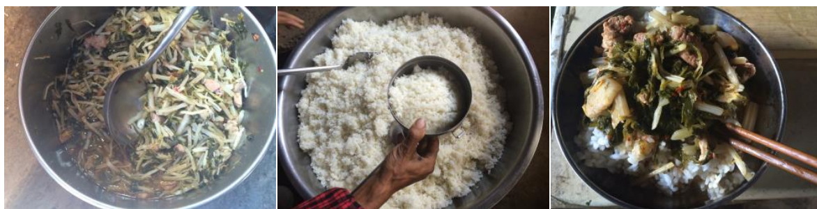
图 10 学生午餐饭菜组图