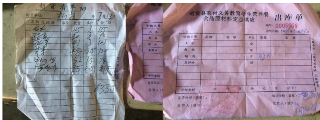
图 14 原始凭证组图

关于“现金流水账”，从阿牛老师介绍的情况来看，该校午餐资金实行报账制，学校日常不接触现金。根据稽核评分规则暂予以取满分 5 分。