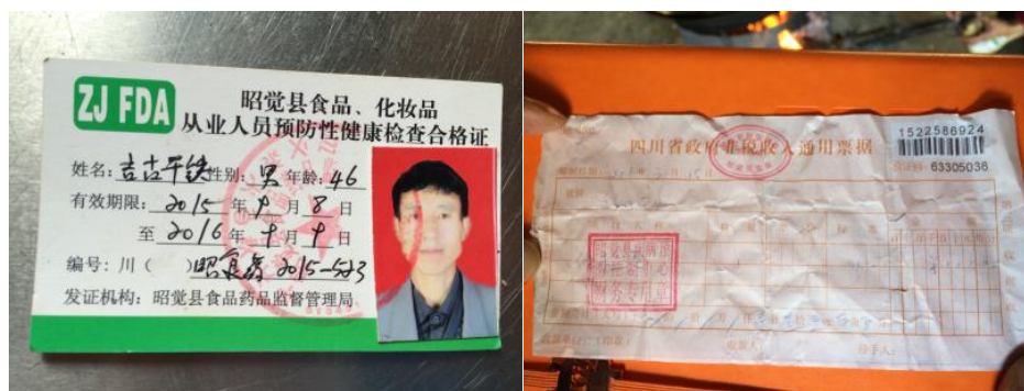
图 12 有效健康证 (右图为刚通过体检尚未领证的炊事员出示的体检费用收据)