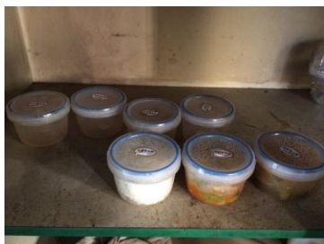
图 11 放置在常温下的食品留样

关于“食品留样”，调查当天该校日常食品留样被直接放在常温下，没有放入冰柜冷藏，根据食品留样制度视为无效留样。根据稽核评分规则，该项评分予以取 1 分；