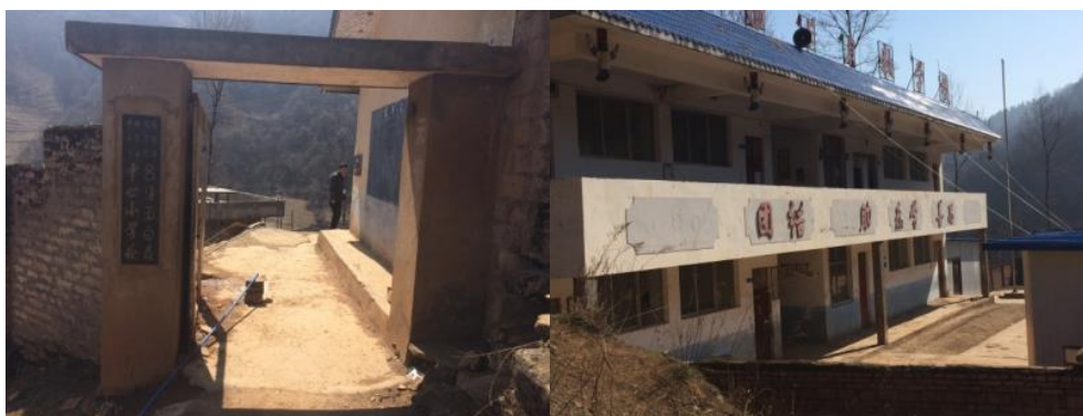
图2 学校大门及校园环境