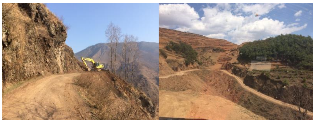
图1 前往色底乡的道路情况

3月17日上午,调查员自昭觉县城包车前往色底乡中心学校,于10点30分左右抵达色底乡中心学校门口。自昭觉县城至色底乡路段除县城至竹核段路况较好外,其余路段均为未硬化泥石盘山公路,全程道路狭窄,多处垮塌、修路,并需淌过无数条小溪,路况十分糟糕。调查员抵达色底乡中心学校后,查看了厨房卫生,简单了解学校午餐现状后驱车前往该校下属村小瓦姑村小,结束对瓦姑村小调查后返回色底乡中心学校就餐,并进一步了解学校午餐运行管理情况。相继结束两校调查工作后,原路乘车返回昭觉县城,并转乘客运班车于当日晚9点30分回到西昌市(41元/人),入住老海亭一米阳光客栈(100元/人)。