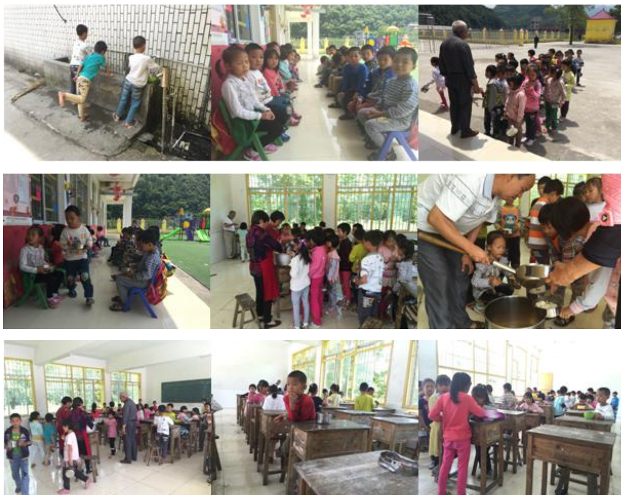
图 10 就餐过程组图