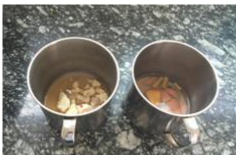
图 7 调查当日留样图

(3) “师生同餐”项得 0 分,原因是调查当日学校老师与学生所食用午餐完全不同。(如图 8)