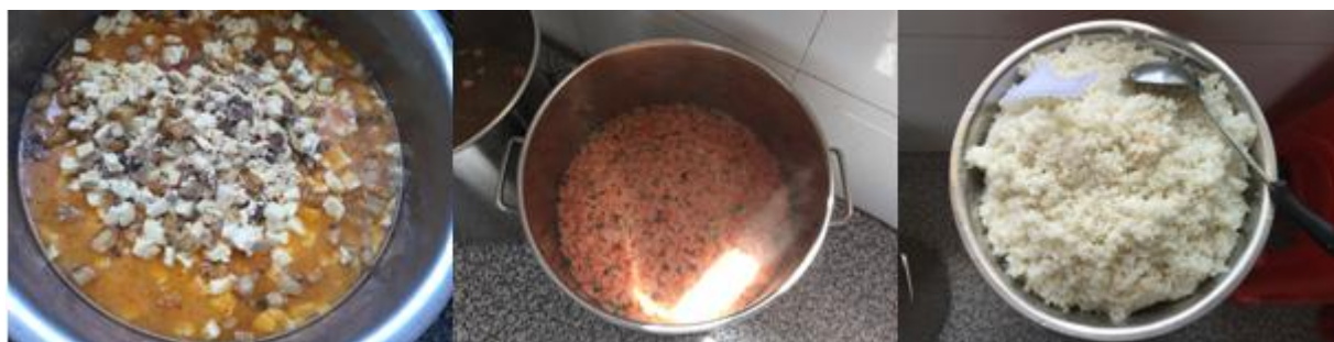
图 6 开餐当日菜品组图