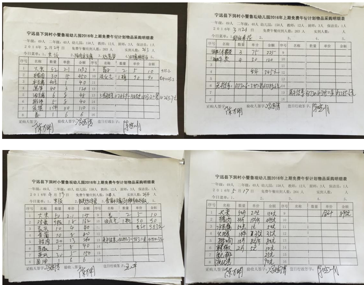
图 11 采购明细表组图

该校食材每天采购在鲁观集市采购, 由两位老师轮流采购, 轮流验收。调查人在该校调查期间, 该校提供的涉及本环节的登记表只有《采购明细表》, 表中能够体现每天采购的情况、用餐情况和资金情况, 内容基本完整, 现金收支清晰, 有较高的真实度。