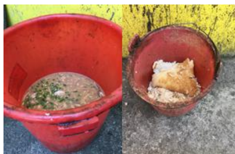
图 9 调查当日厨余组图