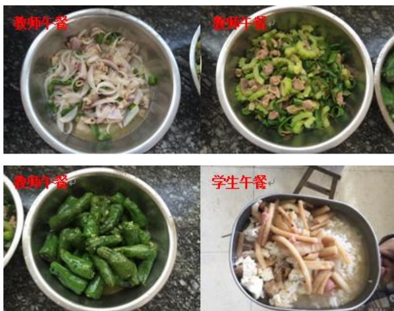
图 8 教师午餐和学生午餐对比组图