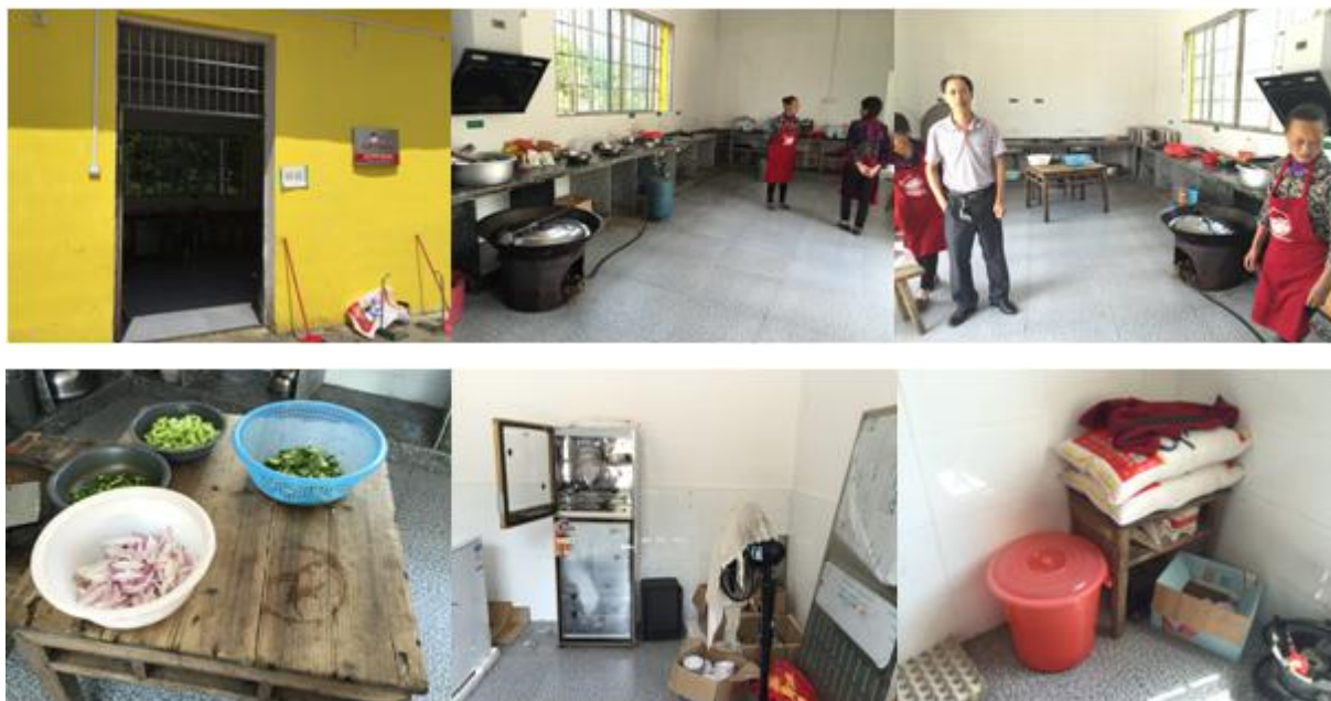
图4 厨房和储藏间情况组图

学生餐前洗手环节,开餐前学前班学生会在位于厨房外的水龙头处洗手,调查人观察就餐前部分学生会主动洗手。用餐完幼儿园餐具由厨师统一清洗,清洗完毕后放到消毒柜中保存并消毒。一、二年级学生餐具由学生自己清洗并保存。