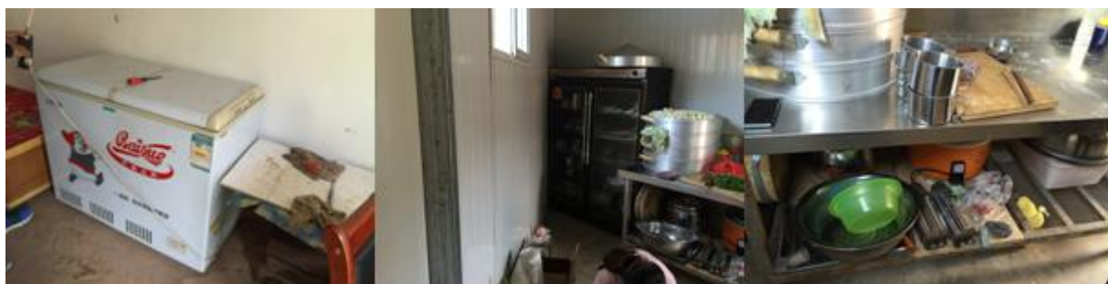
图 4 厨房和食材储存情况组图