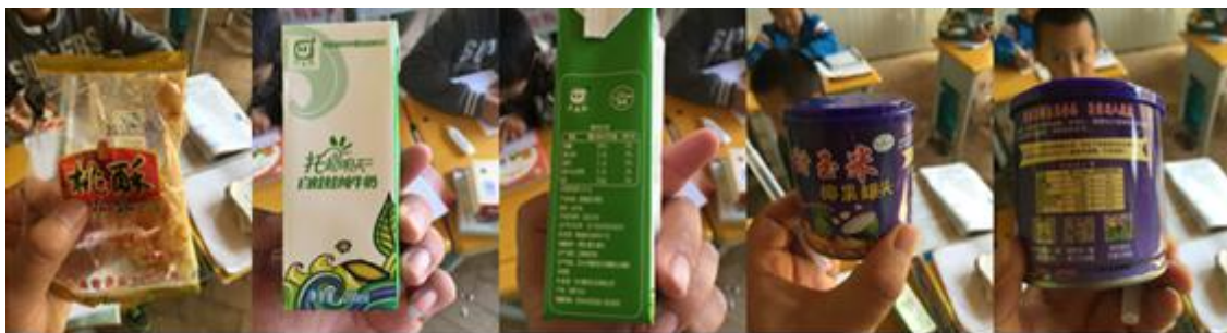
图3 早餐供应食材组图

2、学校微博发布不及时,无法查证学校用餐情况,从现场了解到,本学期起学前班不供应午餐,从之前微博公示情况看该校微博公示除了公示不及时外还存在虚报嫌疑,因此追加扣分10分。