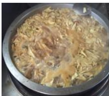
图 5 开餐当日菜品图