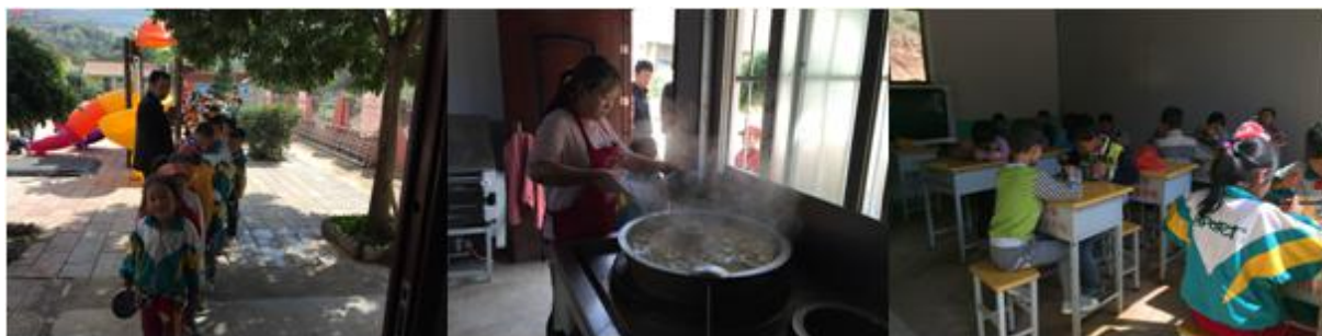
图 6 就餐过程组图