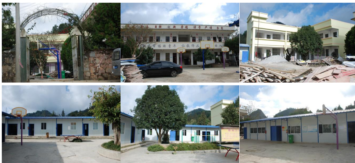
图 2 学校校园环境组图

该校有部分房屋属危房，已拆除，现学生宿舍、厨房及部分学生教室为简易房。另有一幢楼房在建中。