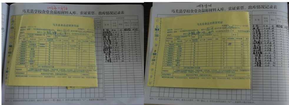
图 14 入库登记