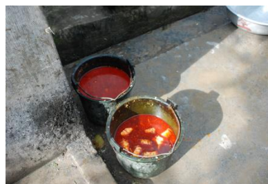
图 12 餐余图