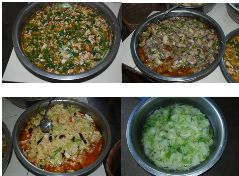
图 7 调查当日学生菜品组图