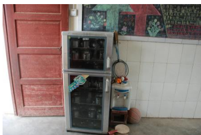
图 6 餐具消毒柜