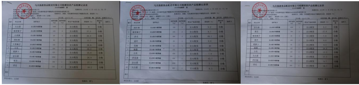
图 15 由配送公司自检自测的农产品检测记录表