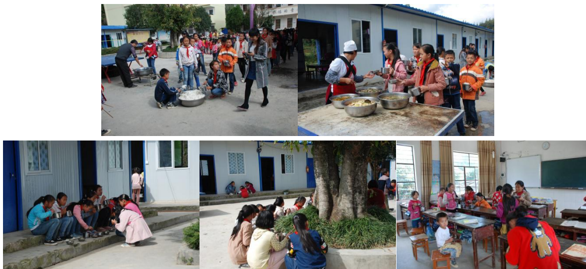
图 10 午餐就餐现场组图