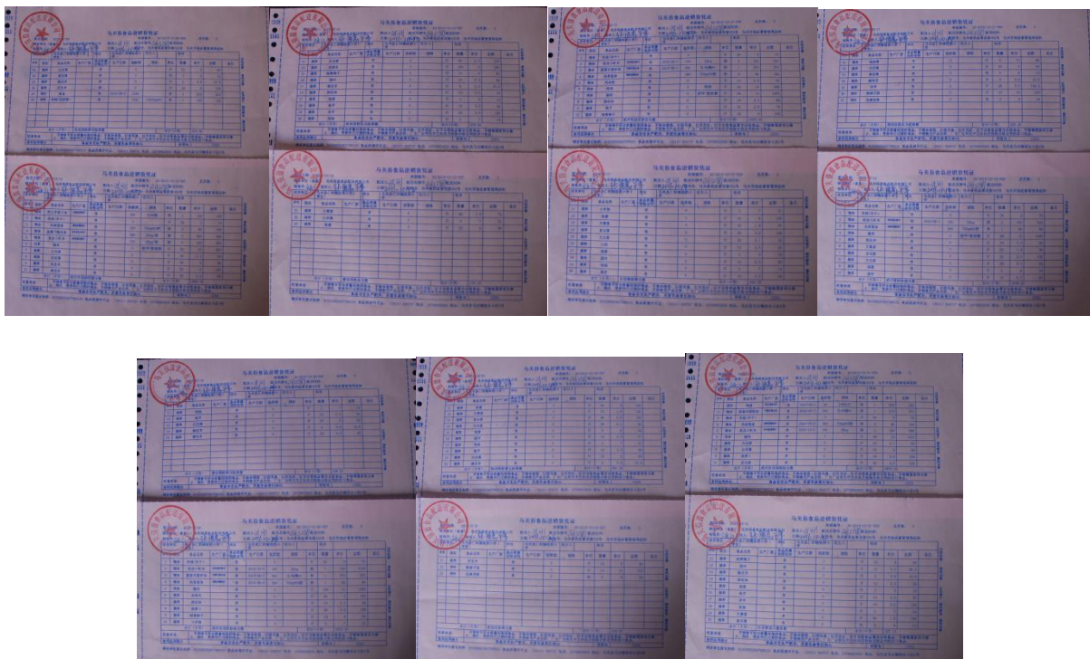
图 13 采购原始凭证