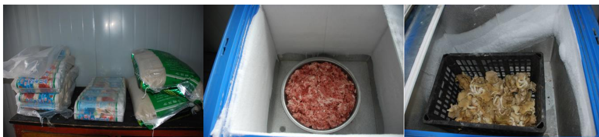
图 5 食材储藏室情况