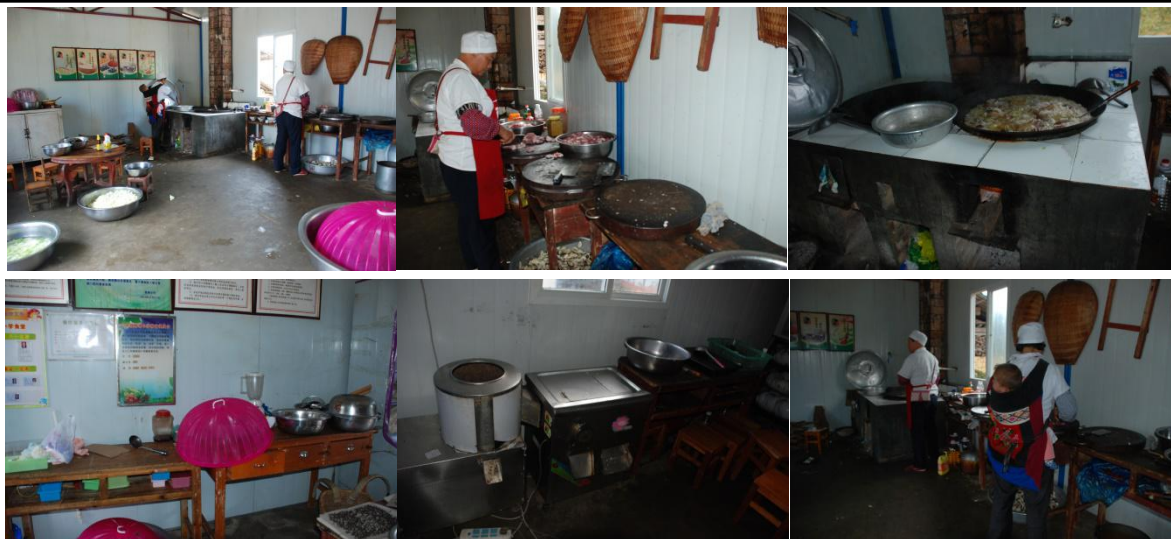
图 4 学校厨房及厨师情况组图