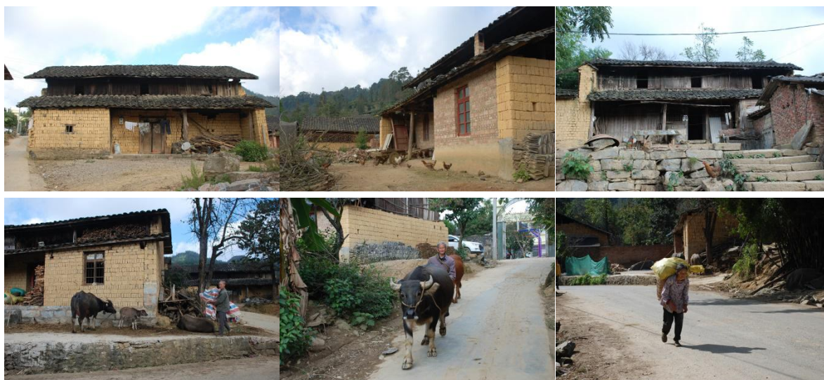
图 1 学校周边村民情况组图

11月16日, 调查马关县仁和镇格洒小学。上午 9: 20, 在县城汽车站外右侧乘木腊方向的小巴, 约四十分钟抵达格洒小学, 10: 15 进校调查, 下午 13: 30 离校, 乘小巴回县城。