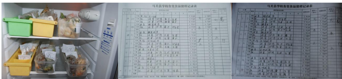
图 9 食品留样及登记表