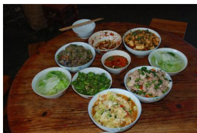
图 11 当天教职工午餐菜品图