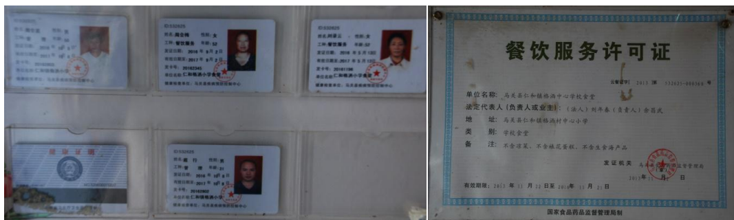
图 8 厨师健康证及餐饮许可证