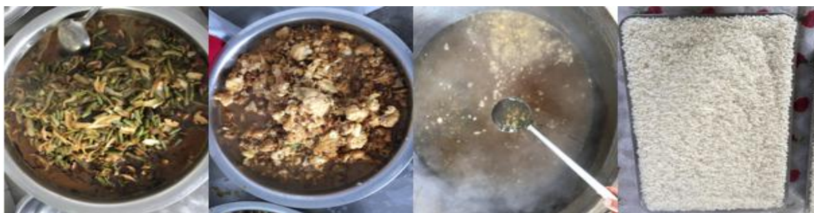
图 5 开餐当日菜品组图