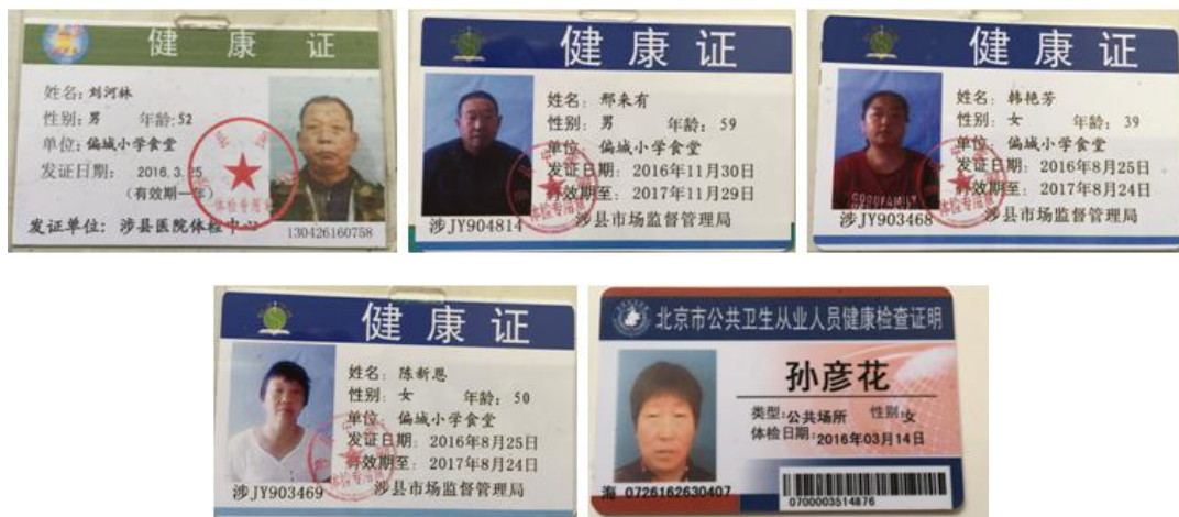
图 6 厨师健康证组图