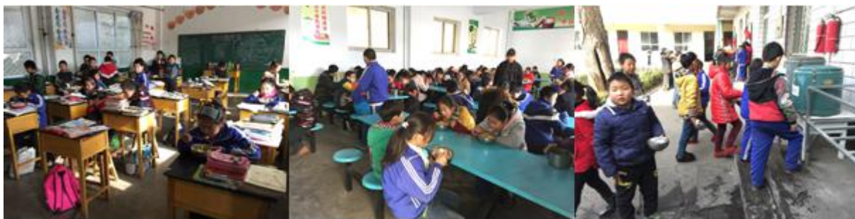
图 7 就餐过程组图