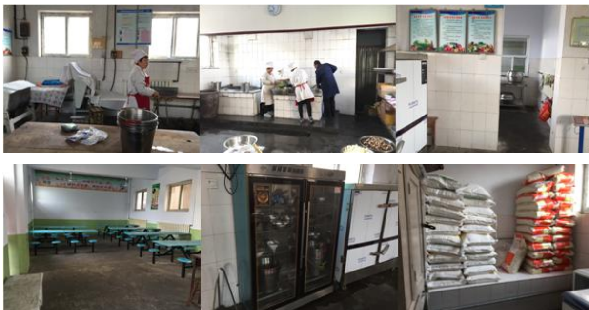
图 4 厨房和储藏间情况组图