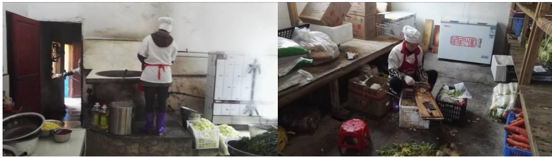
图 4 厨师卫生情况组图