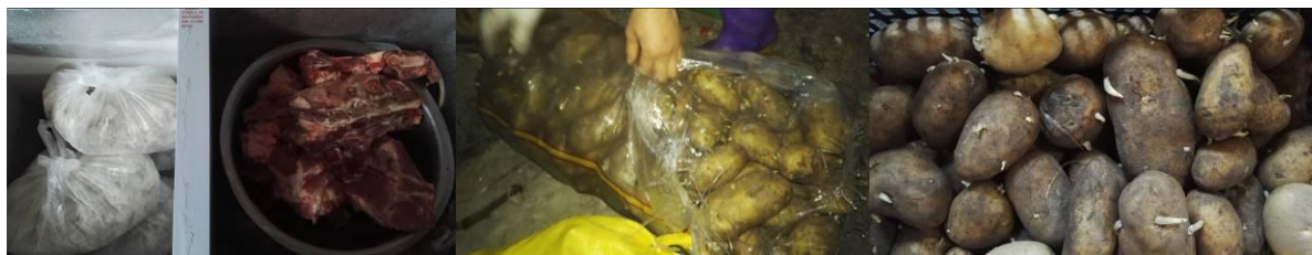
图 8 食材储存情况组图二