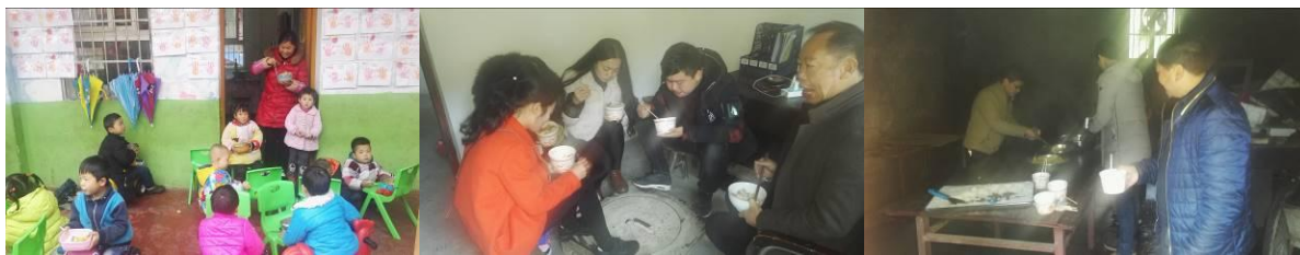
图 15 就餐情况组图