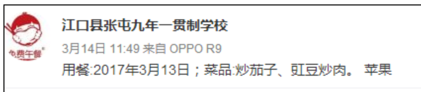
图 12 学校微博公示截图