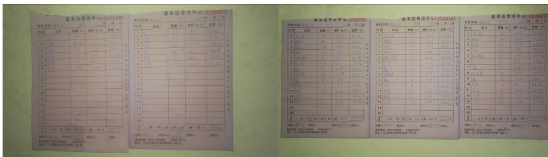
图 17 原始凭证组图