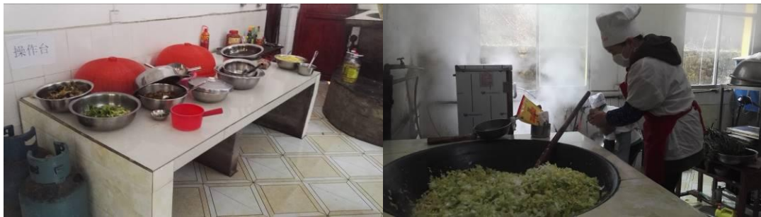
图 5 厨房卫生情况组图