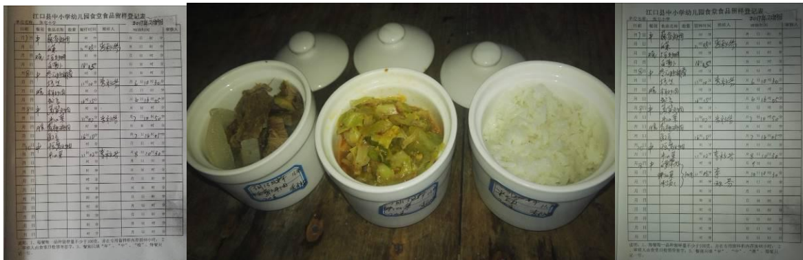
图 14 食品留样组图