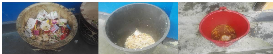
图 16 餐后剩菜剩饭组图