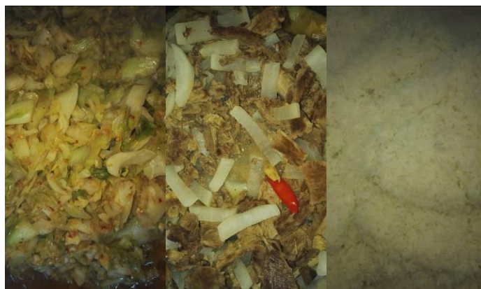
图 10 学校学生午餐食品情况组图