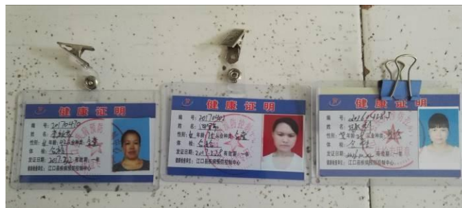
图 13 厨师健康证图