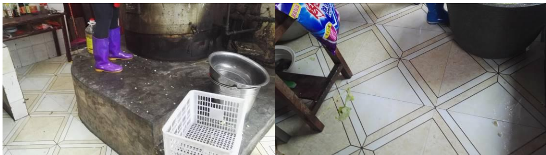
图 6 地面卫生情况组图