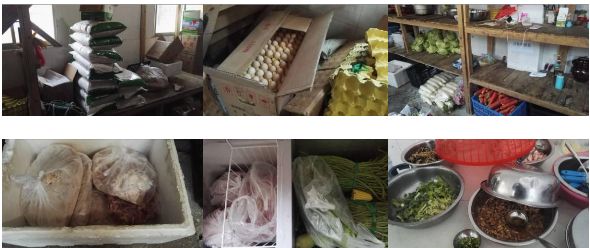
图 7 食材储存情况组图一