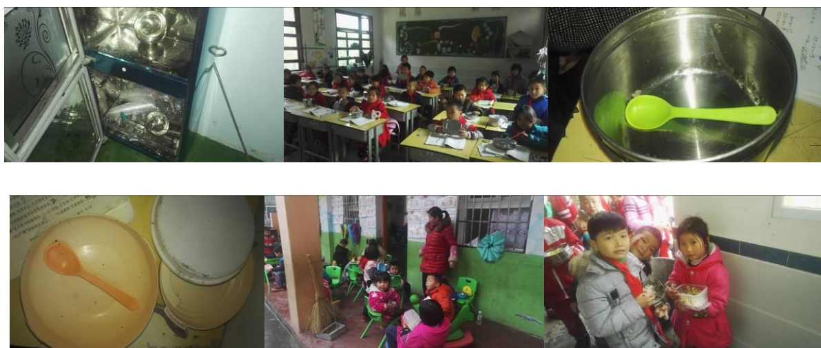
图 9 用餐卫生情况组图