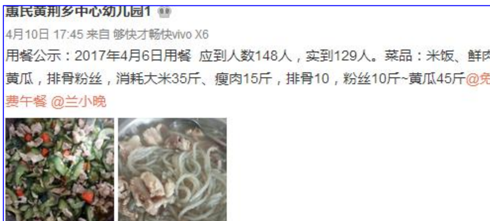
图 2 调查当天学校微博公示截图 (学校公示实到人数有笔误)