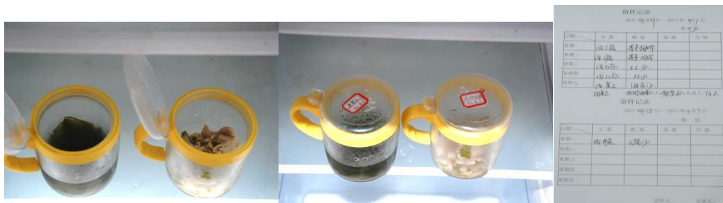
图 10 食品留样及留样记录组图 (主食未做留样，留样无效)