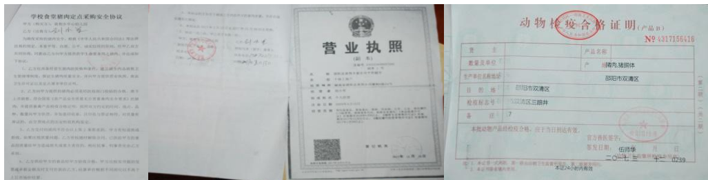
图 17 现金流账图 (未按要求登账)