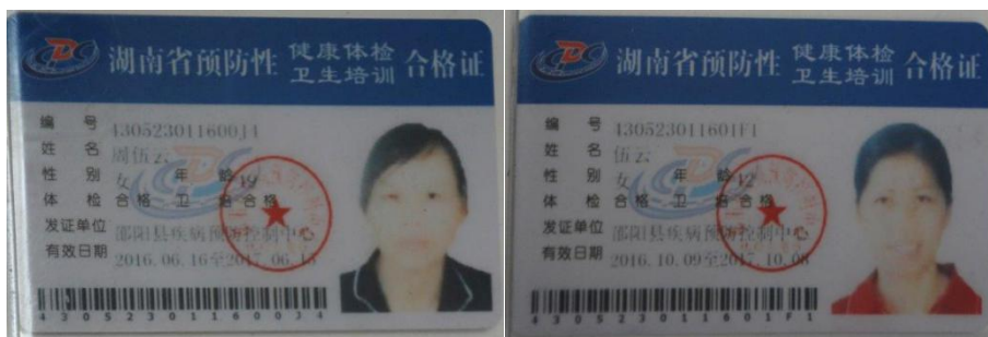
图 9 厨师健康证在有效期内组图