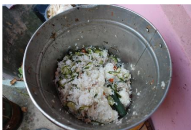
图 12 餐后剩饭菜图 (在正常范围)

惠民黄荆乡中心幼儿园1 1月14日 22:43 来自 够快才畅快vivo X6 期末放假信息公示格式: 本学期我校免费午餐用餐至X月X日结束, 学校2017年1月6日至2017年2月12日放假。我校下学期2017年2月12日开学, 计划2月13日开始提供免费午餐。 期末财务及库存公示格式: 本学期我校免费午餐已经结束, 配套资金支出0元, 收到拨款59827元, 餐费支出36092元, 本期余额为23735.1元。学校食材用尽无库存。 @免费午餐 @兰小晚 收起全文