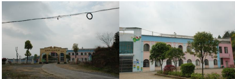
图 1 幼儿园环境图组

积 2000 多平方米,能容纳 300 多名儿童入园。2013 年 12 月 11 日免费午餐在该幼儿园正式开餐,现为免费午餐基金独立开餐学校,学校全员餐标为 4 元/人/餐。免费午餐基金现为该校 1 名厨师提供人工工资 1800 元/人/月,并视项目执行情况提供相关配套资金支持。幼儿园午餐在 12:00 开餐。