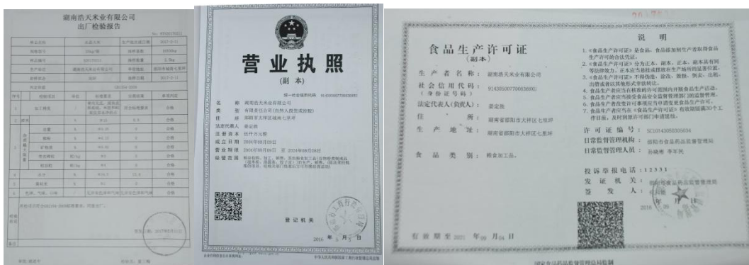
图 18 供应商档案/协议组图