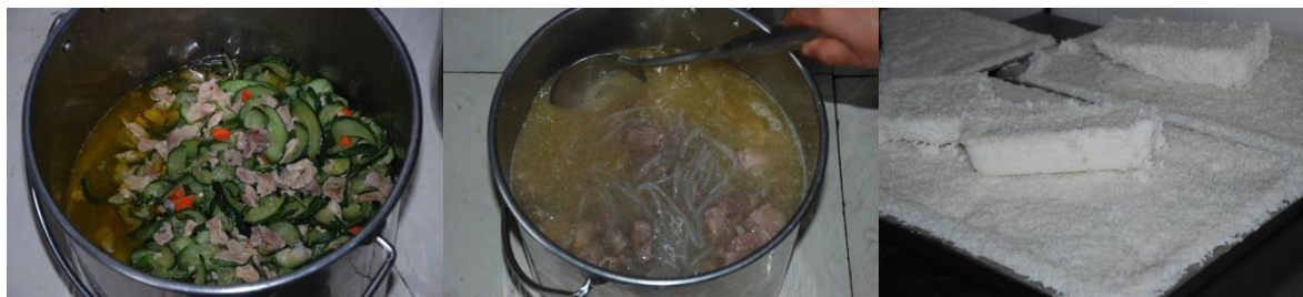
图 7 幼儿园午餐食品组图 (菜品味道良好) (黄瓜炒肉、粉丝排骨汤、主食为米饭)