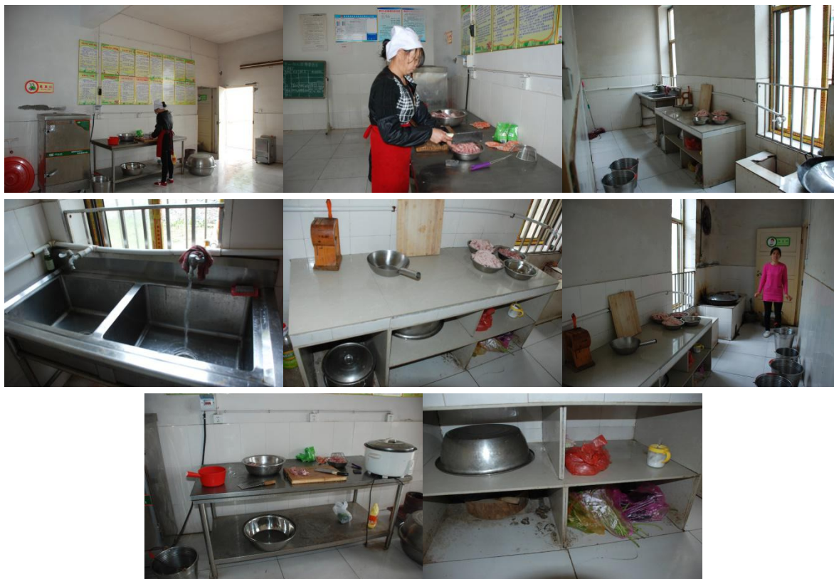
图 3 学校厨房、厨师情况组图