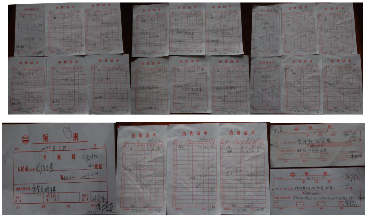
图 14 原始凭证组图（缺验收人员的签字）