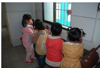
图 6 餐前少数孩子自觉洗手图