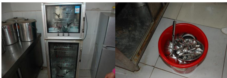
图 5 有消毒柜、且餐具每天消毒，但消毒后取出存放过隔夜组图