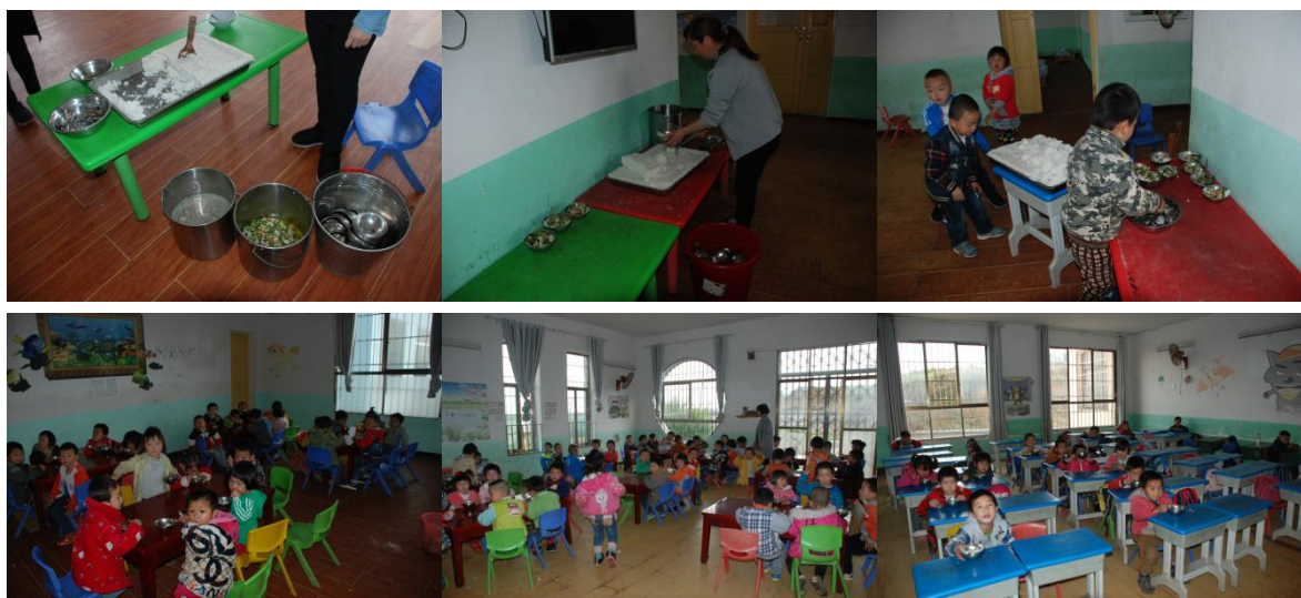
图 11 就餐情况组图 (有序就餐)