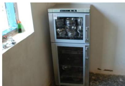
图 5 餐具消毒情况图