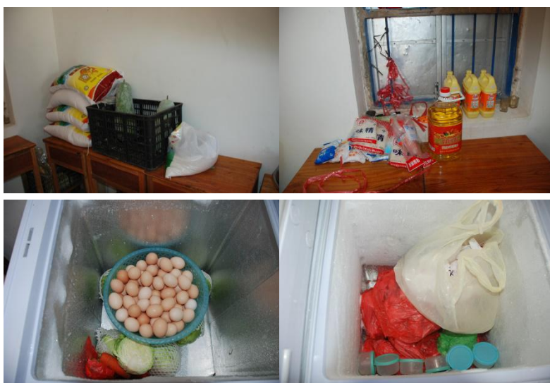
图 4 食材储存情况组图