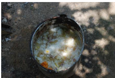
图 10 餐余情况图（有明显浪费）