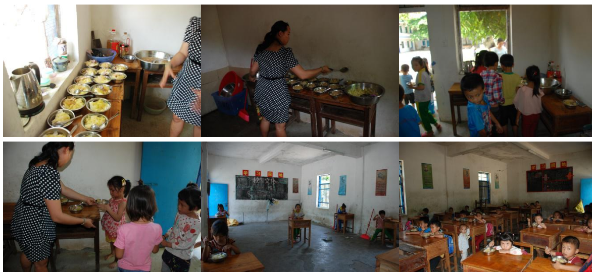
图 9 就餐情况图 (有序)