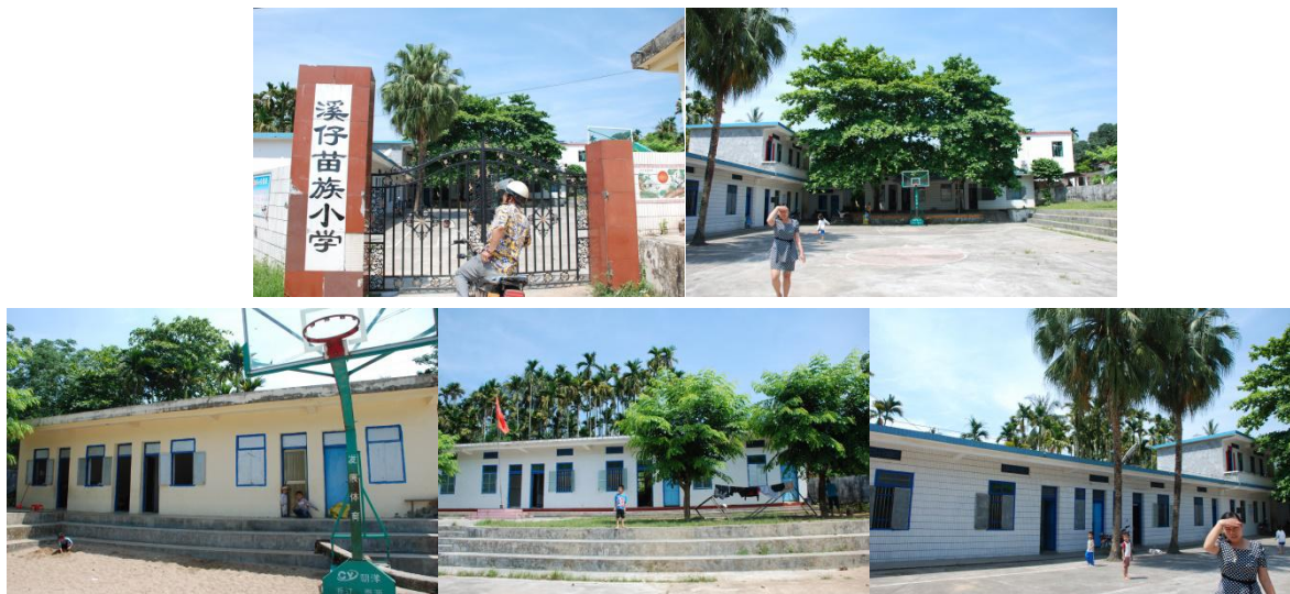
图 1 学校环境组图