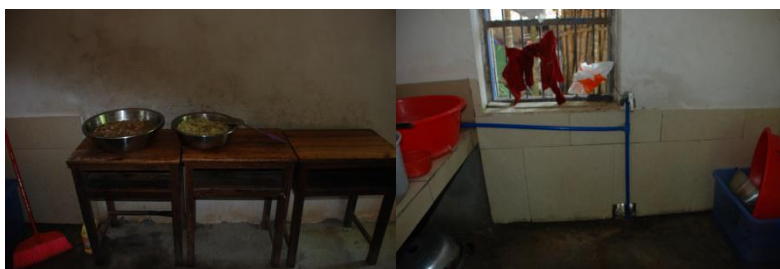
图 3 厨房厨师卫生情况组图（卫生情况良好）