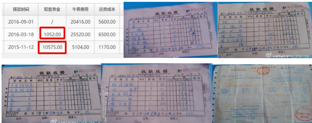
图 12 学校开餐时购买冰箱、消毒柜及其他厨房用品单据组图

该校于 2015 年 09 月 21 日正式开餐。学校启动配套设备资金分两次使用，第一次支出是 2015 年 11 月至 12 月，用于购买冰箱、消毒柜及其他厨房用品，官网拨款信息显示共花费 10575 元(见图 12)。经稽核专员现场查核，该项支出仅有 4868 元能对号，尚有 5707 元没有票据及实物。请学校服务中心相关人员与校方进行对账核查，找出原因，并公示其结果。