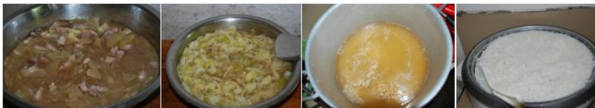
图6 学校午餐食品情况组图 (口感良好) (菜品为猪肉炒冬瓜、炒白菜、冬瓜汤, 主食为米饭)