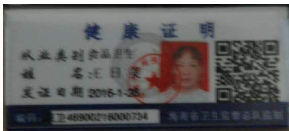
图 7 厨师健康证图 (已过期)