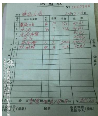
图 13 学校厨房装修花费单据图

第二次支出的 1052 元是 2016 年 2 月 11 日用于学校厨装修(见图 13)，经稽核专员现场查核，此项支出情况基本属实。