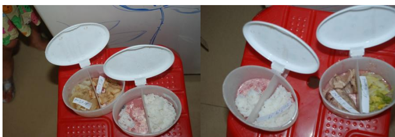
图 9 食品留样组图 (无效)