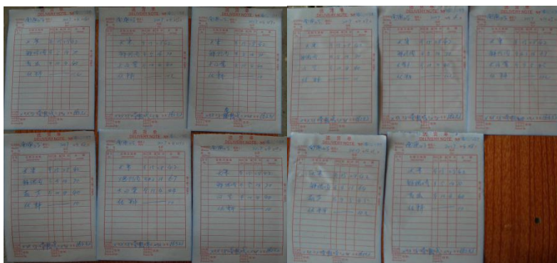
图 13 出库登记组图