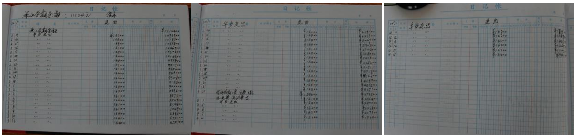
图 14 现金流水账组图