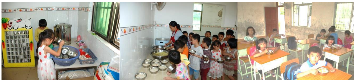
图 10 就餐情况图 (有序)