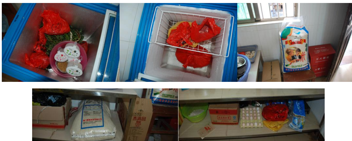
图 4 食材储存情况组图