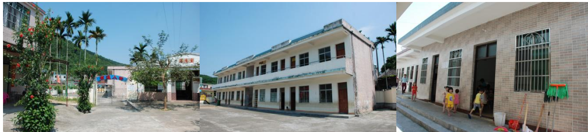
图 1 学校外观环境组图

年 5 月 31 日引入免费午餐项目, 免费午餐基金为学校开餐提供了一部分启动资金。现为全校师生提供 4 元/餐的午餐费, 为该校 1 名厨师每月支付工资 900 元, 并为学校提供其他水、电、燃料等相关费用。该校午餐为 10: 40 左右开餐。该校有校内幼儿园, 有幼儿 38 人, 幼儿园属私立, 未申请免费午餐, 幼儿另单独用餐。