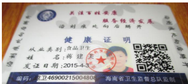
图 8 厨师健康证图 (已过期)