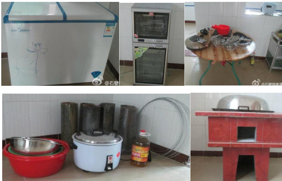
图 15 学校开餐时购买冰箱、消毒柜及其他厨房用品单据及实物组图