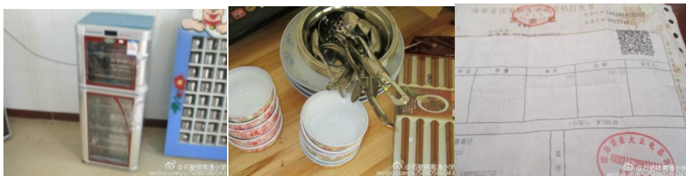
图 17 学校厨房装修花费单据组图

第二次支出的 625 元是 2015 年 3 月学校用于购买消毒柜等 (见图 17), 经稽核专员现场查核与校方提供票据对账, 此项支出情况属实。