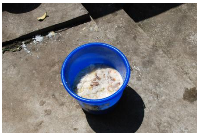
图 11 餐余情况图 (正常)