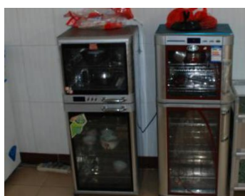
图 5 餐具消毒情况图