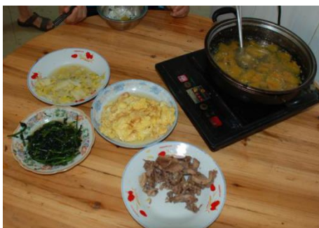
图 7 教职工午餐食品情况图