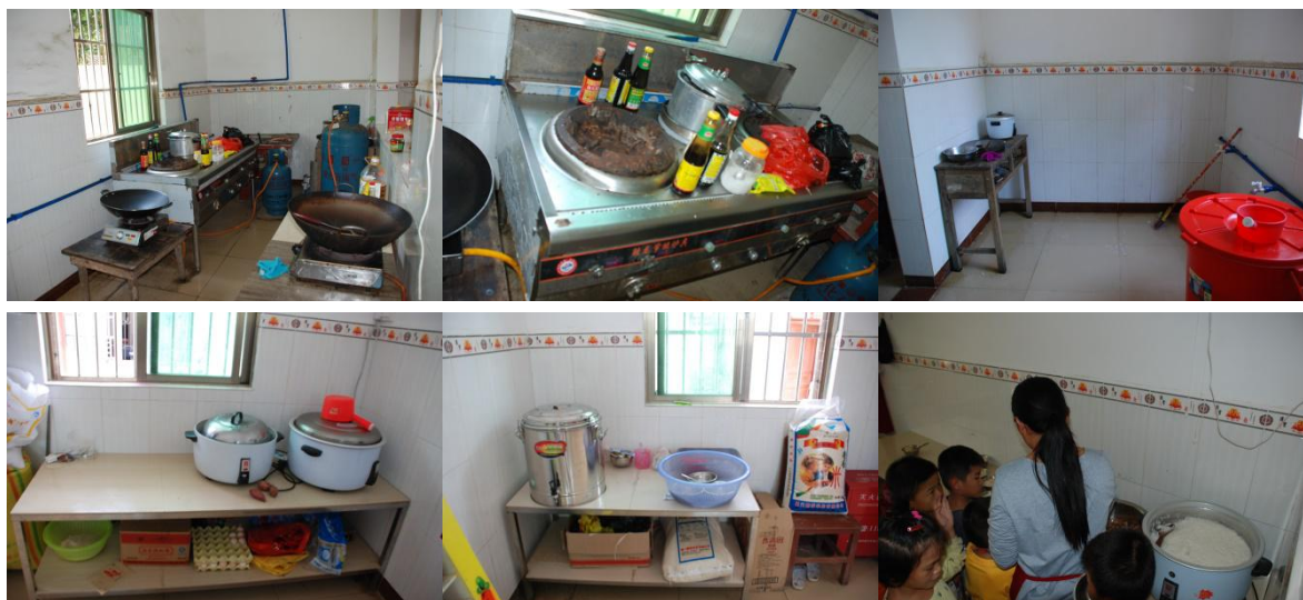
图 3 厨房厨师卫生情况组图 (卫生情况良好)