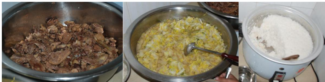
图 6 学生午餐食品情况组图 (菜品为炒鸭肉, 炒白菜, 主食为米饭)