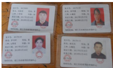
图 9 厨师健康证图 (均在有效期内)