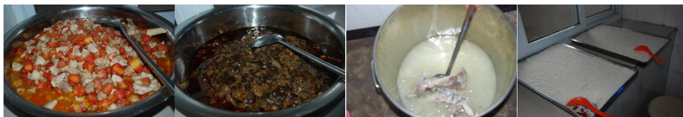
图 8 学校午餐食品情况组图 (主食菜品丰富充足, 无异味、无异物、口感良好)