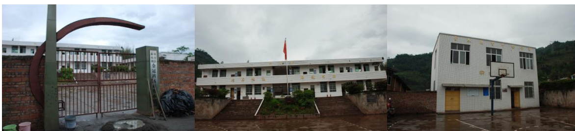
图1 学校外观环境组图