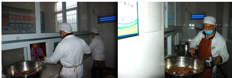
图3 厨师卫生情况组图