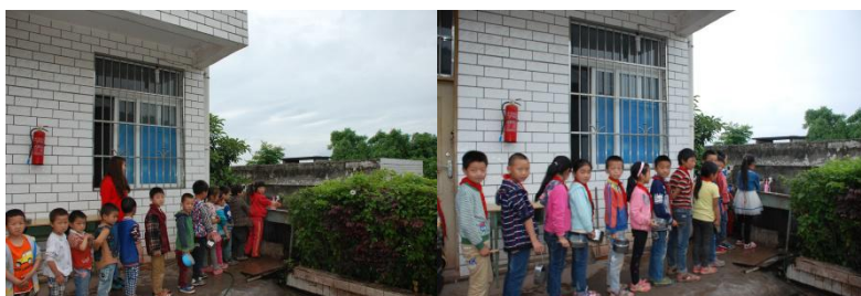
图 7 学生餐前排队洗手组图