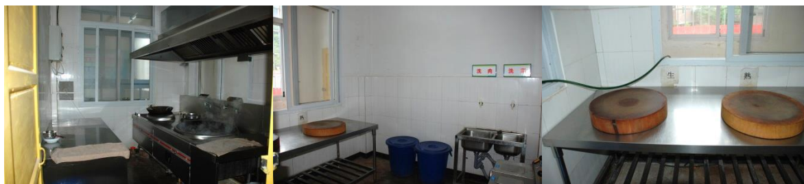
图4 厨房卫生情况组图