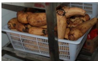
图6 莲藕有变质现象