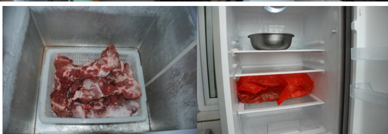
图5 食材储存情况组图