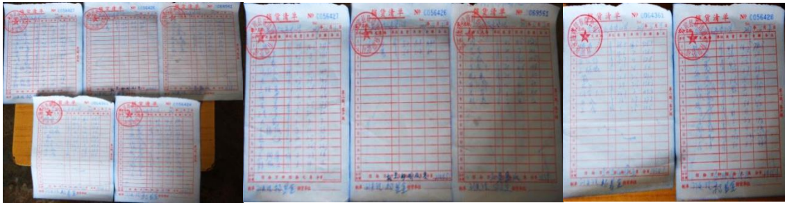
图 13 原始凭证组图