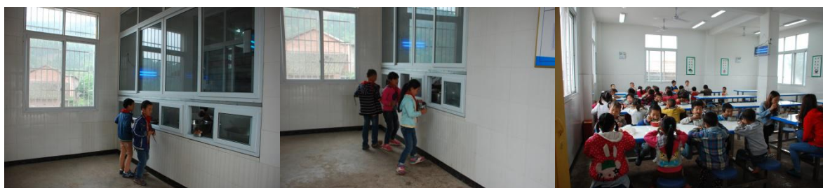
图 12 就餐情况组图 (就餐秩序井然且师生同餐)