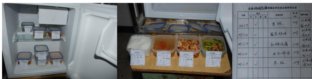
图 11 食品留样组图 (留样规范有效)