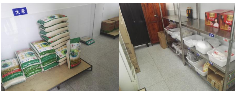
图 II-4 食材储存情况组图