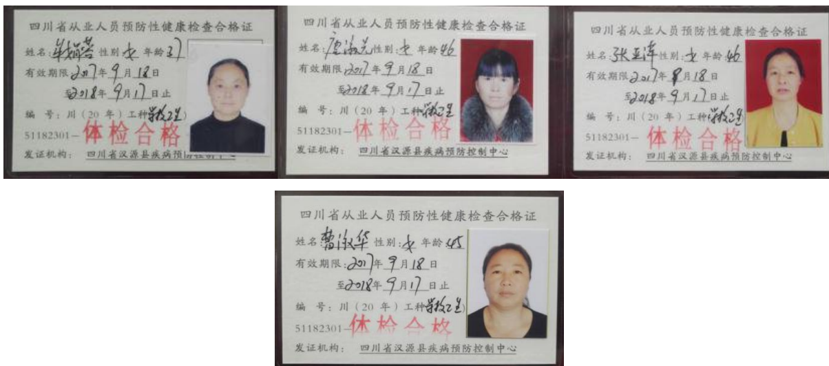
图 I -1 厨师健康证组图