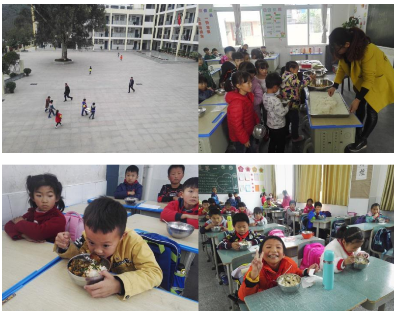
图III-2 就餐情况组图（排队、分餐、就餐）