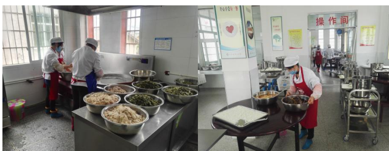
图 I -3 厨师卫生情况组图