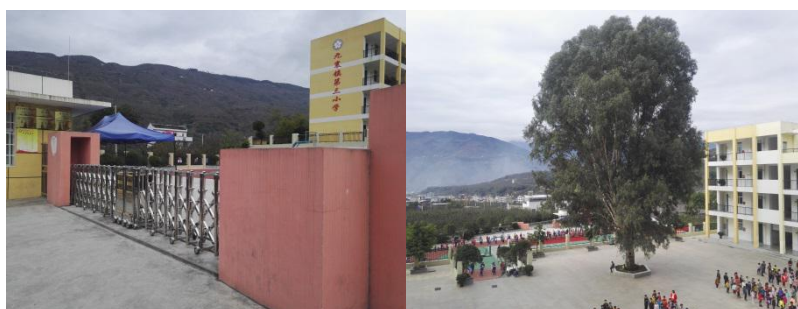
图 2 学校情况组图