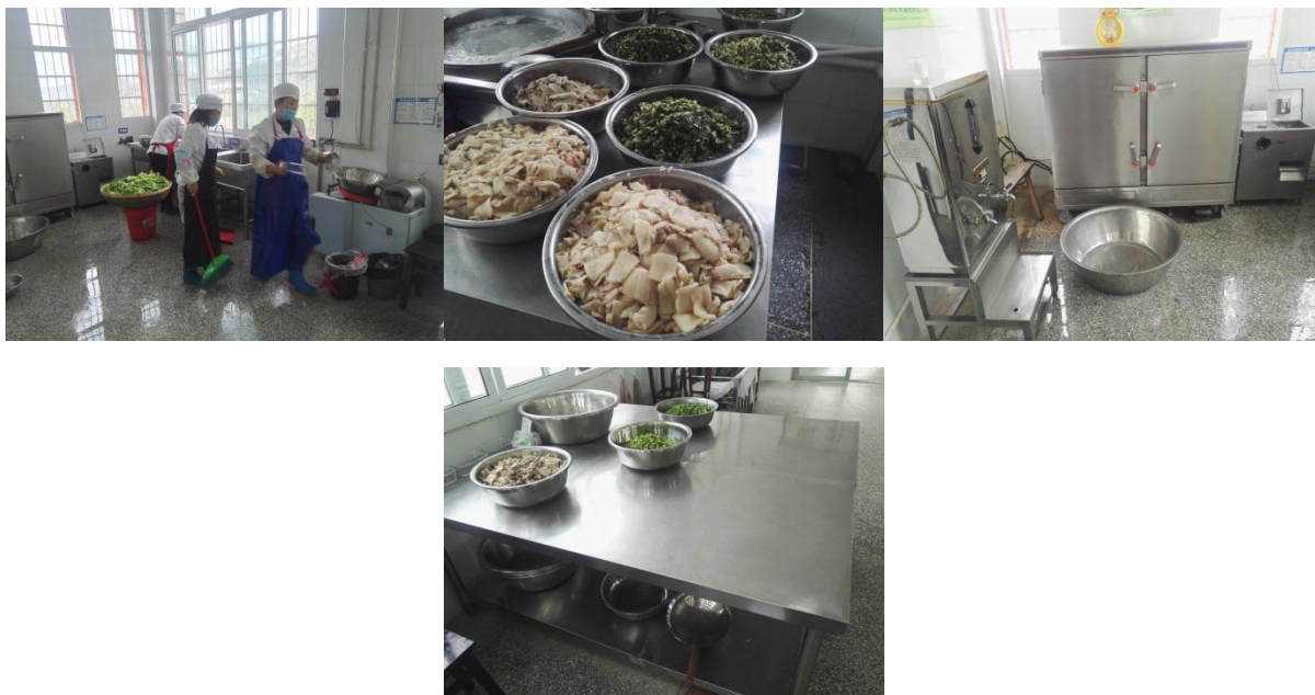
图 I -2 厨房卫生情况组图