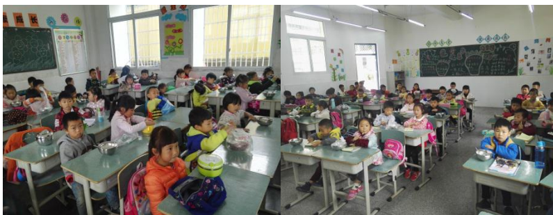
图III-4 就餐卫生（餐前洗手、餐具消毒、餐具清洗）