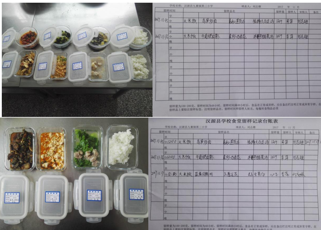
图 I -5 食品留样情况组图