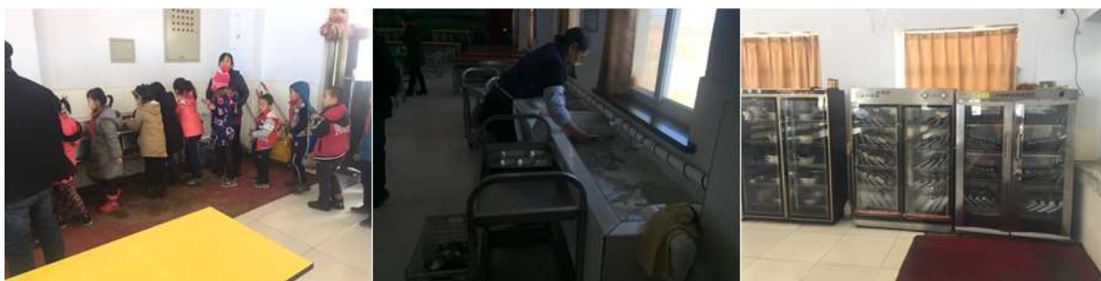
图III-3 就餐卫生情况组图（从左到右依次为餐前洗手、餐具清洗、餐具消毒）