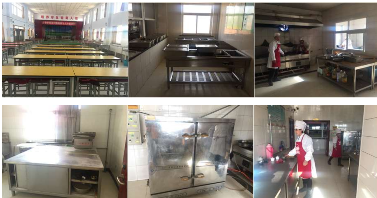
图I-2 餐厅、厨房卫生情况组图