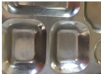
图III-5 未清洗干净的餐具图