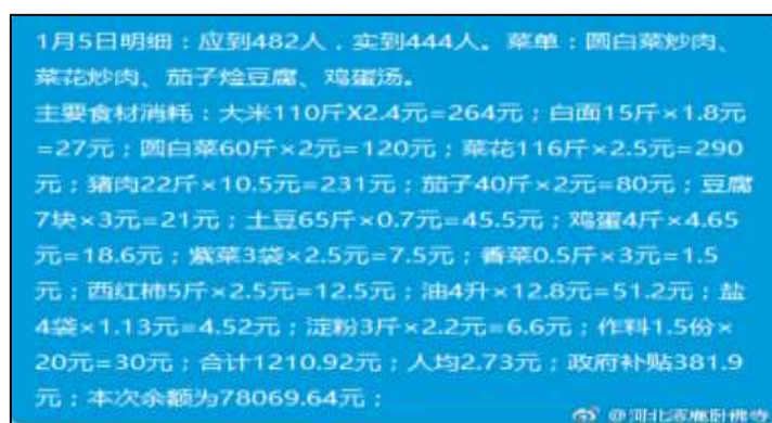
图IV-1 开餐当日微博截图