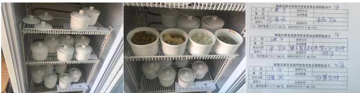
图I-4 食品留样情况组图