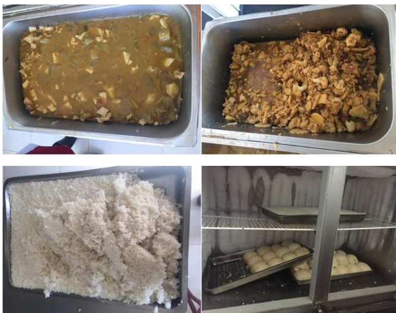
图3 开餐当日（1月5日）厨余组图