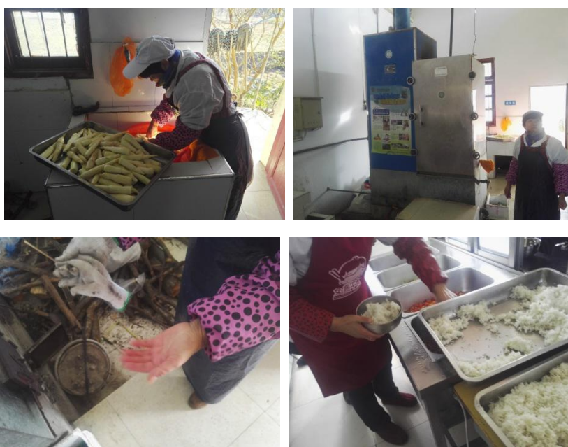
图 I -3 厨师卫生情况组图