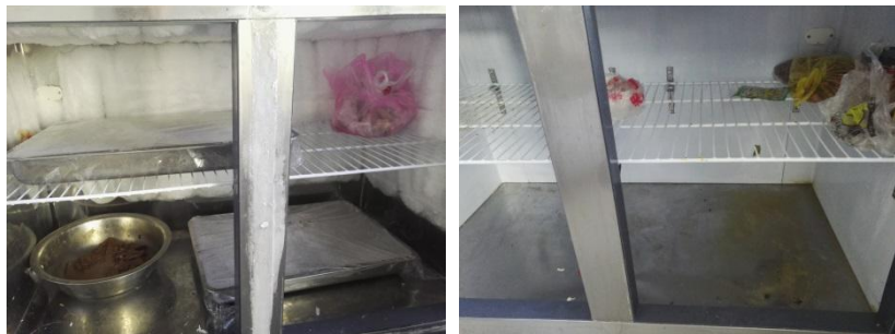
图 I-6 冰柜内部卫生情况组图