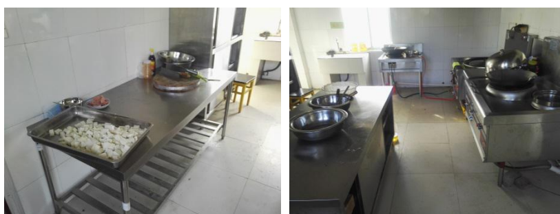
图 I -2 厨房卫生情况组图