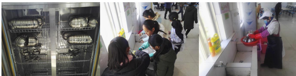
图III-3 就餐卫生情况组图