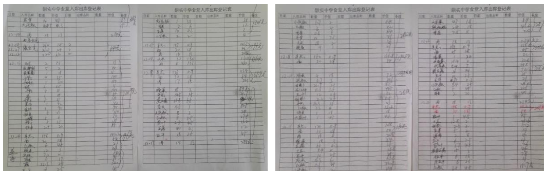
图 II-2 入库登记组图