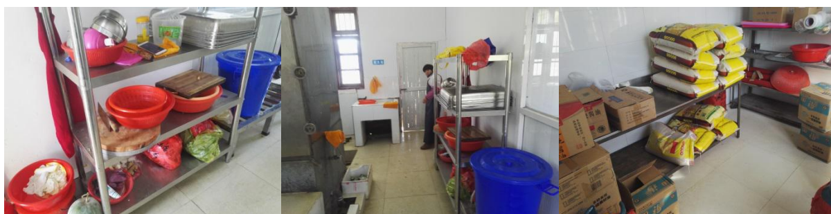
图 I -4 食材储存情况组图