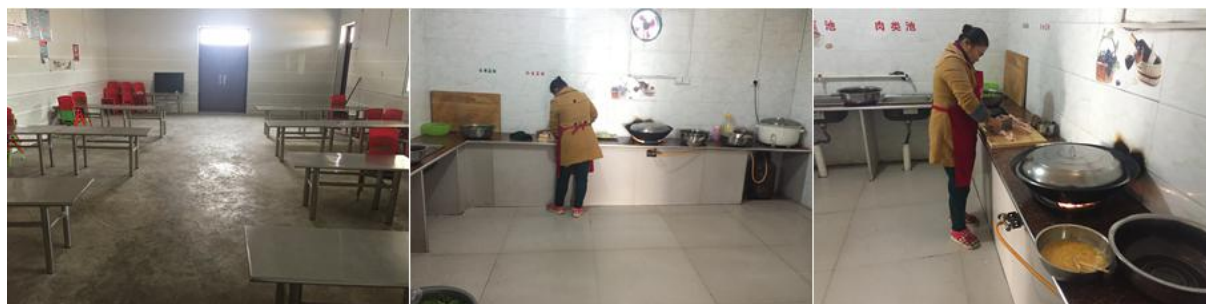
图 I -2 食堂、厨房和厨师卫生情况组图