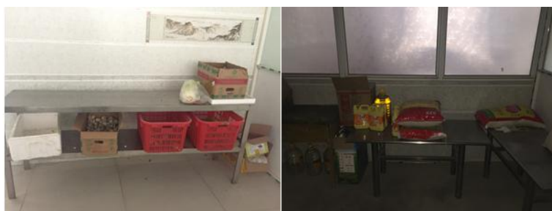
图 I -3 食材储存情况组图