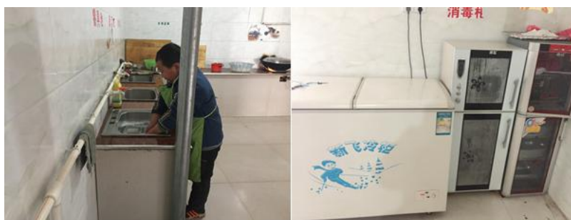
图III-3 就餐卫生情况组图