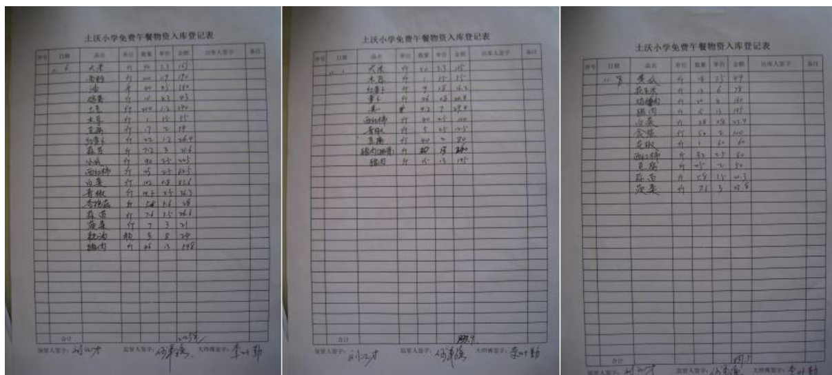
图 II-2 入库登记表组图