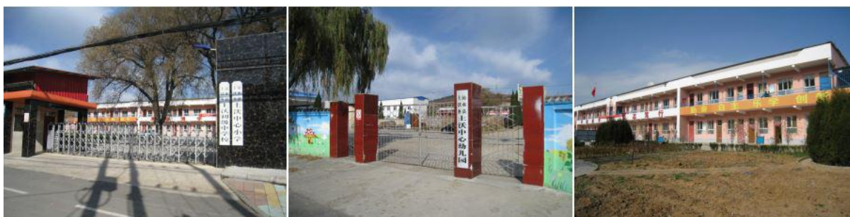
图 1 学校情况组图