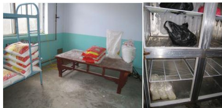
图 I -4 食材储存情况组图