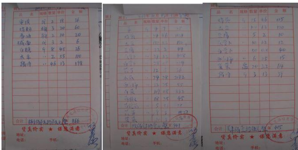
图 II-5 原始凭证组图