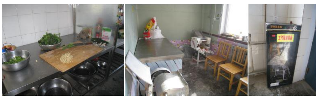
图 I -2 厨房卫生情况组图