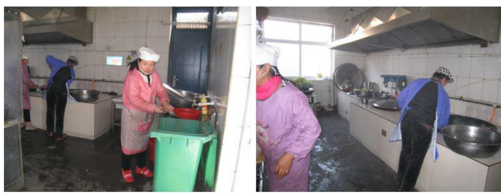
图 I -3 厨师卫生情况组图