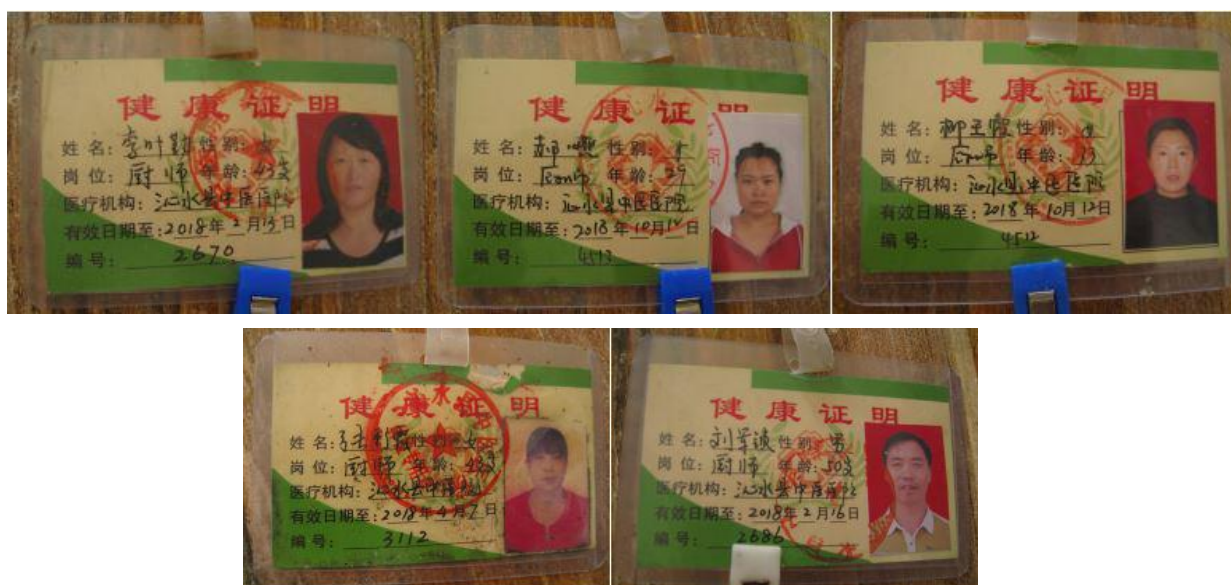
图 I -1 厨师健康证组图