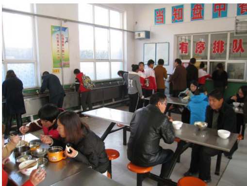
图III-3 师生同餐问题图