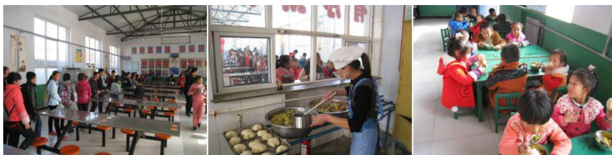
图III-2 就餐情况组图（排队、分餐、就餐）