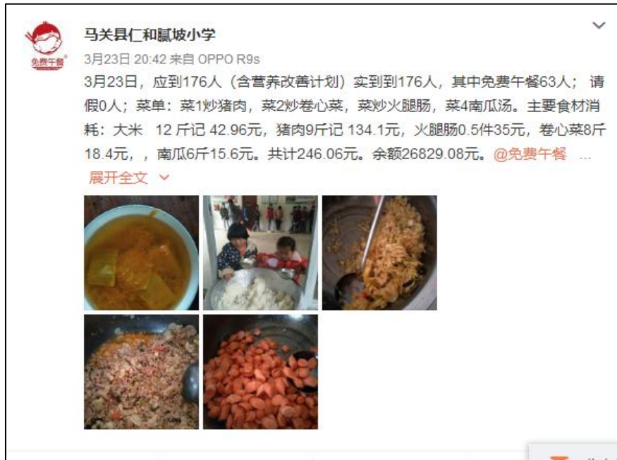
图IV-1 稽核当日学校微博截图