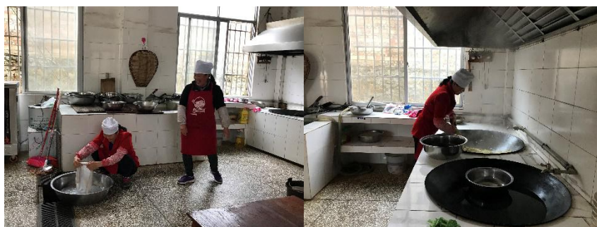
图 I -3 厨师卫生情况组图