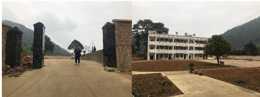
图 2 学校大门及校园环境组图