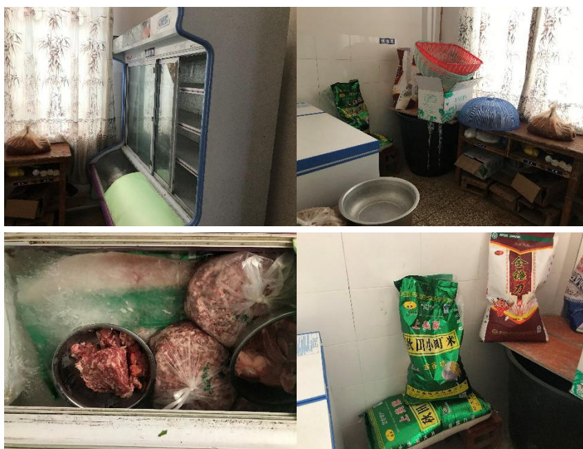
图 I -4 食材储存情况组图