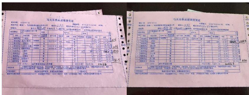
图 II-1 原始采购凭证组图