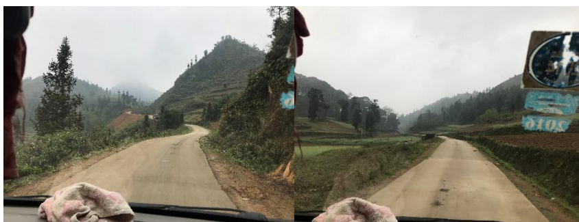
图 1 腻坡小学附近道路组图

交通说明：前往腻坡小学可在马关县汽车站站前广场或者马中路搭乘公交车或面包车前往仁和镇，然后再包车前往该校。