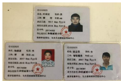
图 I -1 厨师健康证组图