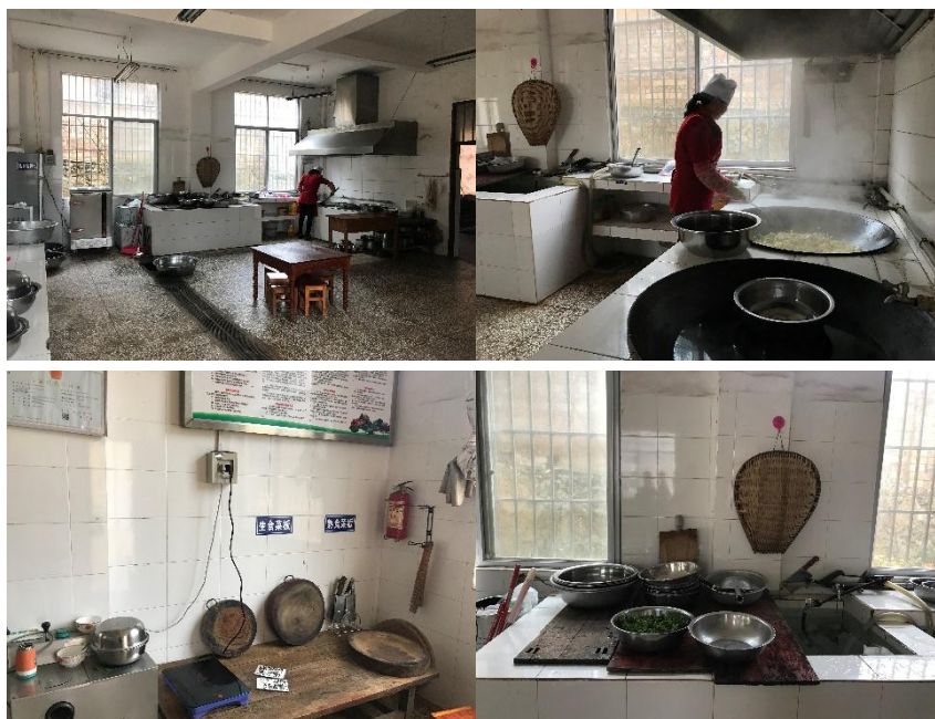
图 I -2 厨房卫生情况组图