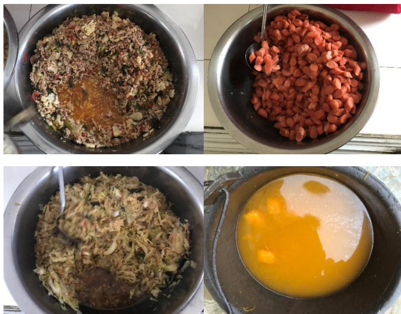
图Ⅲ-1 稽核当日菜品情况组图