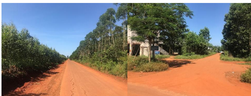
图 1 土南小学周边道路组图

交通说明：澄迈县城至土南小学可从县城搭乘福山镇方向公交车抵达土南路口后徒步或者搭乘过路车辆前往土南小学。县城至土南路口公交方便，路况良好；土南路口至土南小学约 4 公里，日常无营运车辆，只能选择徒步或搭乘过路车前往，全程路况良好。