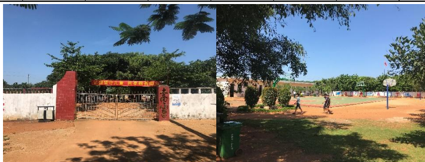
图 2 学校大门及校园环境组图