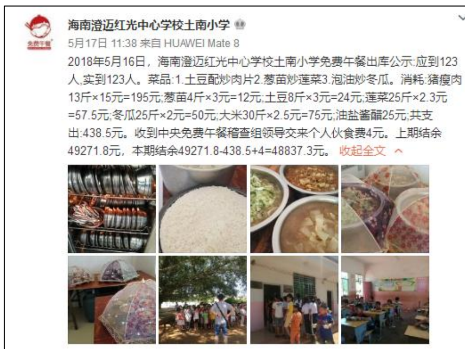
图IV-1 稽核当日学校微博公示