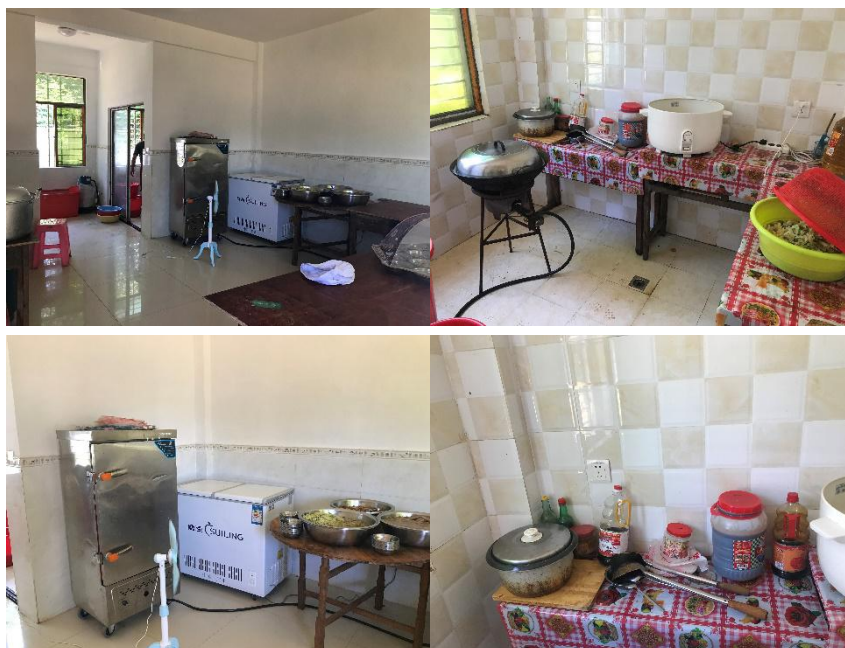
图 I -2 厨房卫生情况组图