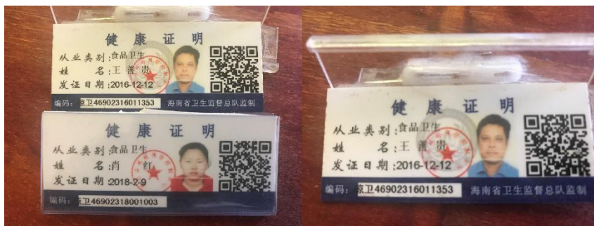
图 I -1 厨师健康证组图 (右已过期)