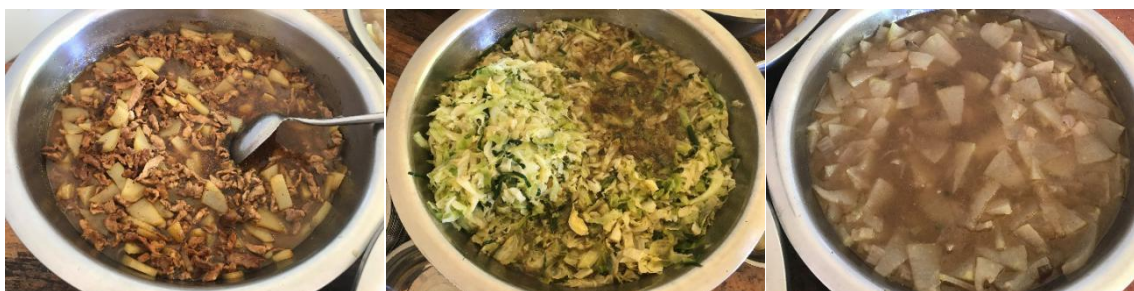
图III-1 稽核当日菜品情况组图