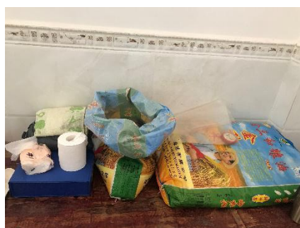
图 I -4 食材储存情况图