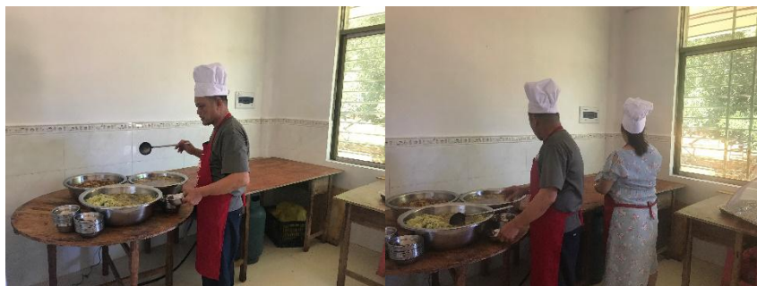
图 I -3 厨师卫生情况图