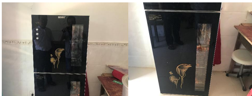
图III-3 餐具消毒情况组图