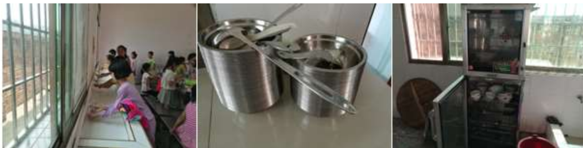
图III-3 就餐卫生情况组图（从左到右依次为餐前洗手、餐具消毒）