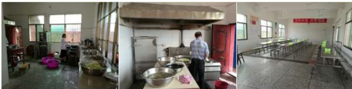
图I-2 厨师、厨房、餐厅卫生情况组图