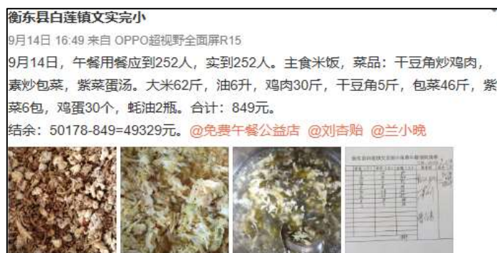
图IV-1 稽核当日微博截图