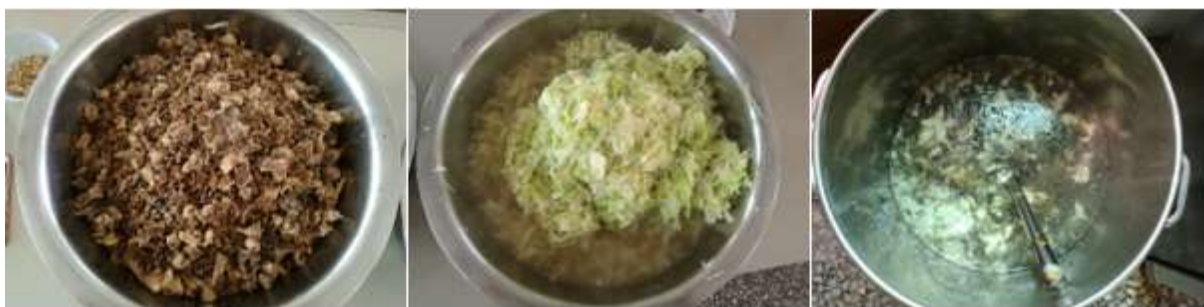
图III-1 稽核当天菜品情况组图