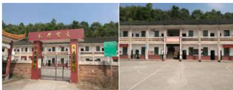
图 1 学校外观情况组图