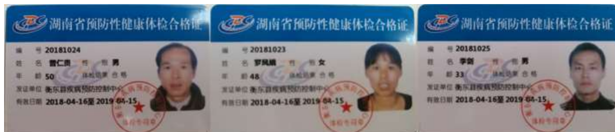
图I-1 厨房工作人员健康证组图