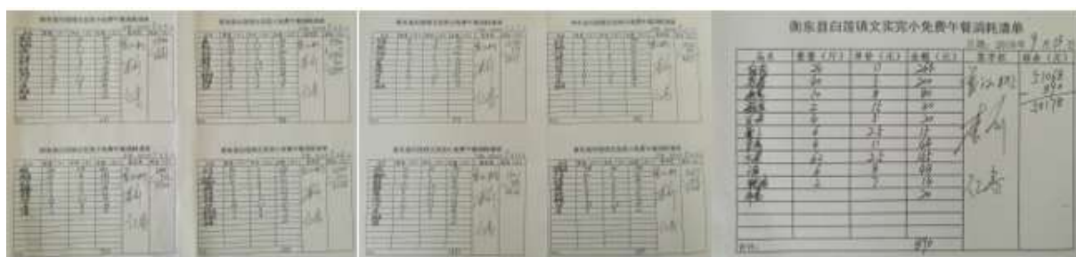
图II-2 出库登记单、现金流水账组图