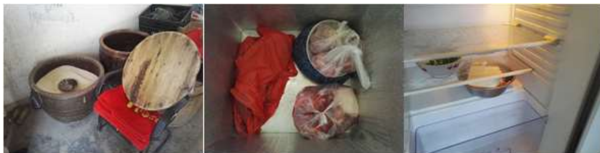
图I-3 食材储存情况组图（第三张为未隔离食物的图）