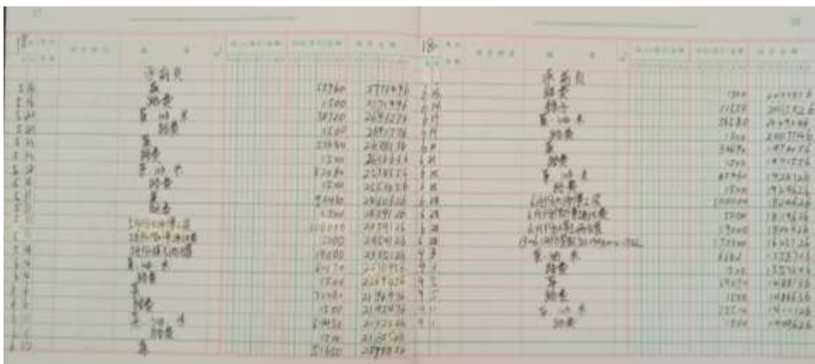
图II-4 现金流水账组图