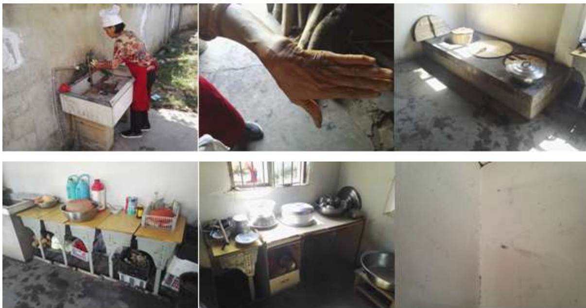
图I-2 厨师、厨房卫生情况组图（第二张为手部卫生图，第六张为墙上的蜘蛛网图）