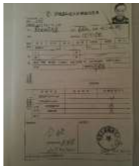
图 I -1 厨师健康证明图