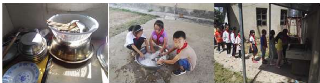
图III-3 就餐卫生情况组图（从左到右依次为餐具卫生情况、餐具清洗、餐前洗手）