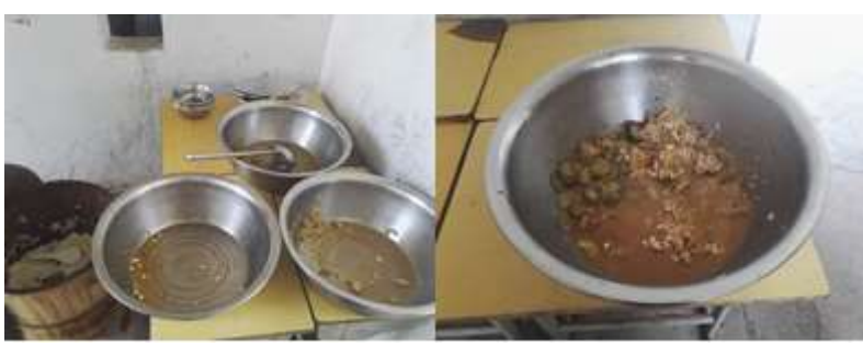
图III-4 餐后剩菜剩饭情况组图