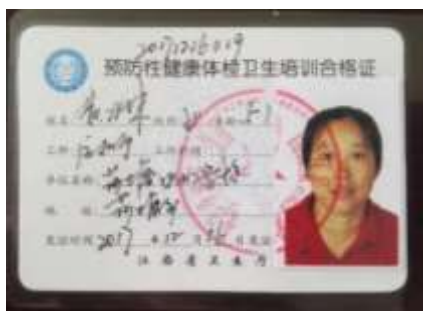
图 I -1 厨师健康证图