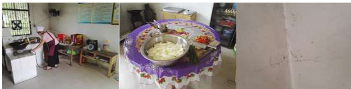
图I-2 厨师、厨房卫生情况组图（第三张为墙上的蜘蛛网图）