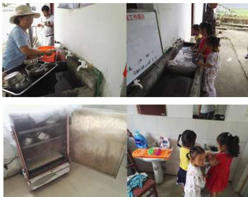
图III-3 就餐卫生情况组图（从左到右，从上到下依次为餐具清洗、餐具卫生情况、餐前洗手）