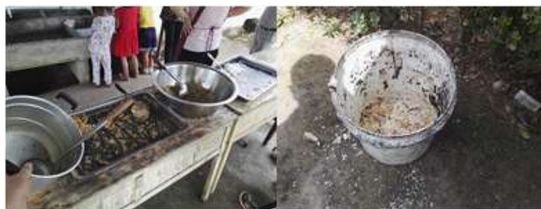
图III-4 餐后剩菜剩饭情况组图