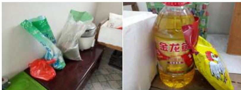
图I-3 储藏间情况组图