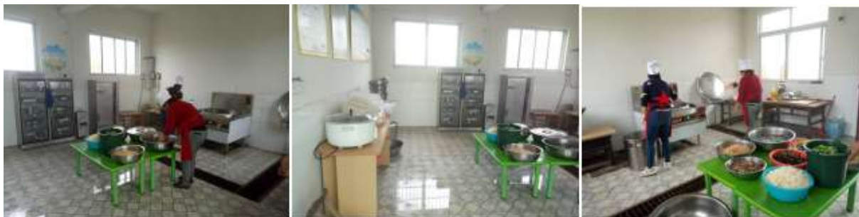
图I-2 厨师、厨房情况组图