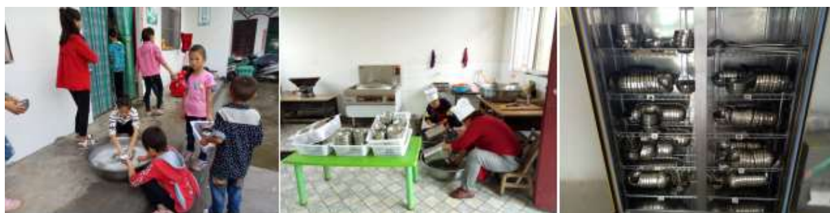
图III-3 餐后卫生情况组图