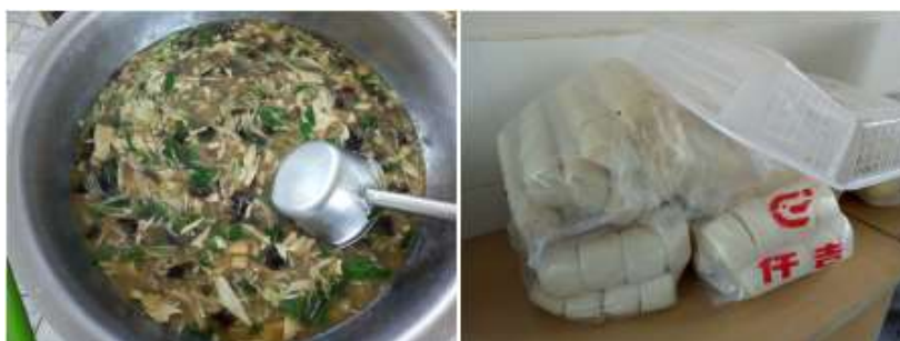
图III-1 开餐当天午餐情况组图