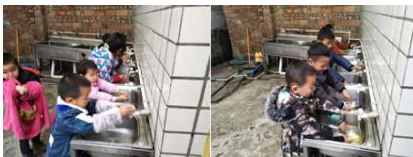
图III-3 就餐卫生情况组图（从左到右分别为餐前洗手、餐具清洗）