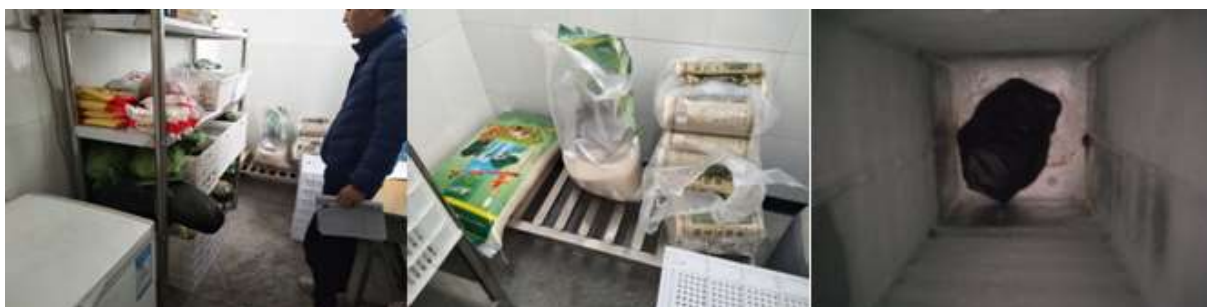
图I-3 食材储存情况组图