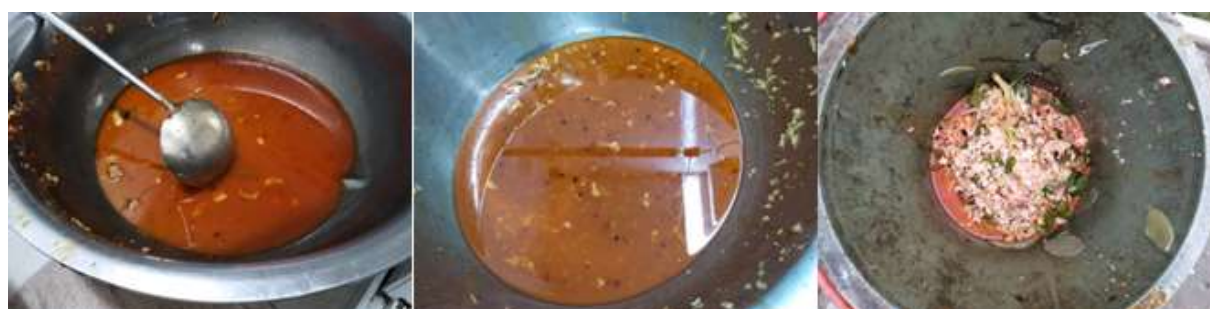
图III-4 餐后剩余情况组图