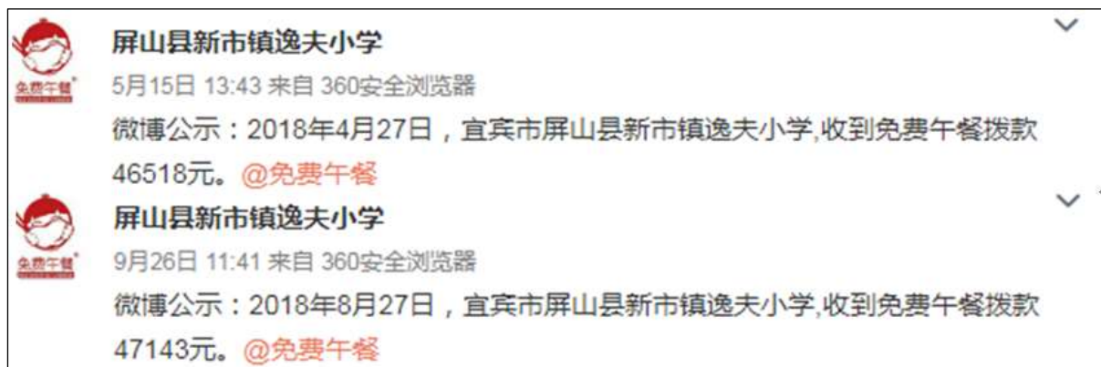
图 2 学校微博公示拨款截图

额分别为 46518 元和 47143 元，2018 年 5 月 15 日和 2018 年 9 月 26 日学校微博公示拨款分别为 46518 元和 47143 元，与实际相符。学校微博公示与官网公示拨款金额一致。