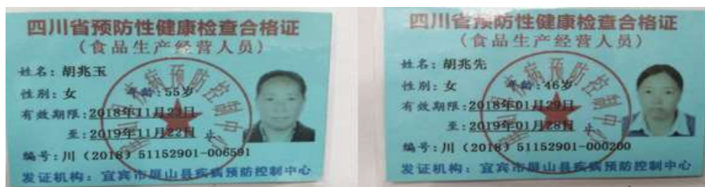
图I-1 厨师健康证组图