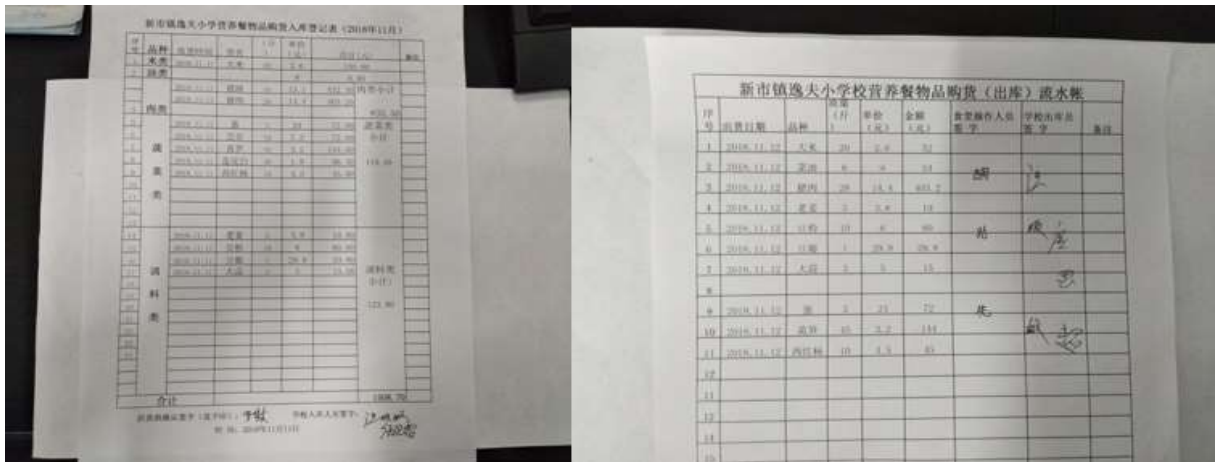
图II-2 出入库记录组图(从左到右一次为入库记录、出库记录)