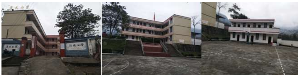
图 3 学校情况组图