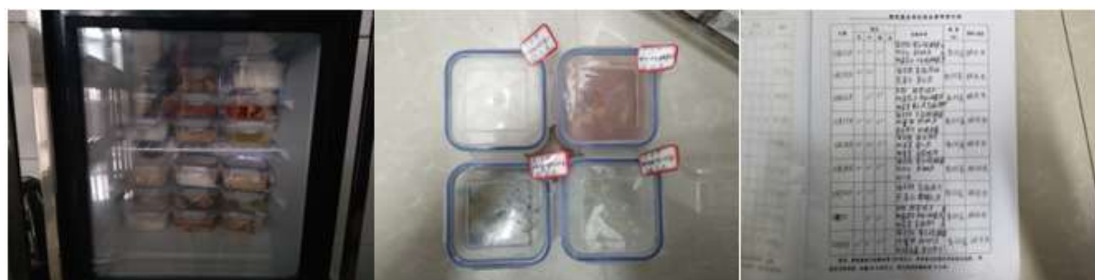
图I-4 食品留样情况组图