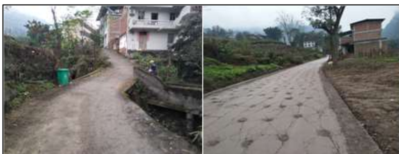
图 1 路况组图

交通说明：前往逸夫小学可在新市镇大桥桥头乘坐摩托车直达逸夫小学，全程由县道和村道组成，路况一般。