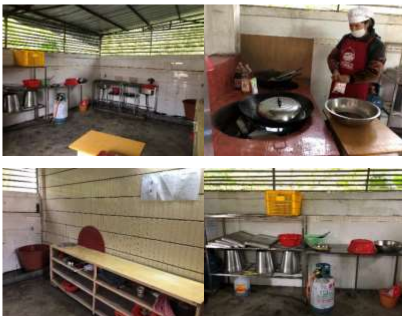
图I-2 厨师、厨房卫生情况组图