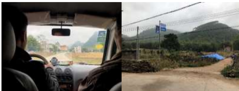
图 1 路况组图

交通说明：自封开县城前往莲都镇的客车始发于粤运封开客运站（江口镇），经停封川客运站，约30分钟一班，交通方便。乘车抵达莲都镇后可换乘面包车或摩托车前往深底小学，路况良好。