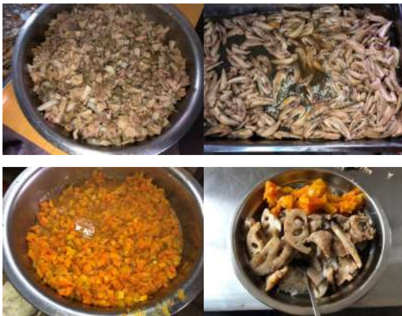
图III-1 稽核当日午餐菜品组图