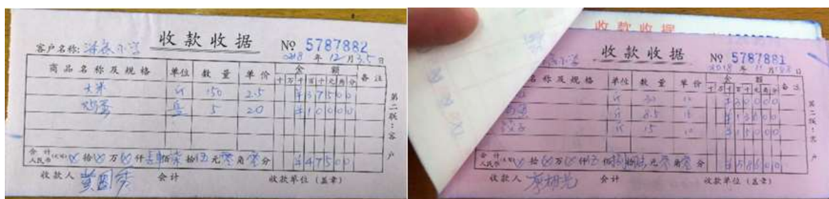
图II-1 采购原始凭证组图