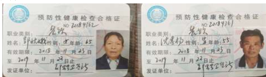
图I-1 厨师健康证组图