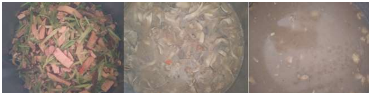
图III-1 开餐当天菜品情况组图