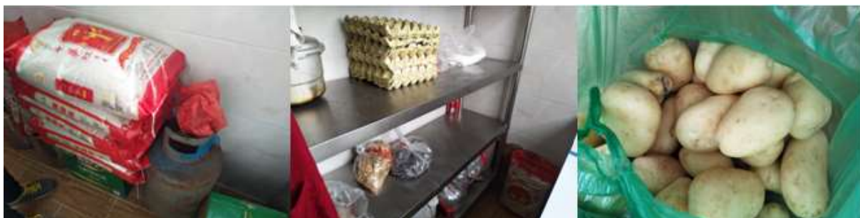
图I-3 食材储存情况组图