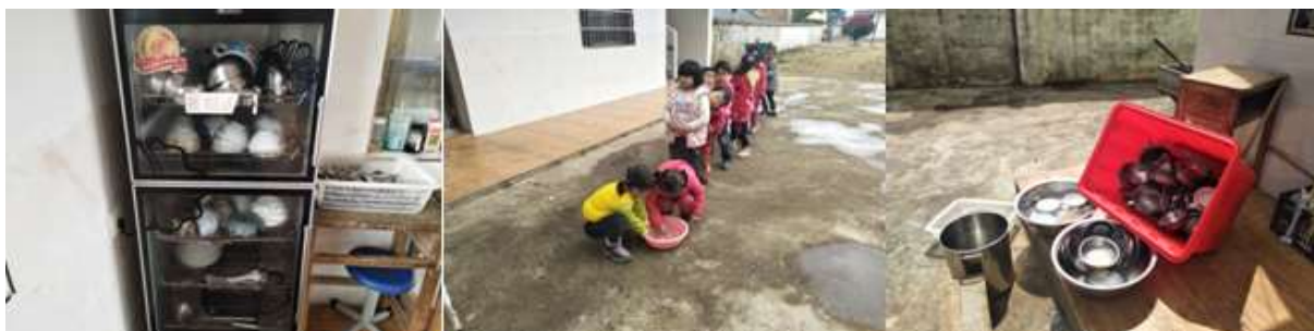
图III-3 就餐卫生情况组图（从左到右分别为餐具消毒、餐前洗手、餐具清洗）