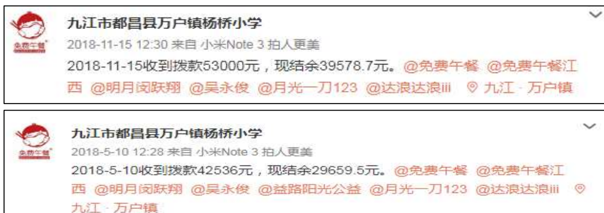
图 2 学校微博公示拨款截图

拨款分别为 42536 元和 53000 元,与实际相符。学校微博公示与官网公示拨款金额一致。