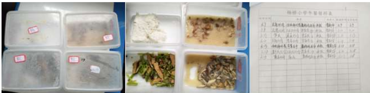
图I-4 食品留样情况组图