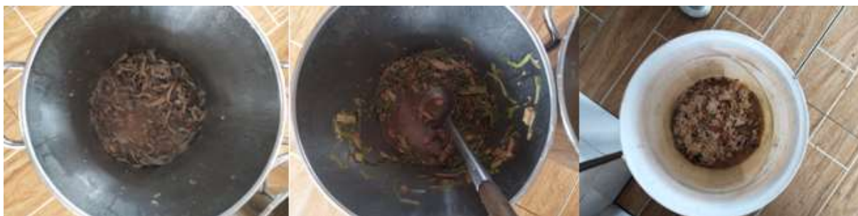
图III-4 餐后剩余情况组图