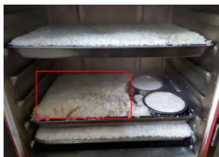
图 4 重大问题扣分情况说明图

稽核当天，发现学校午餐有提供隔夜饭的情况，根据稽核报告评分细则，综合当天稽核情况，决定对学校食用隔夜饭情况追加扣分 10 分。望学校就此整改，同时合理备餐，减少剩余浪费。