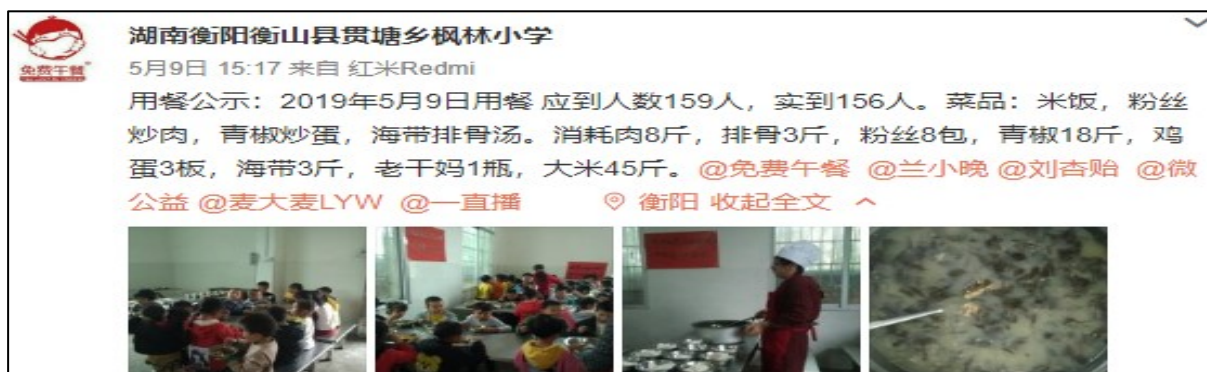
图IV-1 开餐当日微博截图