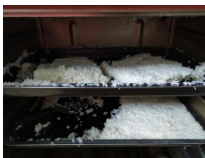
图III-4 餐后厨余情况组图