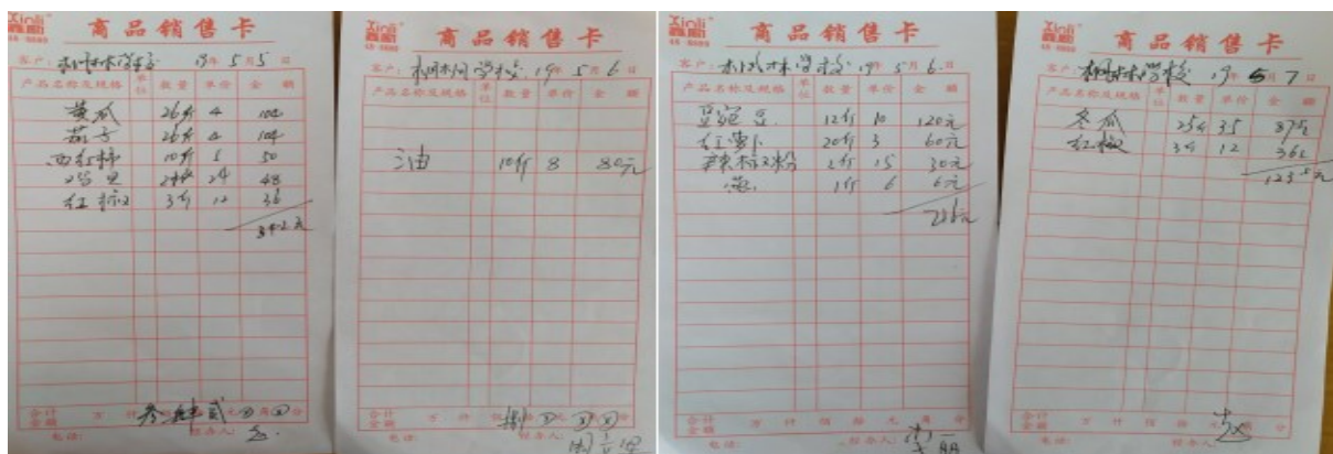
图II-1 原始采购单组图（缺少供应商电话信息及学校相关人员签字）