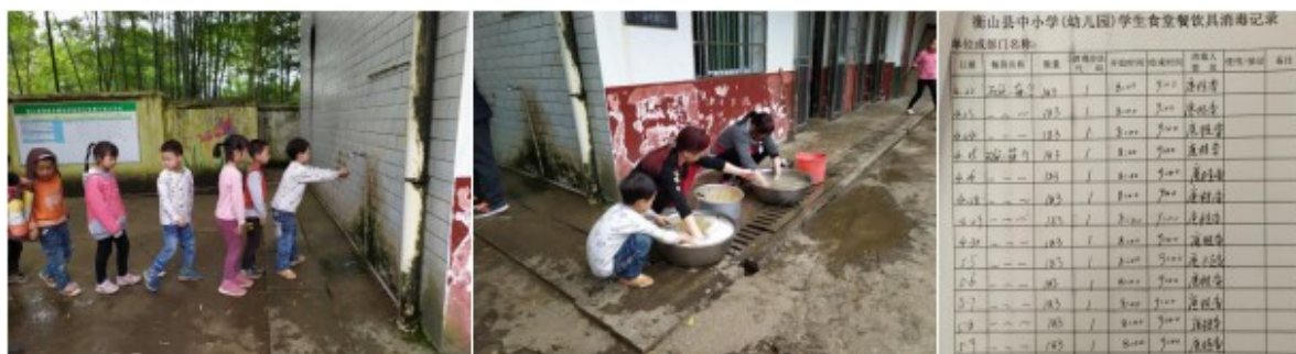
图III-3 就餐卫生情况组图（从左到右依次为餐前洗手、餐后清洗和餐具消毒记录）