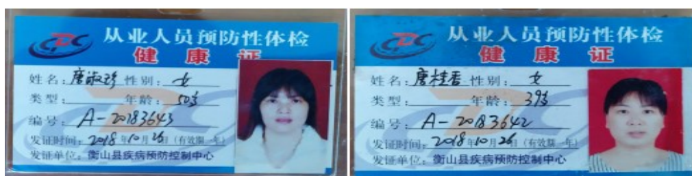
图I-1 厨师健康证情况组图