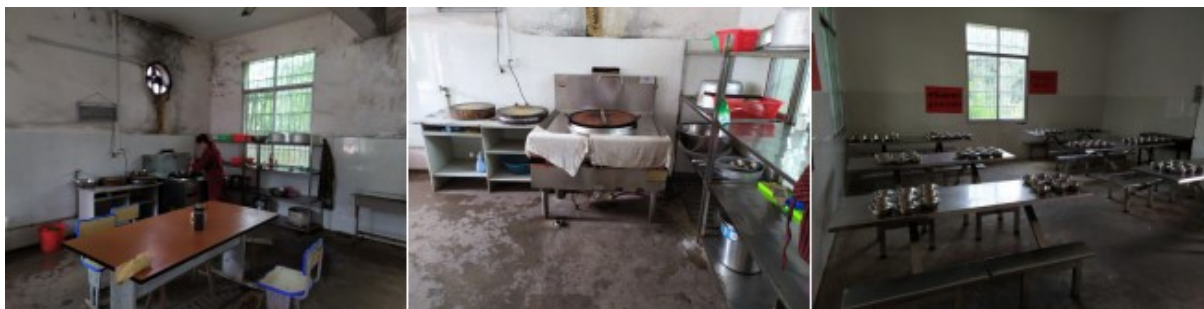
图I-2 厨师、厨房卫生情况组图