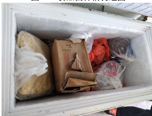
图I-5 内部结霜的冰箱情况图