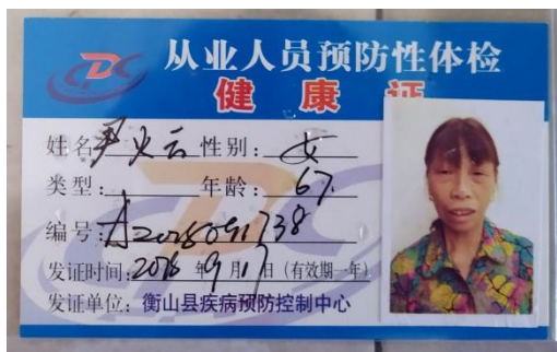
图I-1 厨师健康证情况图