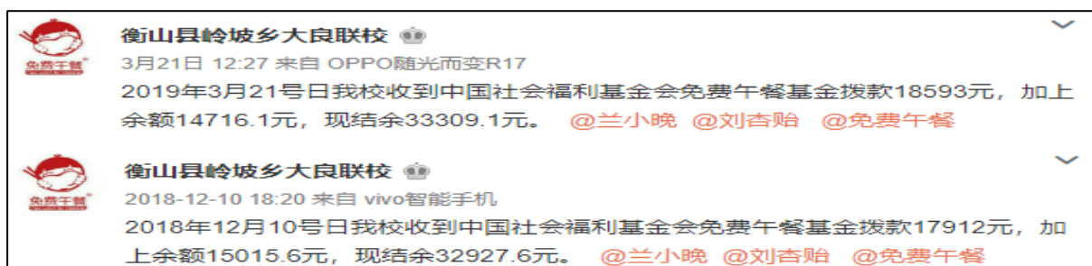
图 2 拨款公示微博截图

说明: 学校最近两次拨款均有微博公示和资金结余说明, 公示相对及时, 且学校微博公示与官网公示拨款金额一致。