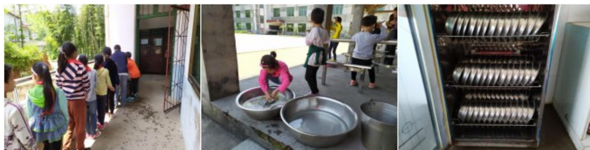
图III-3 就餐卫生情况组图（从左到右依次为餐前洗手、餐后清洗和餐具消毒）