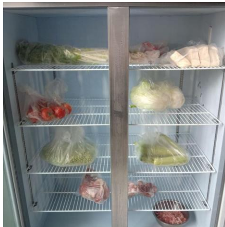
冷藏柜内的食材已用保鲜膜隔离包装