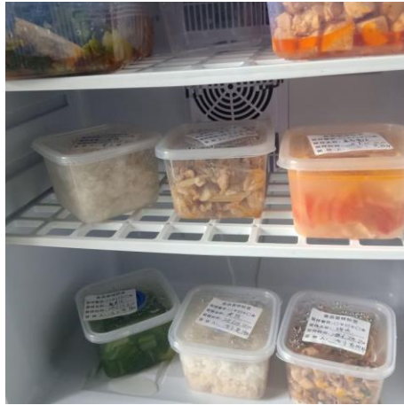
食品留样已足 150 克 相关责任人已签字