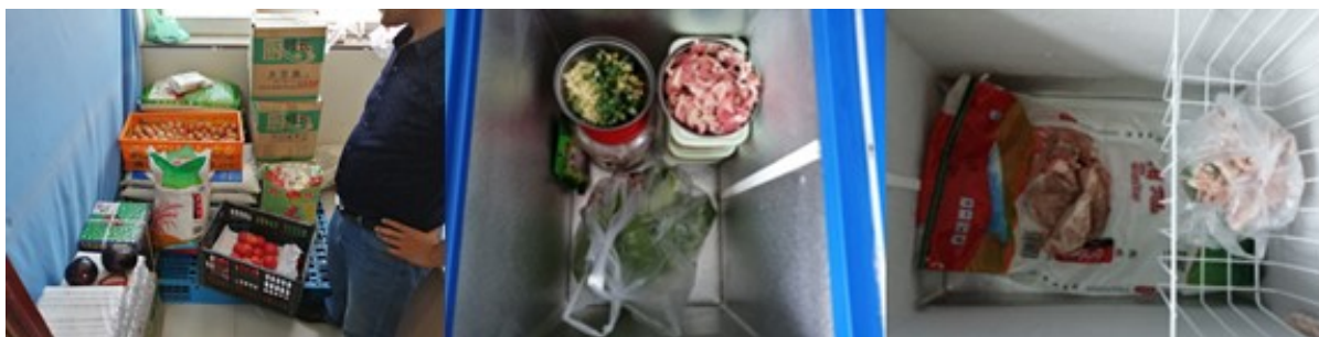
图I-3 食材储存情况组图（第二、三图为冰柜内部分食物储藏不合格）