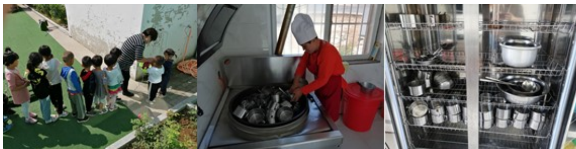
图III-3 就餐卫生情况组图（从左到右依次为餐前洗手、餐具消毒）