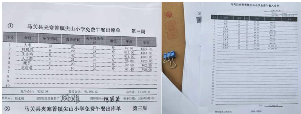
图 II-2 出入库登记组图