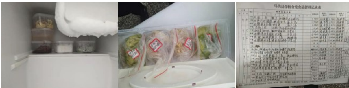
图I-4 食品留样情况组图