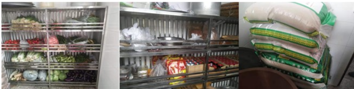
图I-3 食材储藏情况组图