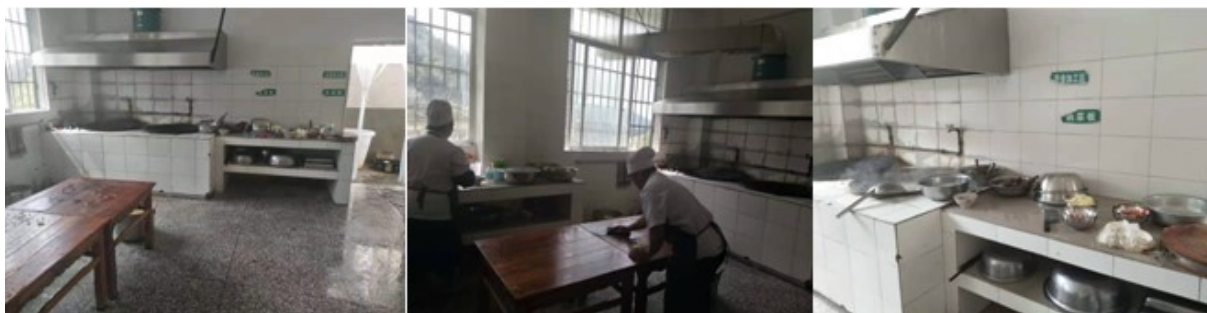
图I-2 厨师、厨房卫生情况组图