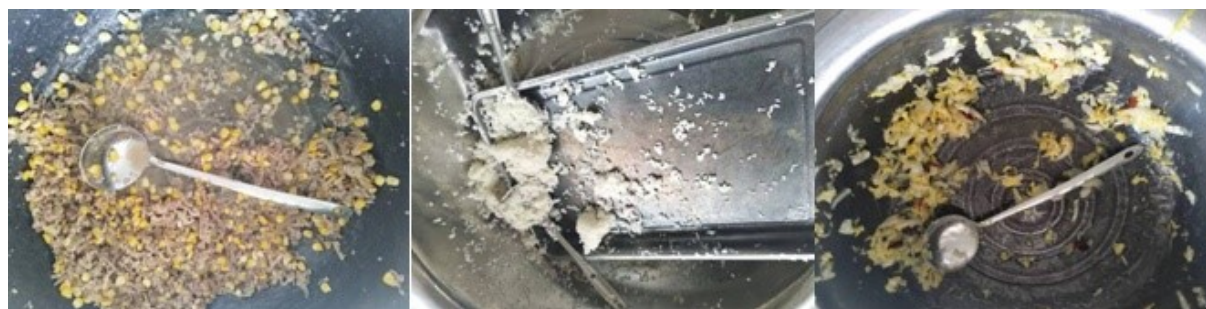
图III-4 餐后剩余情况组图