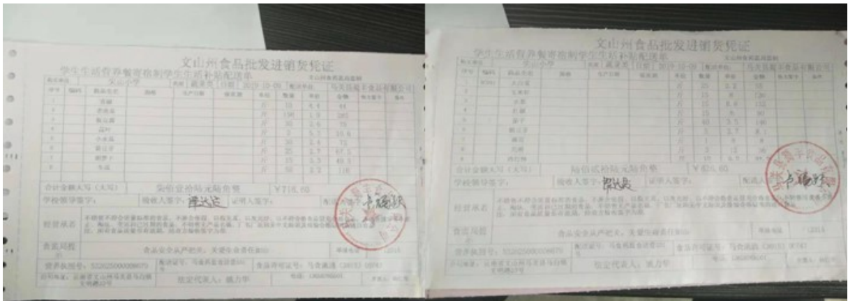
图 II-1 原始凭证组图