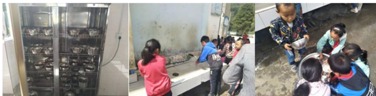
图III-3 就餐卫生情况组图