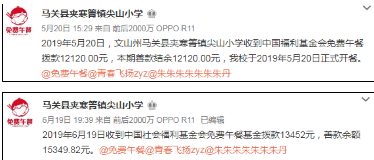
图 2 微博公示拨款截图

说明：2019年5月14日和2019年6月13日官网公示已经拨款，官网公示拨款金额分别为12120元和13452元，微博公示拨款分别为12120元和13452元，与实际相符。学校微博公示与官网公示拨款金额一致。