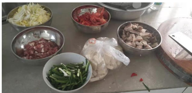
图III-5 实际开餐备餐不同食材组图