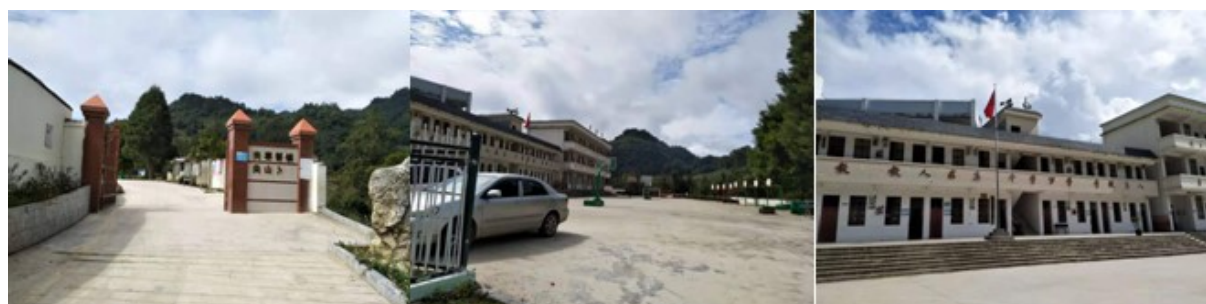
图 3 学校情况组图