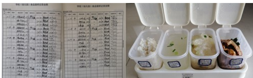
图I-4 食品留样情况组图