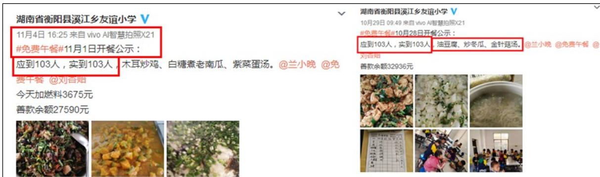
图IV-2 近期开餐微博截图