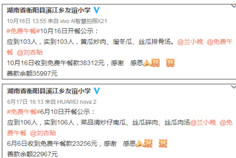
图 2 最近两次拨款情况的微博公示截图

说明：2019 年 9 月 4 日官网公示拨款金额为 38312 元，2019 年 10 月 16 日微博公示拨款为 38312 元，与实际相符；2019 年 5 月 30 日官网公示拨款金额为 23256 元，2019 年 6 月 17 日微博公示拨款为 23256 元，与实际相符。