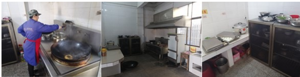
图I-2 厨师、厨房卫生情况组图