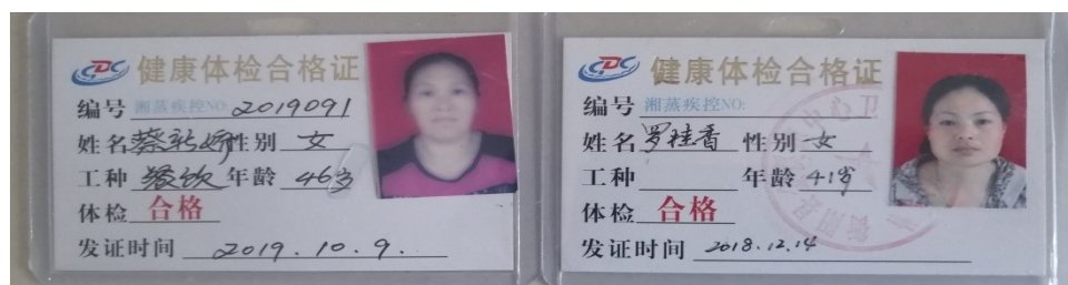
图I-1 厨师健康证组图