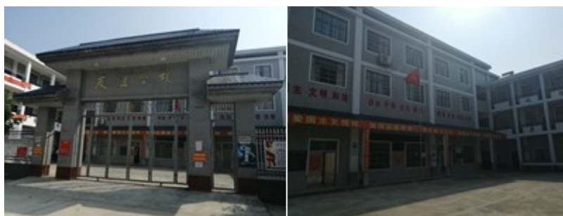
图 3 学校情况组图