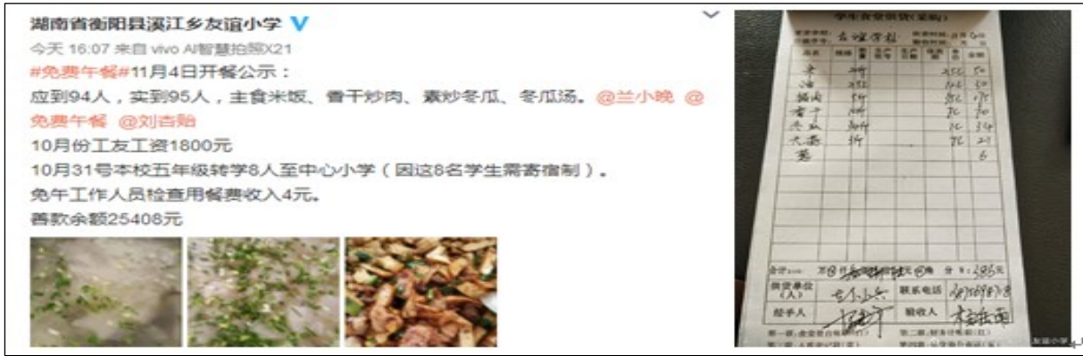
图IV-1 开餐当日微博截图