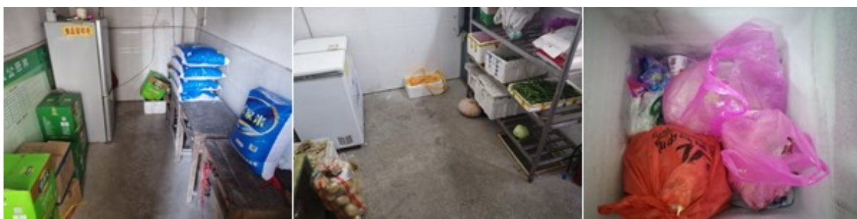
图I-3 食材储存情况组图