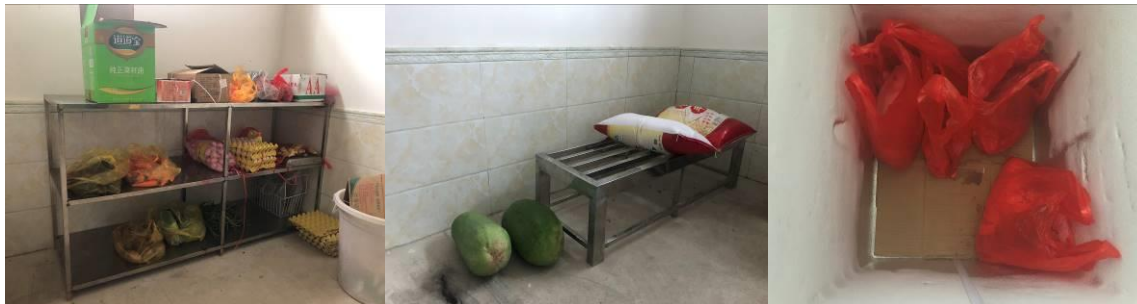
图 I -3 食材仓储情况组图