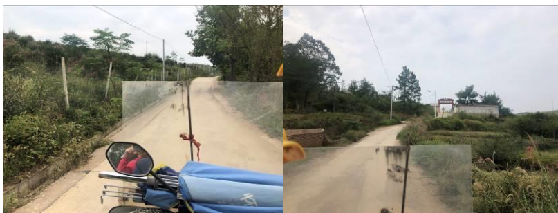
图 1 学校周边路况组图

交通说明：自邵东城区前往高桥小学可在邵东汽车站（禾尚桥）乘坐开往槎江的客车，约35分钟即可抵达槎江村，下车后可选择搭乘摩托车或徒步前往高桥小学，全程路况良好，交通方便。