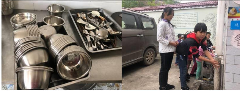
图III-3 餐具卫生及洗手情况组图