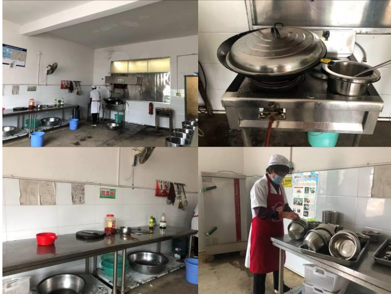
图 I -2 厨房及厨师卫生情况组图