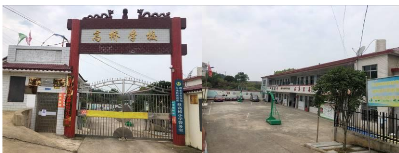
图 3 学校大门及校园环境