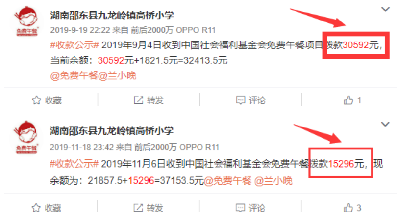
图 2 拨款公示截图

说明: 查阅官网近期拨款信息, 发现免费午餐基金分别于 2019 年 9 月 4 日拨款 30592 元和 2019 年 11 月 6 日拨款 15296 元。查阅学校微博, 校方分别于 2019 年 9 月 19 日及 2019 年 11 月 18 日对上述两笔拨款进行公示, 公示金额均与官网一致。