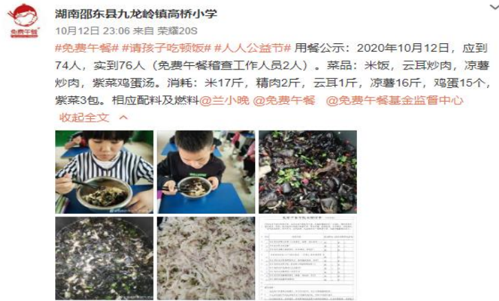
图IV-1 稽核当日用餐公示微博截图