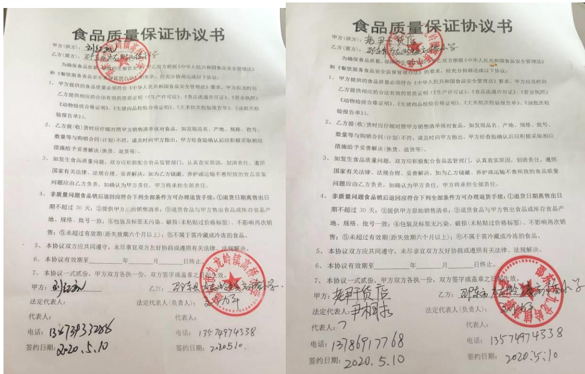
图 II-5 相关供应商采购协议