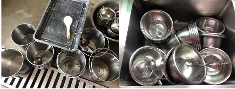
图III-4 餐后浪费情况组图