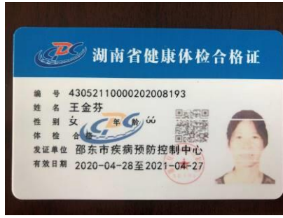
图 I -1 厨师健康证