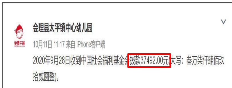
图 2 拨款公示截图

说明: 查阅官网近期拨款信息, 免费午餐基金于 2020 年 09 月 28 日拨款 37492 元。查阅学校微博, 上述拨款校方于 2020 年 10 月 11 日公示, 公示拨款金额均与官网一致。