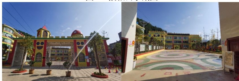
图 3 学校大门及校园环境