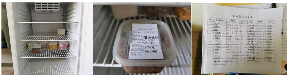
图 I -4 食品留样情况组图