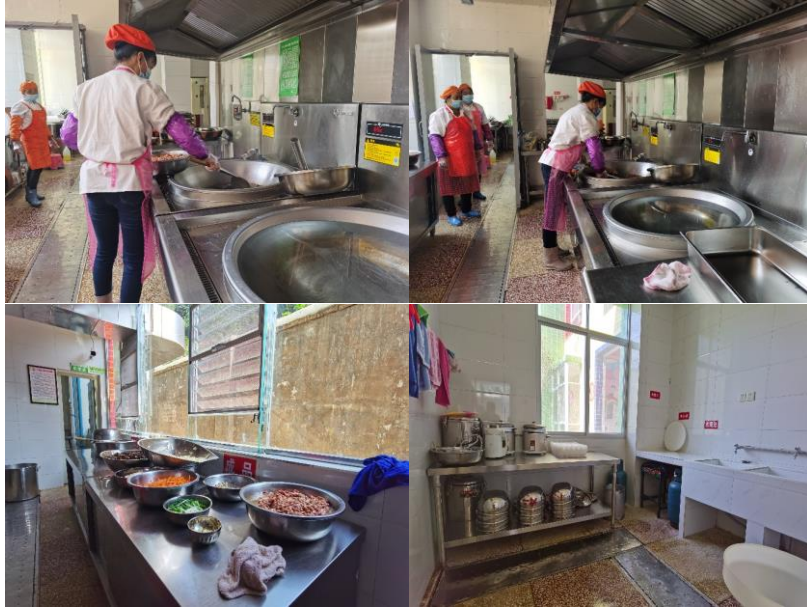
图 I -2 厨房及厨师卫生情况组图