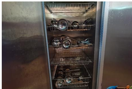
图III-4 餐具卫生情况组图