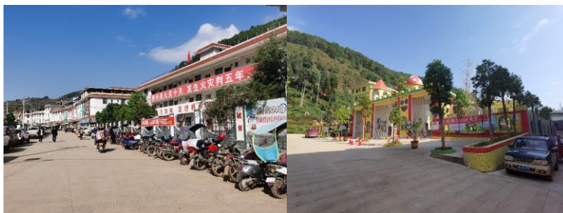
图 1 学校周边街景组图

交通说明：会理县太平镇中心幼儿园位于会理县太平镇新街，从县城出发需前往位于顺城东路、会太路路口的农村客运停靠站乘坐前往太平的面包车。该线路面包车无固定发车时间，人满即走（等车时间不可预估），车费单程12元一人，车程约60分钟。