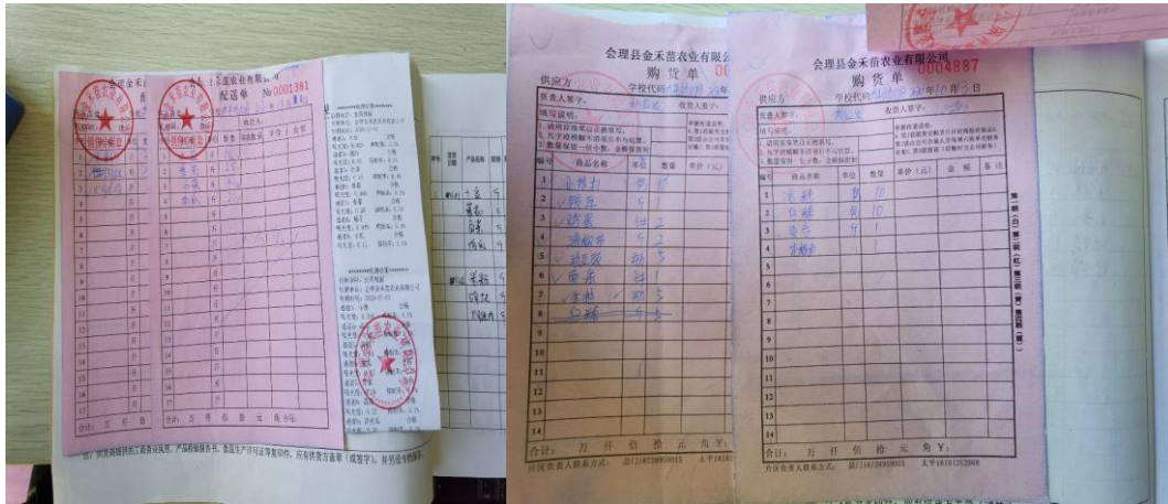
图 II-1 采购原始凭证组图