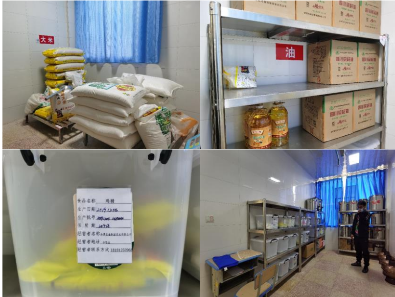
图 I -3 食材仓储情况组图