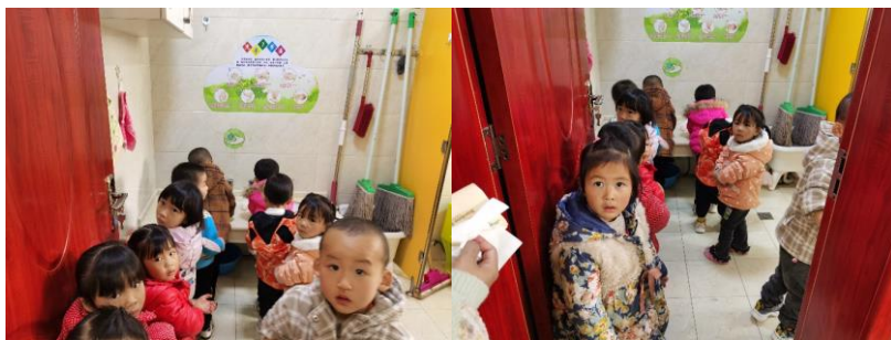
图III-2 学生餐前洗手情况组图