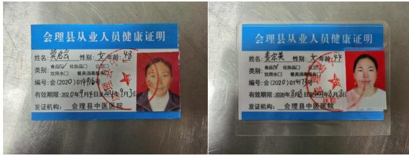
图 I -1 厨师健康证组图