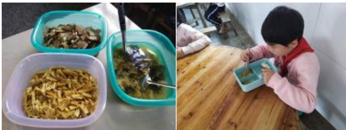
图 I -3 塑料制品盛装热食情况组图