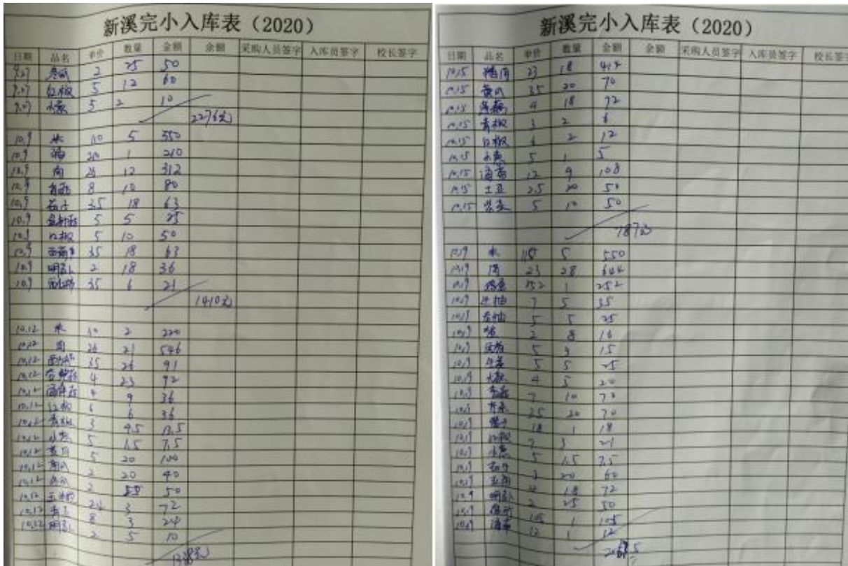
图 II-2 入库登记情况组图 (缺少签字)