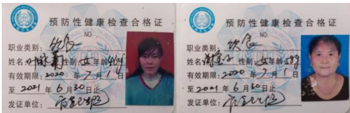
图 I -1 厨师健康证情况图