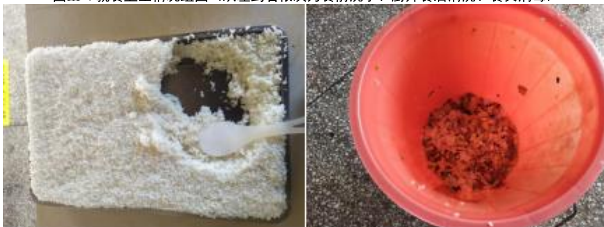
图III-4 餐后厨余情况组图