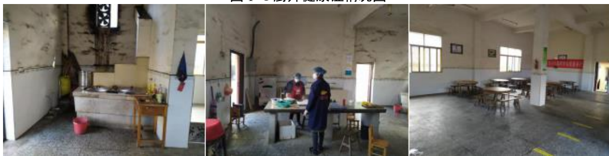
图 I -2 厨师、厨房卫生情况组图