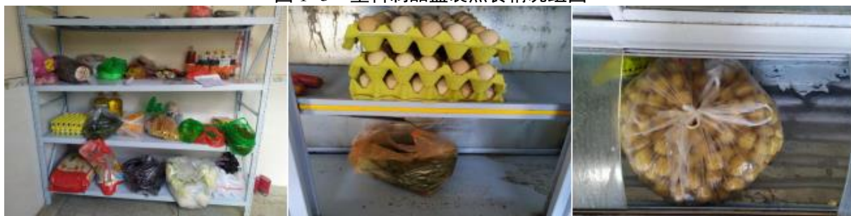
图 I -4 食材储存情况组图