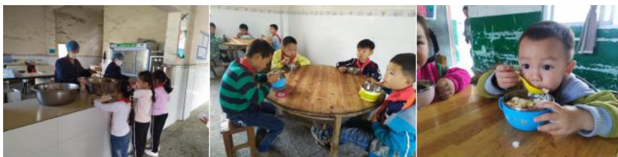
图III-3 就餐情况组图（塑料餐具与塑料制品盛装热食）