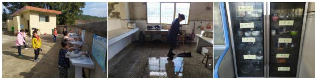
图III-4 就餐卫生情况组图（从左到右依次为餐前洗手、厨师餐后清洗、餐具消毒）