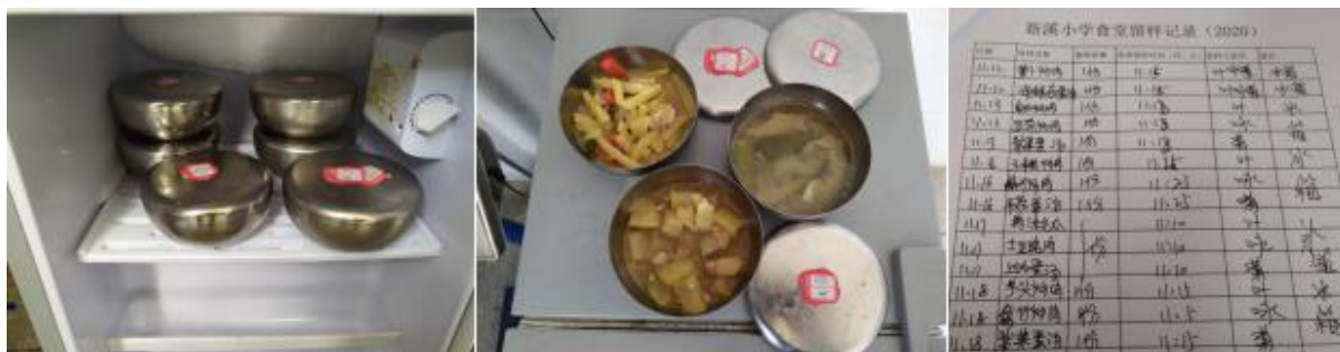
图 I -5 食品留样情况组图