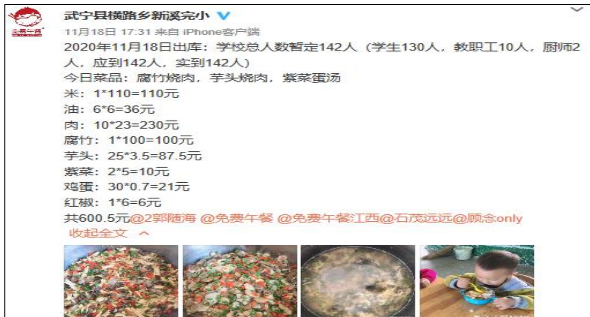
图IV-1 开餐当日微博截图