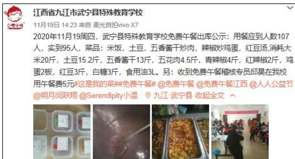
图IV-1 开餐当日微博截图