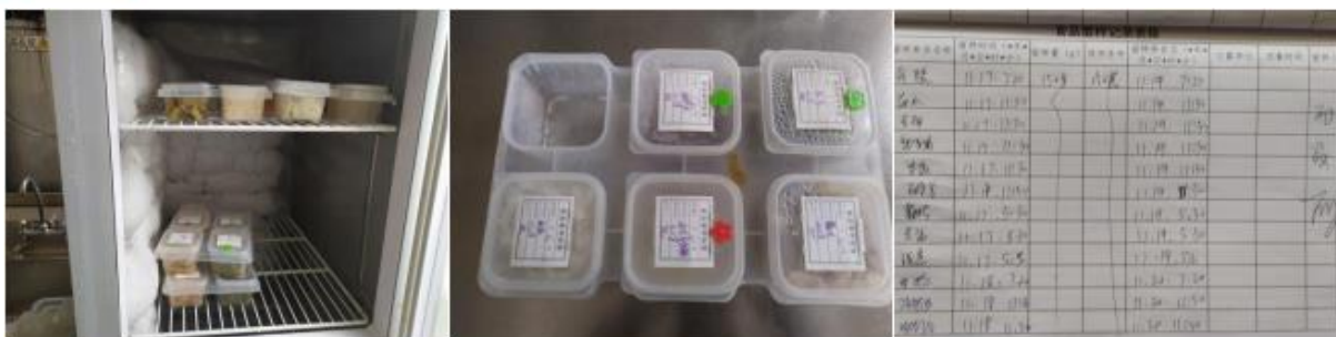
图 I -5 食品留样情况组图（签名信息不全）