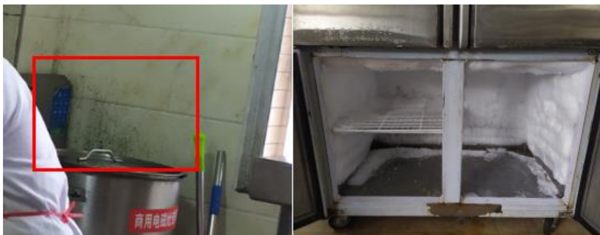
图 I -3 油污死角及冰箱内部冰霜情况组图