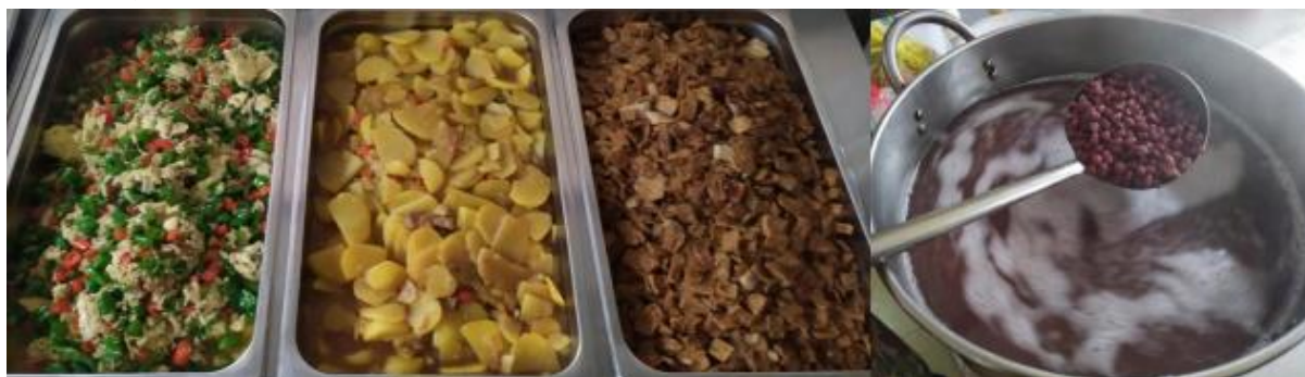
图III-1 开餐当天菜品情况组图