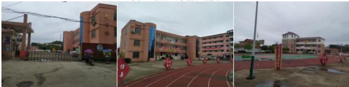
图 3 学校情况组图