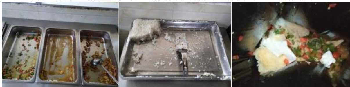
图III-4 餐后厨余情况组图