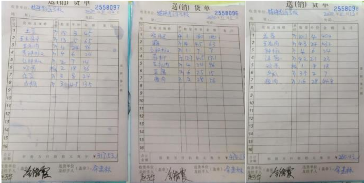
图 II-1 原始凭证组图