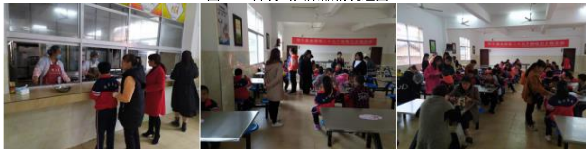
图III-3 就餐情况组图（特殊儿童，未近距离拍摄照片）