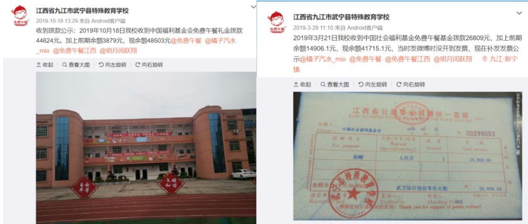
图 2 拨款公示情况截图

说明：查阅官网拨款信息，学校于2019年10月15日拨款44624元和2019年3月23日拨款26809元，学校分别于2019年10月18日、3月29日对前述两笔拨款进行公示，拨款金额一致。