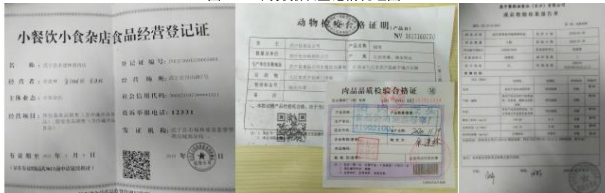
图 II-4 商家部分信息情况组图