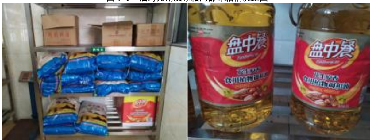
图 I -4 食材储存情况组图