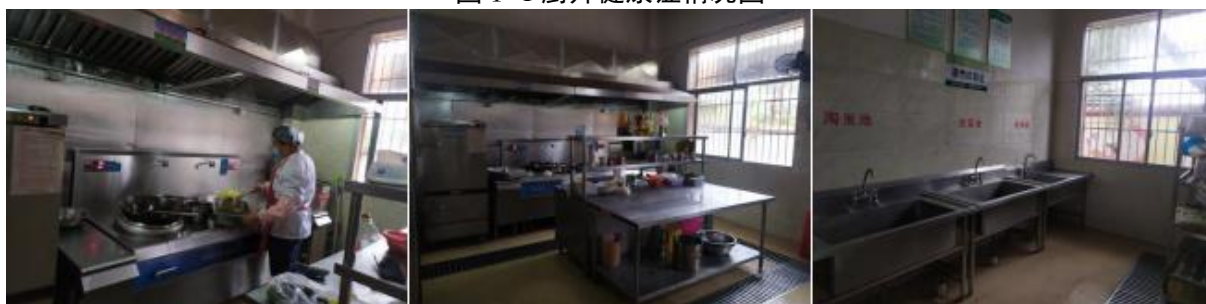
图 I -2 厨师、厨房卫生情况组图