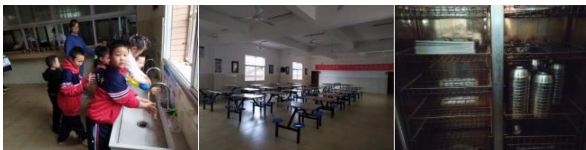
图III-4 就餐卫生情况组图（从左到右依次为餐前洗手、餐后餐厅卫生、餐具消毒）