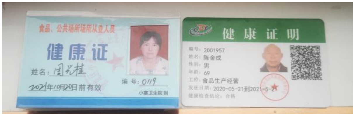
图 I -1 厨师健康证组图