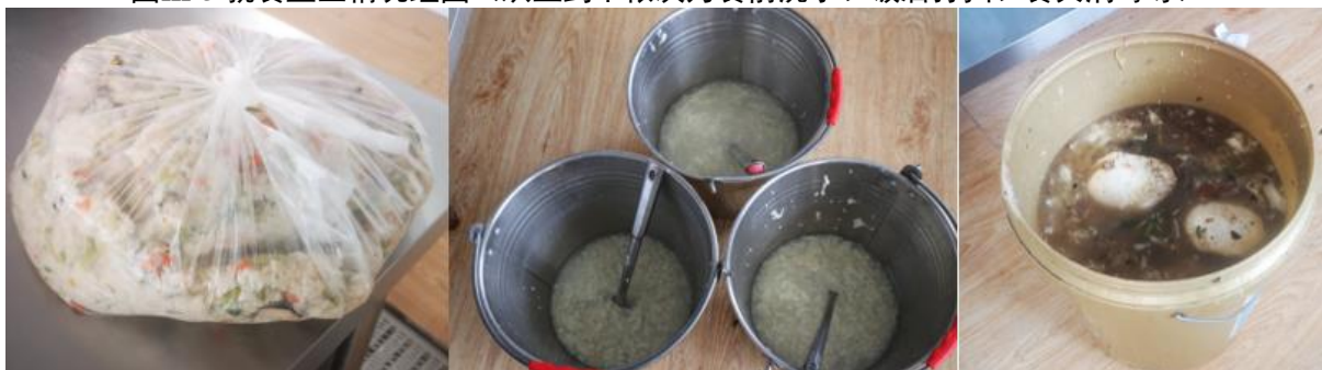
图III-4 午餐部分剩余组图（从左到右依次为餐后剩余米饭、米酒鸡蛋汤剩余，泔水桶倾倒）