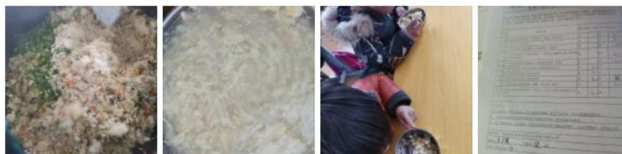
图IV-1 开餐当日微博截图

2020年12月4日（周五）用餐公示：应到113人，实到111人（学生100人，教职工11人，学生请假2人），菜品：咸米饭，米酒鸡蛋汤。消耗：猪肉3.15千克，白萝卜28.19千克，东北米14.03千克，白糖1.62千克，香菜0.74千克，红萝卜4.19千克，900克米酒3瓶，鸡蛋3.60千克，香菇2.91千克，蒜苗0.82千克，淀粉1.02千克，大葱0.97千克，油盐调料等@免费午餐 @艾慕扫瑞 收起全文 ^