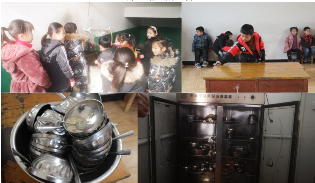
图III-3 就餐卫生情况组图（从上到下依次为餐前洗手、饭后打扫、餐具消毒等）