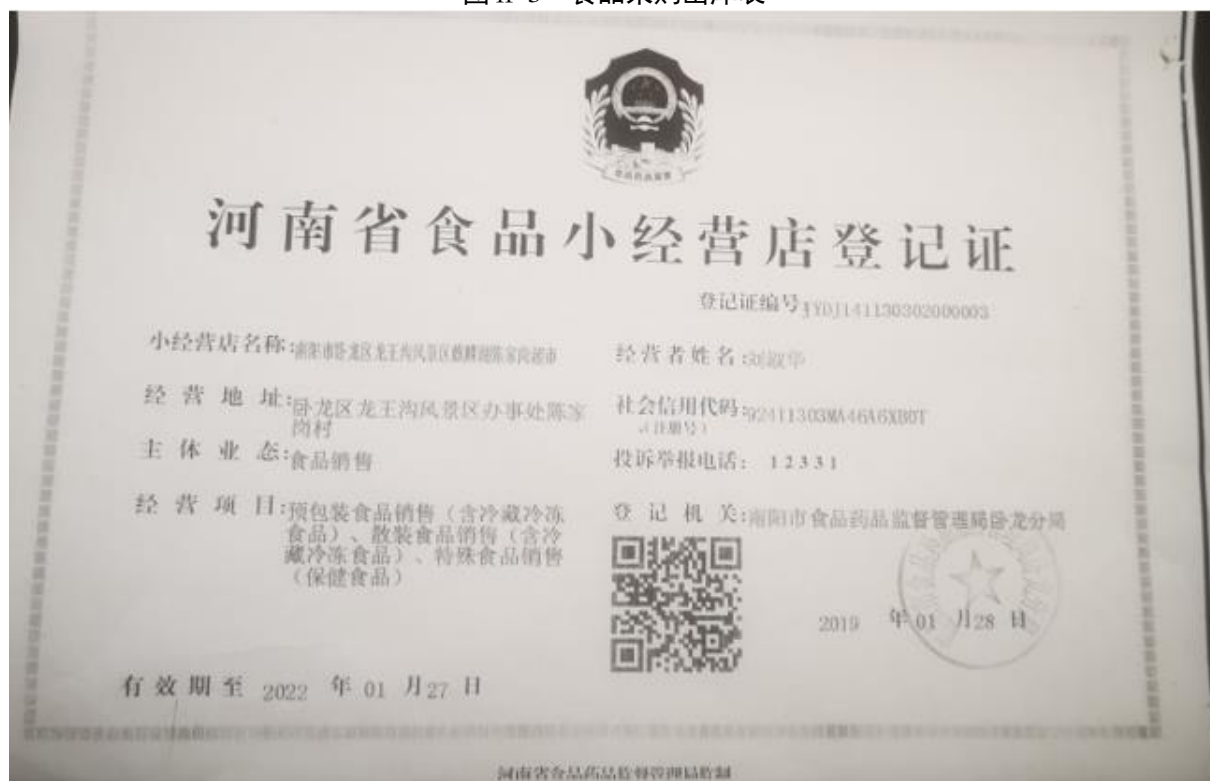
图 II-4 供应商相关资质