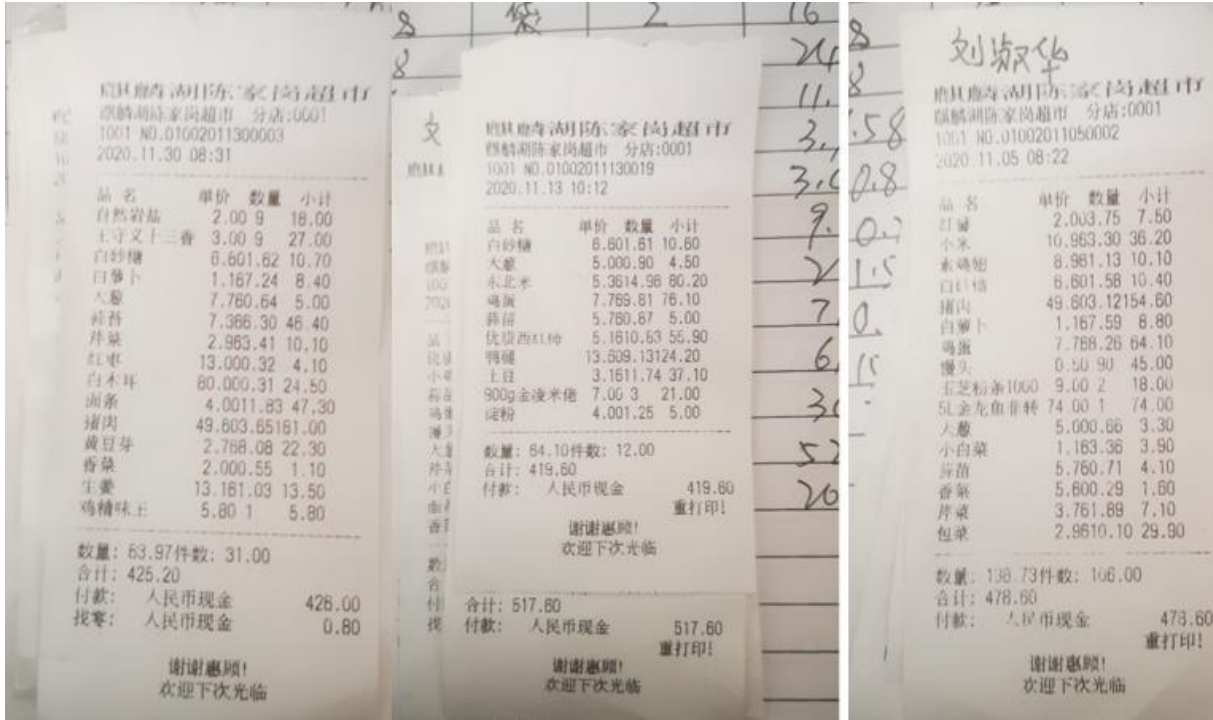
图 II-1 原始凭证组图