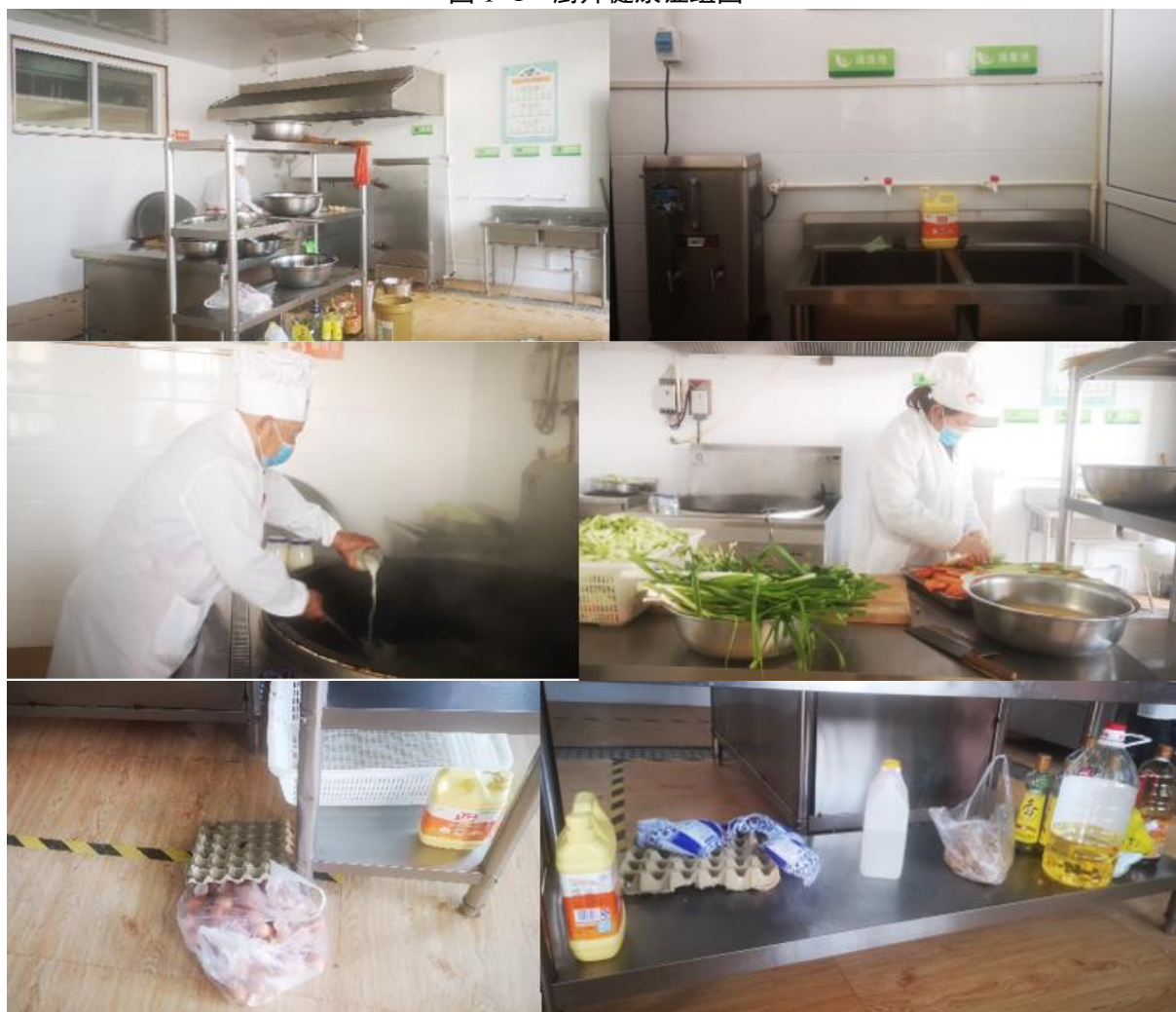
图 I -2 餐厅、厨师、厨房卫生情况组图 (厨师阿姨长发未盘起, 备餐过程地面垃圾未及时清理)