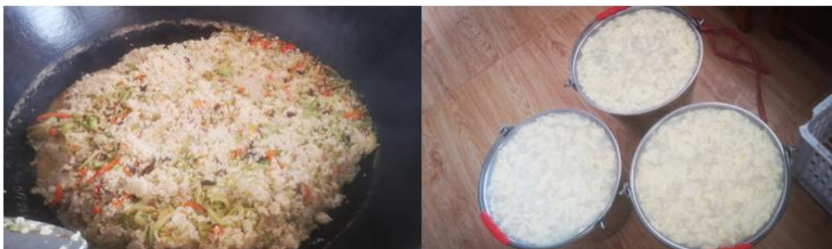
图III-1 开餐当天菜品情况组图