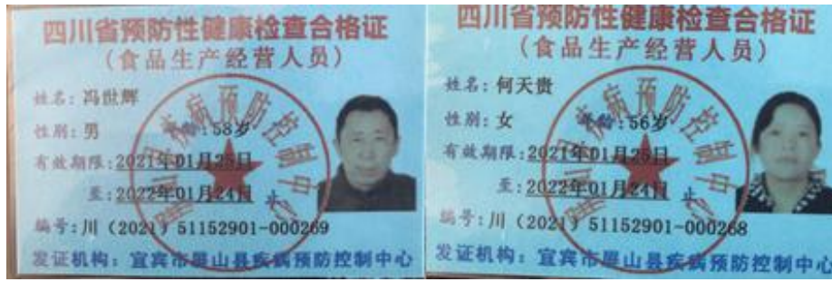
图 I -1 厨师健康证组图