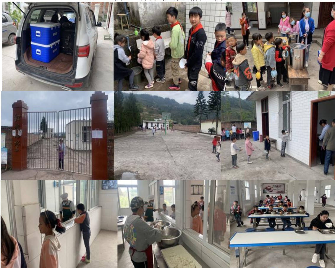
图III-2 就餐情况组图（依次为二坪教学点；红旗教学点；大桥基点学校）