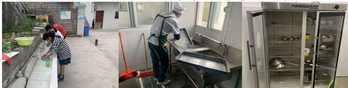
图III-3 就餐卫生情况组图（从左到右依次为餐后餐具清洗、统一消毒）