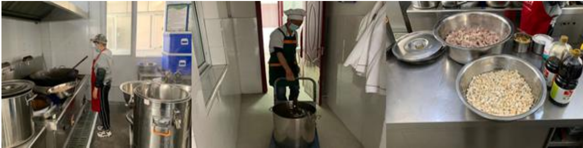
图 I -2 厨师、厨房卫生情况组图