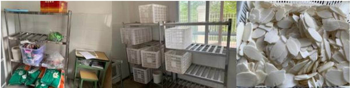
图 I -3 食材储存情况组图