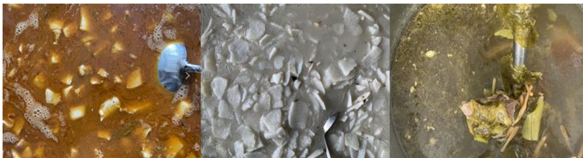
图III-1 开餐当天菜品情况组图