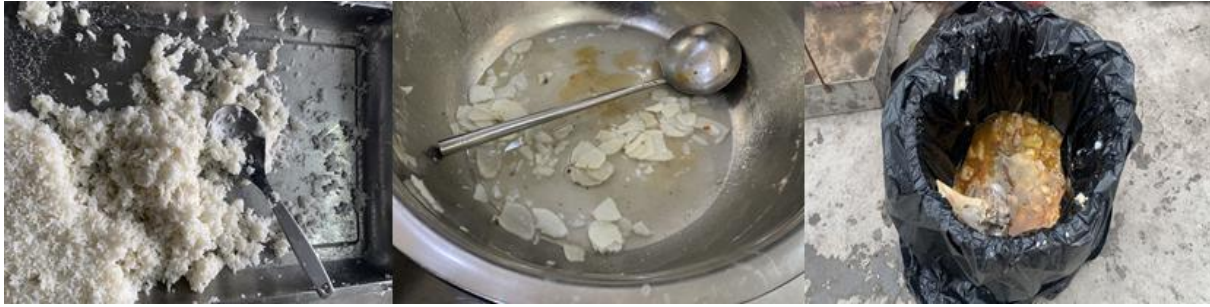
图III-4 从左到右分别为餐后剩余米饭、剩余菜品、泔水桶倾倒