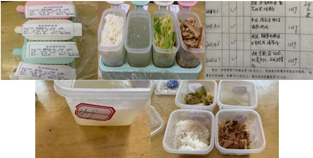
图 I -4 食品留样情况组图