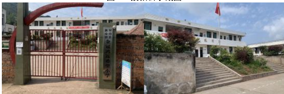
图 3 学校情况组图