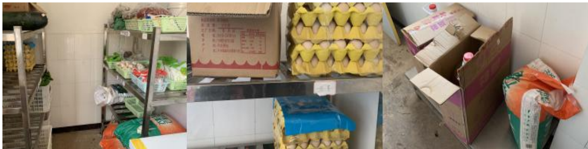
图 I -3 食材储存情况组图