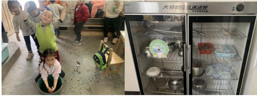
图III-3 就餐卫生情况组图（从左到右依次为餐前洗手、统一消毒）