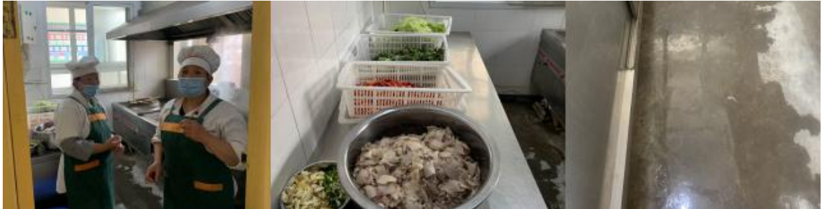
图 I -2 厨师、厨房卫生情况组图