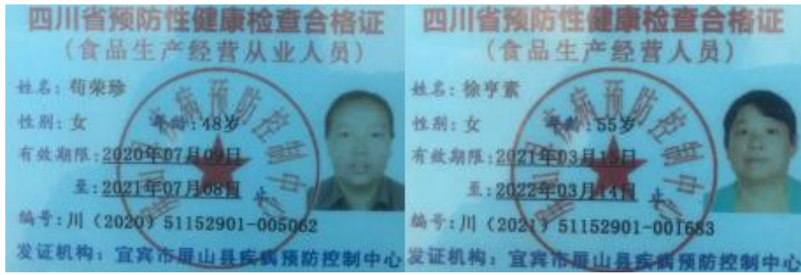
图 I -1 厨师健康证组图