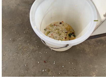
图III-4 餐后泔水桶倾倒图