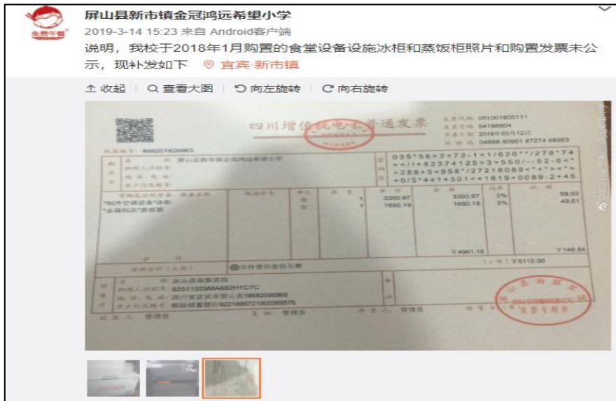
微博公示配套截图

说明：该校开餐至2018年1月发布的微博，因系统设置已无法查阅，翻阅学校微博开餐以来仅有2019年3月14日补发冰柜、蒸饭柜票据，合计支持5110元。