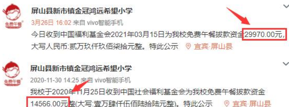
图 2 拨款公示截图

说明: 查阅官网拨款信息, 免费午餐基金分别于 2021 年 3 月 15 日拨款 29970 元和 2020 年 11 月 25 日拨款 14566 元, 学校分别于 2021 年 3 月 26 日和 2020 年 11 月 30 日对两笔拨款进行了公示, 金额一致。