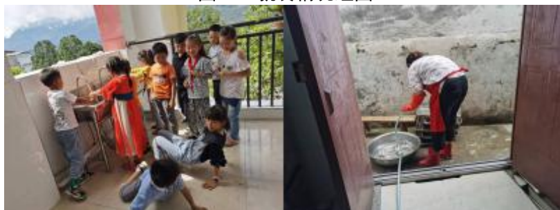
图III-3 就餐卫生情况组图