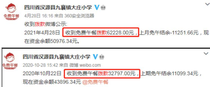
图 2 拨款公示截图

说明: 查阅官网及财务最新拨款信息, 免费午餐基金分别于 2021 年 3 月 29 日拨款 62228 元和 2020 年 10 月 22 日拨款 32797 元, 学校分别于 2021 年 4 月 28 日和 2020 年 10 月 28 日对两笔拨款进行了公示, 金额一致。