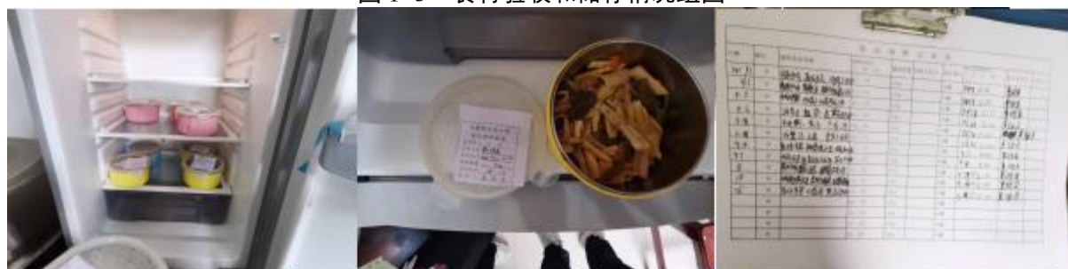
图 I -4 食品留样情况组图