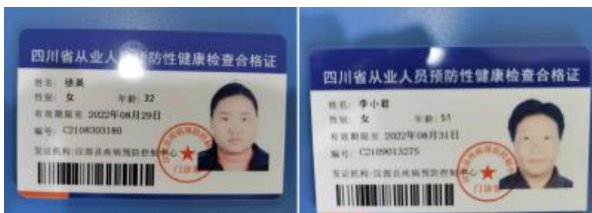
图 I -1 厨师健康证组图