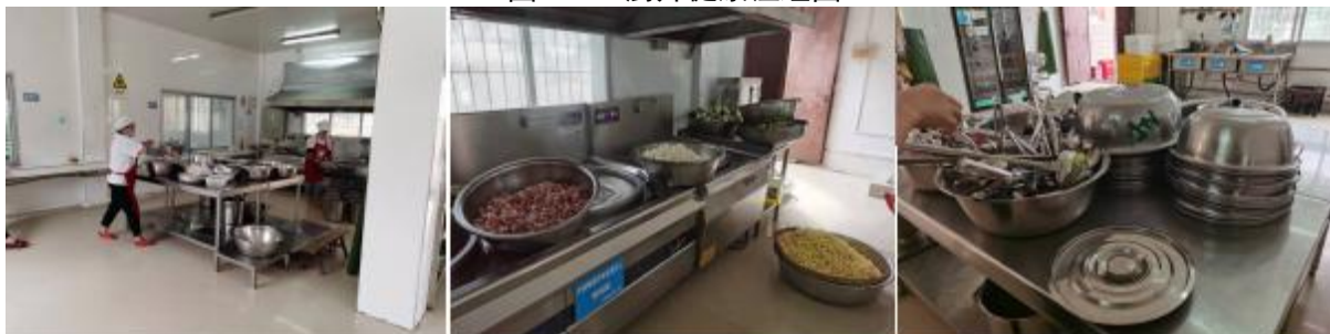
图 I -2 厨师、厨房卫生情况组图