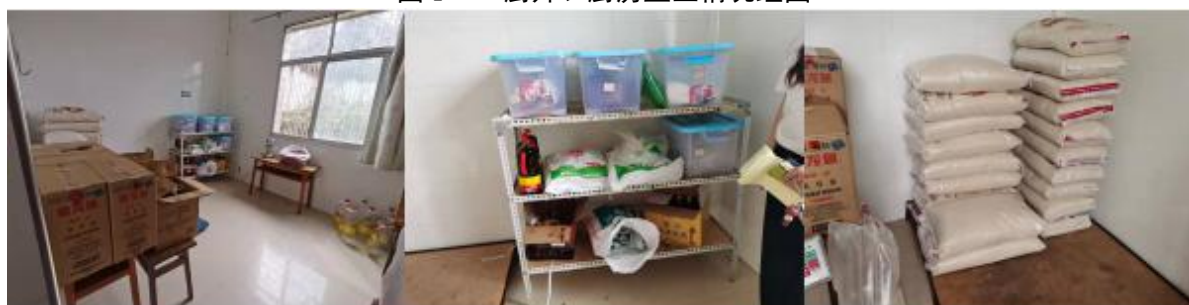
图 I -3 食材验收和储存情况组图