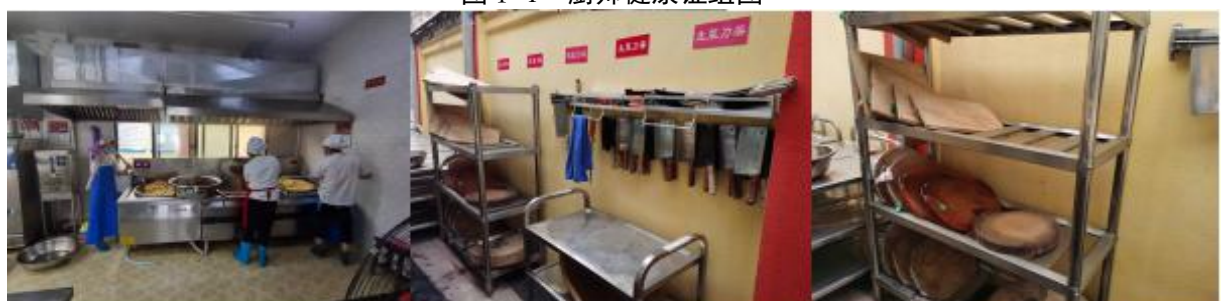
图 I-2 厨师、厨房卫生情况组图