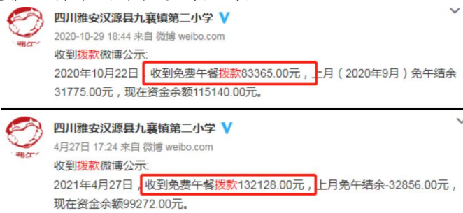
图 2 拨款公示截图

说明：查阅官网及财务最新拨款信息，免费午餐基金分别于 2020 年 10 月 22 日拨款 83365 元和 2021 年 4 月 7 日拨款 132128 元，学校分别于 2020 年 10 月 29 日和 2021 年 4 月 27 日对两笔拨款进行了公示，金额一致。