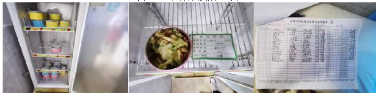
图 I-4 食品留样情况组图