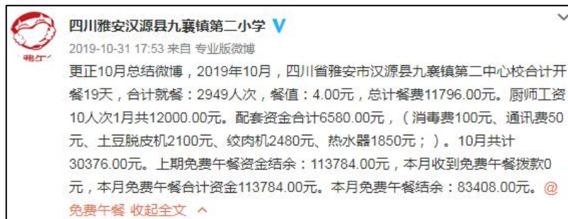
微博公示设备采购截图