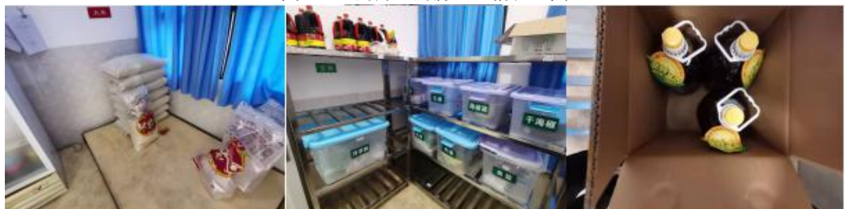
图 I-3 食材储存情况组图