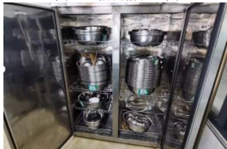
图III-3 公共餐具消毒情况组图