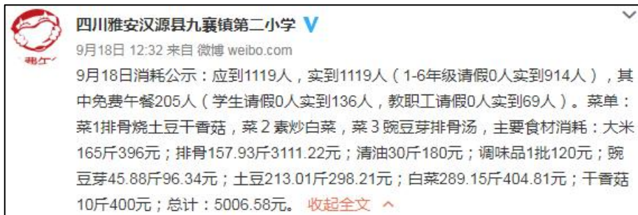
图IV-1 开餐当日微博截图