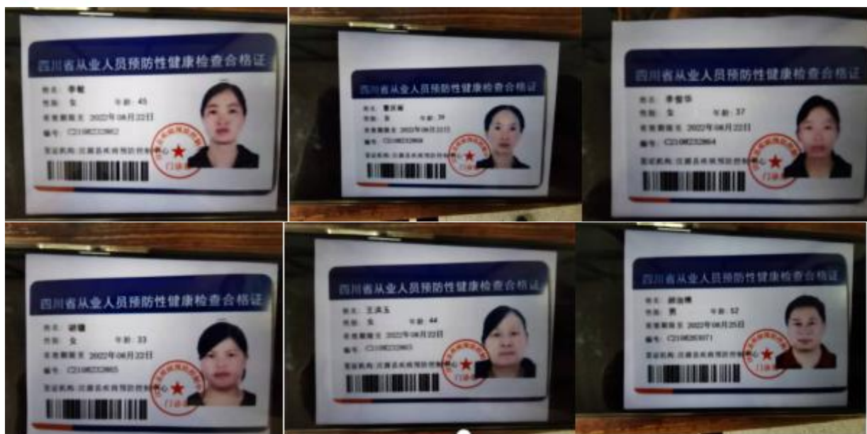
图 I-1 厨师健康证组图