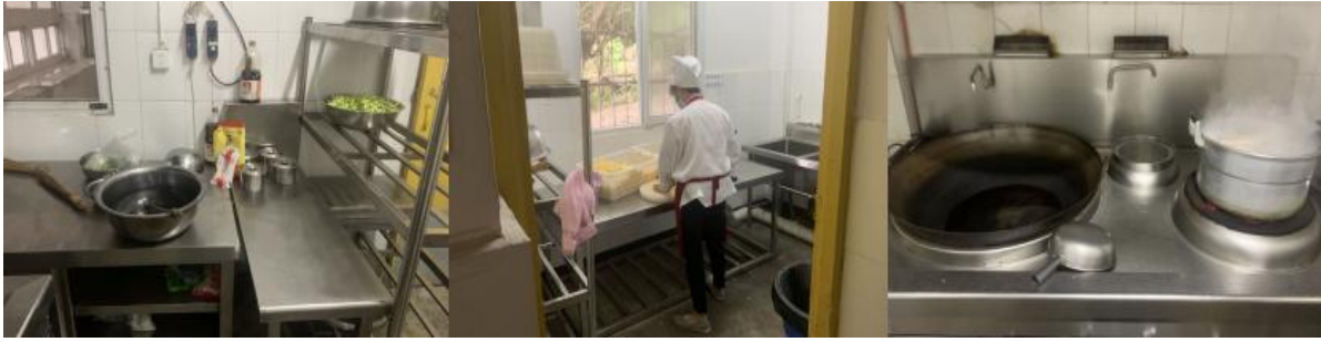
图 I -2 厨师、厨房卫生情况组图