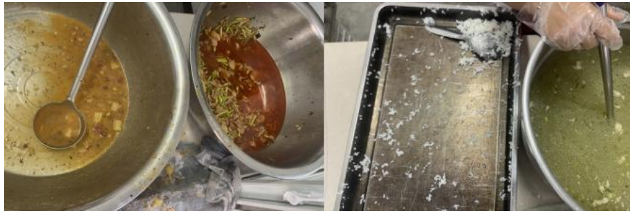
图III-4 左图为餐后剩余饭菜图；右图为餐后泔水桶倾倒图