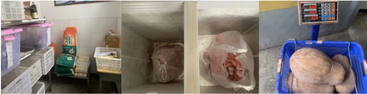
图 I -3 食材验收和储存情况组图