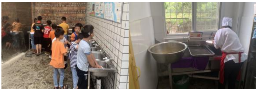
图III-3 就餐卫生情况组图（从左到右依次为餐前洗手、餐具清洗）