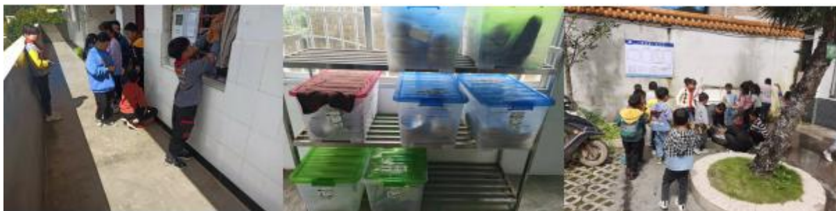
图III-3 就餐卫生情况组图