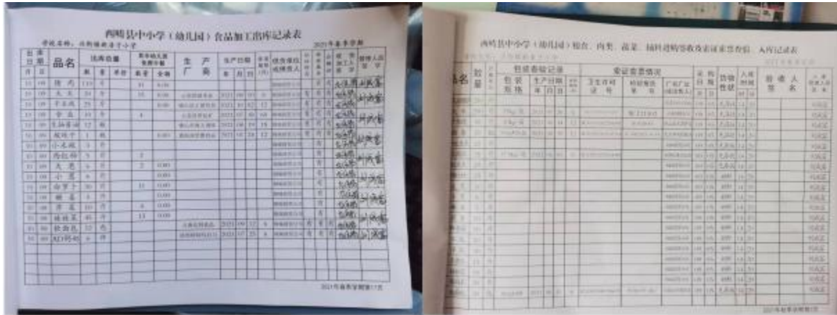
图 II-2 出入库登记组图