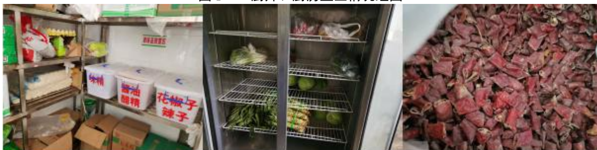
图 I -3 食材验收和储存情况组图