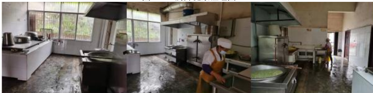
图 I -2 厨师、厨房卫生情况组图