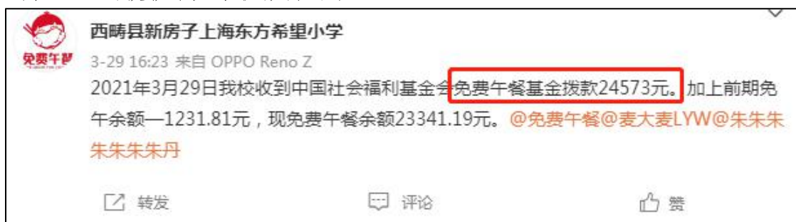
图 2 拨款公示截图

说明：查阅官网及财务最新拨款信息，免费午餐基金分别于 2021 年 9 月 16 日拨款 36551 元和 2021 年 3 月 12 日拨款 24573 元，学校微博于 2021 年 3 月 29 日公示收到拨款 24573 元与官网 2021 年 3 月 12 日公示的拨款金额一致，财务最新拨款信息中 2021 年 9 月 16 日的拨款未见学校微博公示。