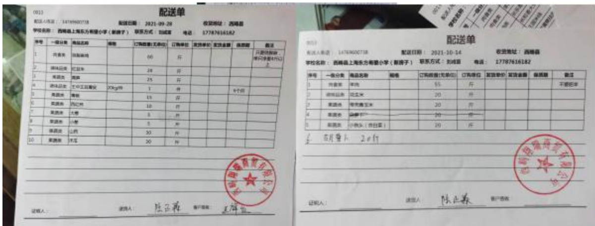
图 II-1 原始凭证组图