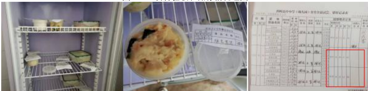
图 I -4 食品留样情况组图