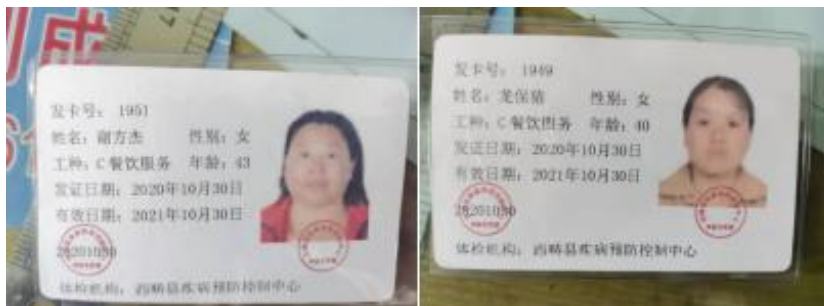
图 I -1 厨师健康证组图