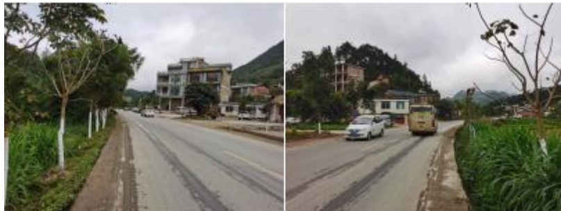
图 1 路况组图

交通说明：前往上海东方希望小学可在西畴县汽车站乘坐前往文山方向班车，直接在学校门口下车即可。学校就在马路边，全程路况良好。