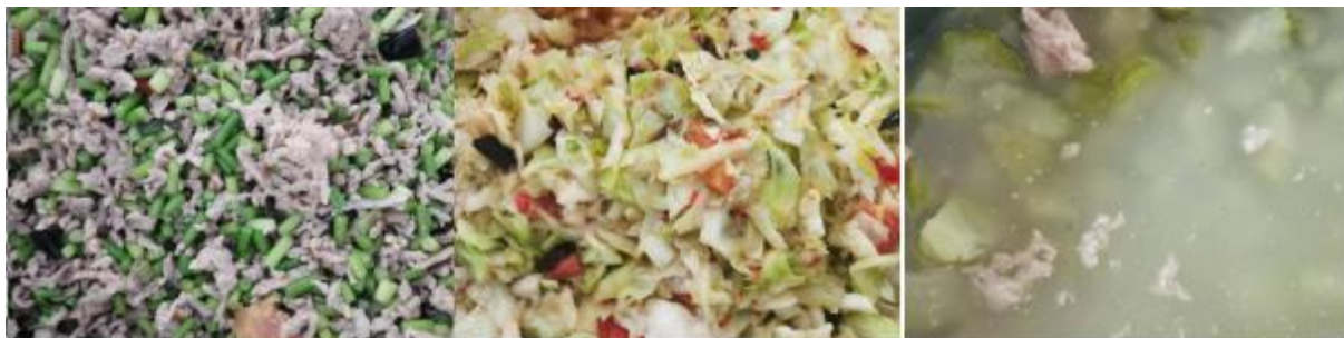
图III-1 开餐当天菜品情况组图