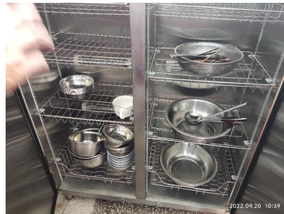
图III-3 餐具消毒情况组图