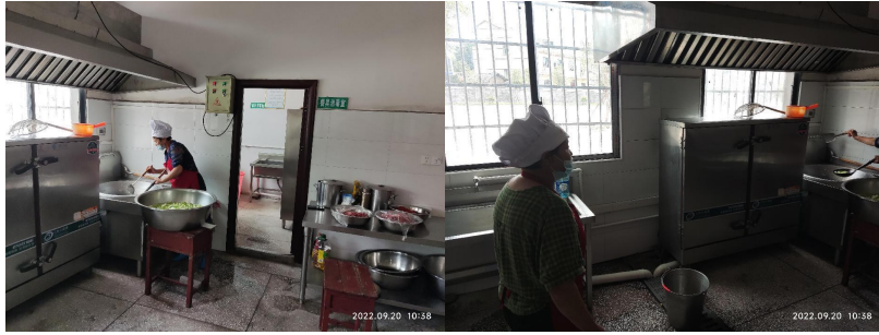
图 I -2 厨房及厨师卫生情况组图