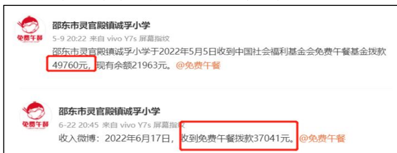
图 2 拨款公示截图

说明: 查阅官网拨款信息及财务最新拨款信息, 免费午餐基金分别于 2022 年 6 月 17 日拨款 37041 元和 2022 年 5 月 5 日拨款 49760 元, 学校分别于 2022 年 6 月 22 日和 2022 年 5 月 9 日对前述两笔拨款进行了公示, 金额一致。