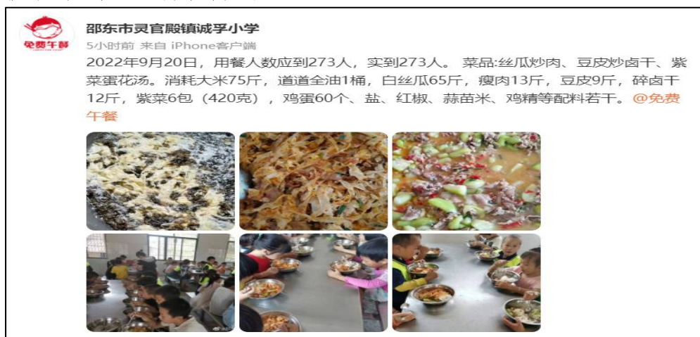
图IV-1 开餐当日微博截图