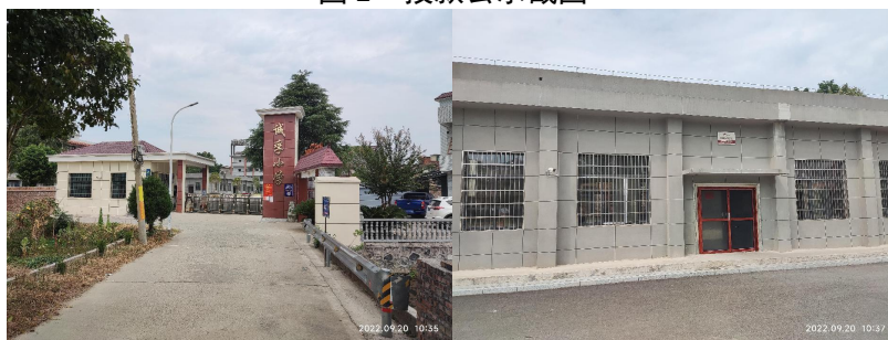
图 3 学校情况组图