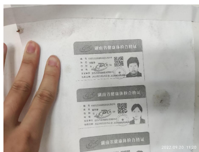
图 I -1 厨师健康证