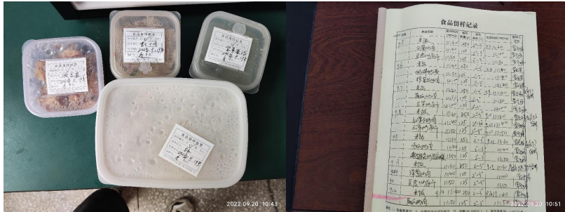
图 I -4 食品留样情况组图