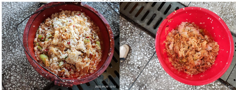
图III-4 餐后泔水桶倾倒图