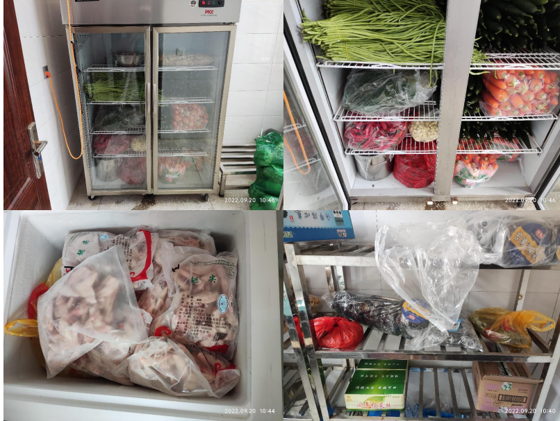
图 I -3 食材仓储情况组图