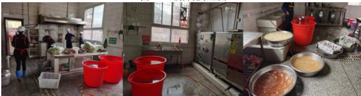
图 I -2 厨师、厨房卫生情况组图