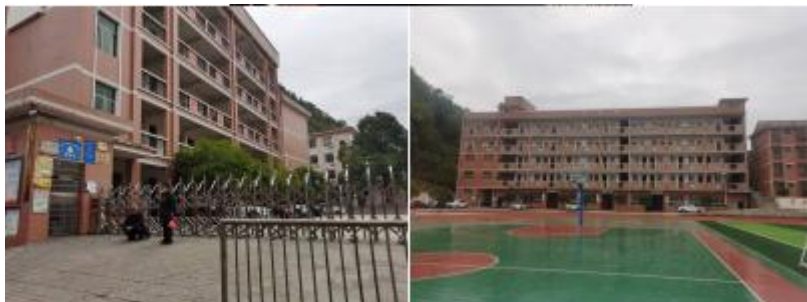
图 3 学校情况组图