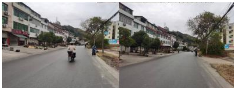
图 1 路况组图

交通说明：乘车前往学校可在新晃汽车站乘坐到玉屏方向的班车在学校门前下车即可，全程路况良好。