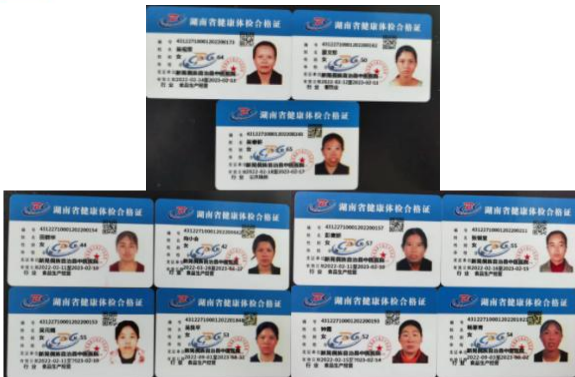
图 I -1 厨师健康证图