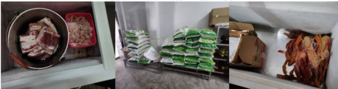
图 I -3 食材储藏情况组图