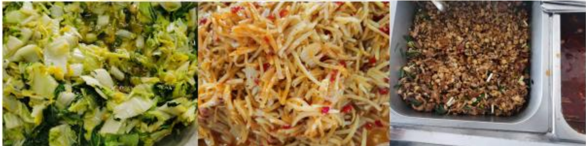
图III-1 开餐当天菜品情况组图