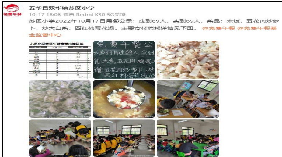
图IV-1 稽核当日用餐公示微博截图