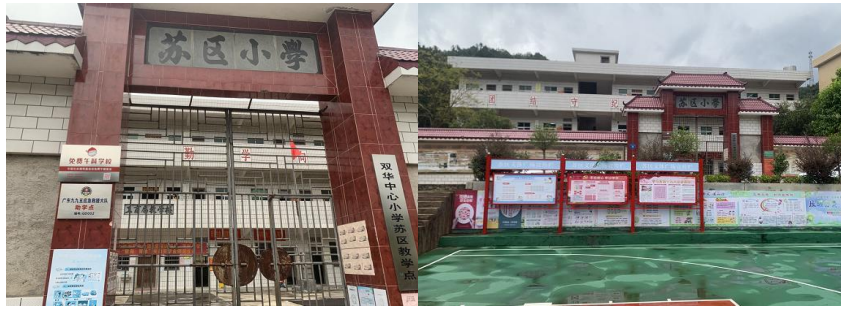
图 2 学校大门及校园环境