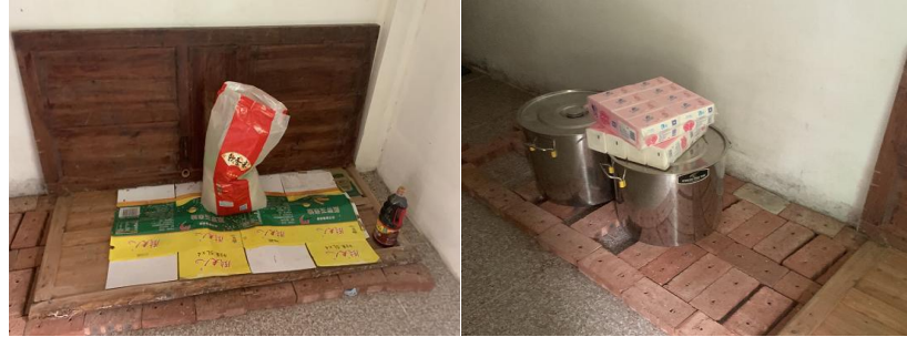
图 I-3 食材仓储情况组图