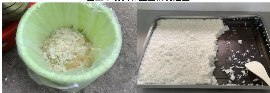
图III-4 餐后倾倒和剩余情况