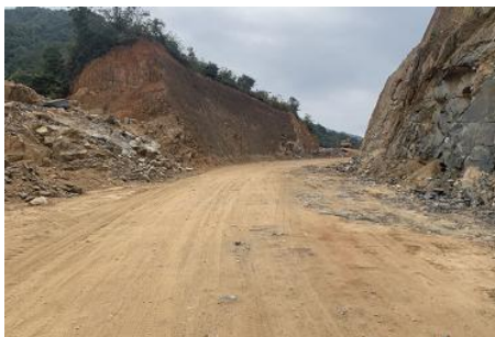
图 1 学校周边街景组图

交通说明：从五华县城前往双华镇有直达班车，7:00 第一趟车发出，每1小时一趟，最后一班车为16:50分。该班车路线经过双华镇，在双华镇下车后搭乘摩托车40分钟即可到达学校，全程路况一般。