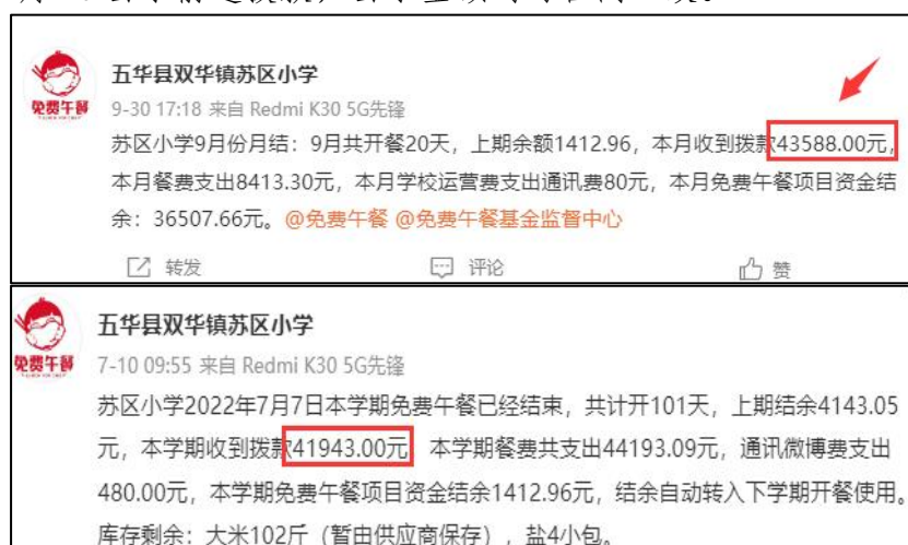
图 2 拨款公示截图

说明: 查阅官网近期拨款信息, 免费午餐基金分别于 2022 年 09 月 15 日拨款 43588 元和 2022 年 04 月 07 日拨款 41943 元。查阅学校微博, 校方分别于 2022 年 09 月 30 日和 2022 年 07 月 10 日公示前述拨款, 公示金额均与官网一致。