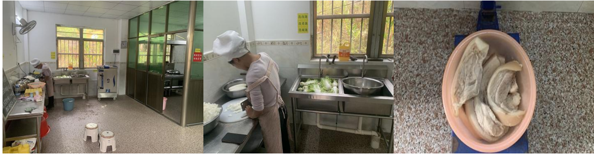
图 I-2 厨房及厨师卫生情况组图