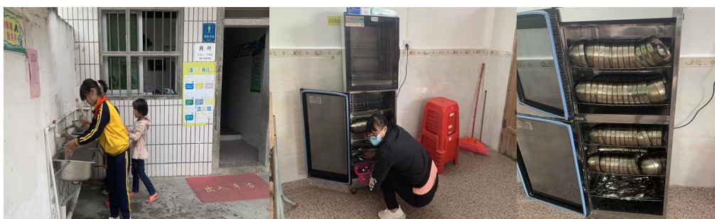
图III-3 餐具和卫生情况组图