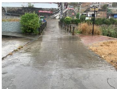
图 1 学校周边街景组图

交通说明：从五华县城有直达双华镇的班车，在汽车站乘坐，约1小时一班，准点发车，在华拔村路口（地图上：圣丰石材）下车，然后从路口直行2公里左右便可到达学校，全程水泥硬化路面，路况较好。