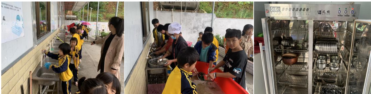
图III-3 餐具和卫生情况组图