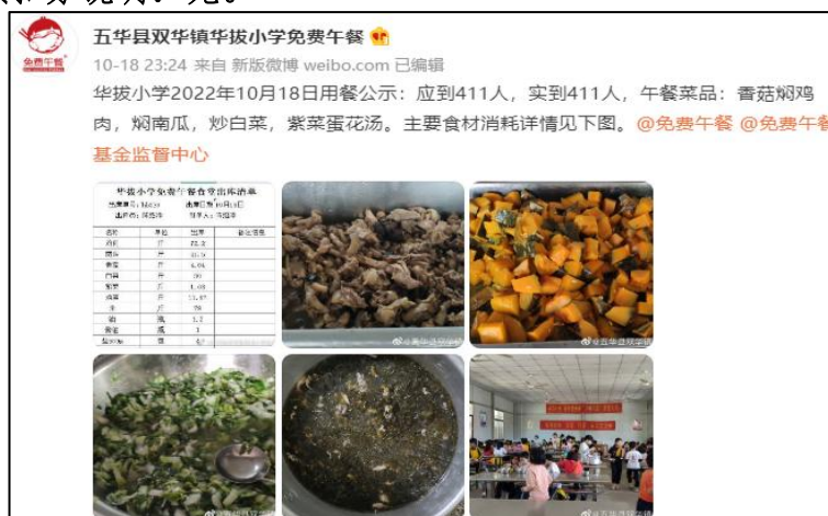
图IV-1 稽核当日用餐公示微博截图