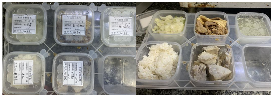
图 I - 4 食品留样情况组图