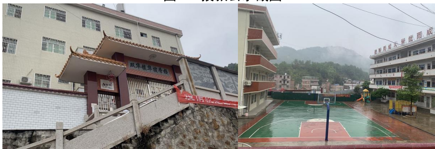
图 2 学校大门及校园环境