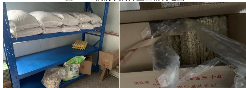
图 I - 3 食材仓储情况组图