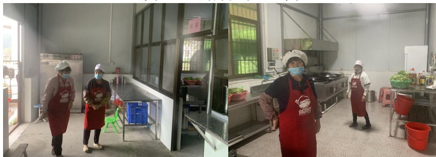
图 I - 2 厨房及厨师卫生情况组图