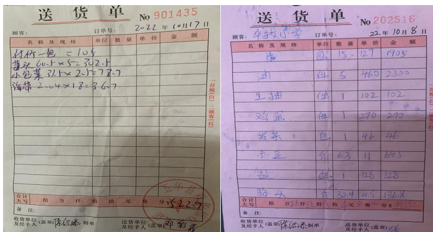
图 II-1 采购原始凭证组图