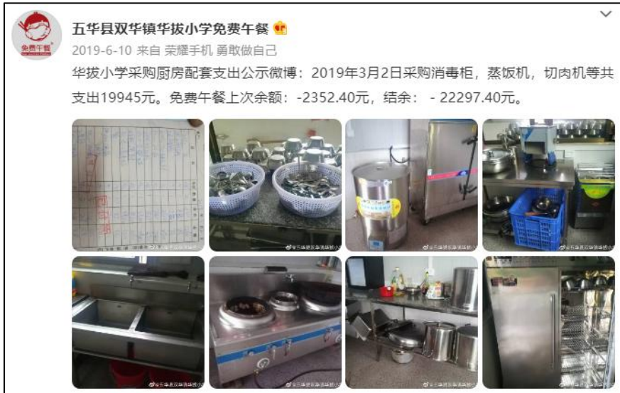
微博公示采购情况