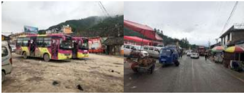
图 1 交通路况组图