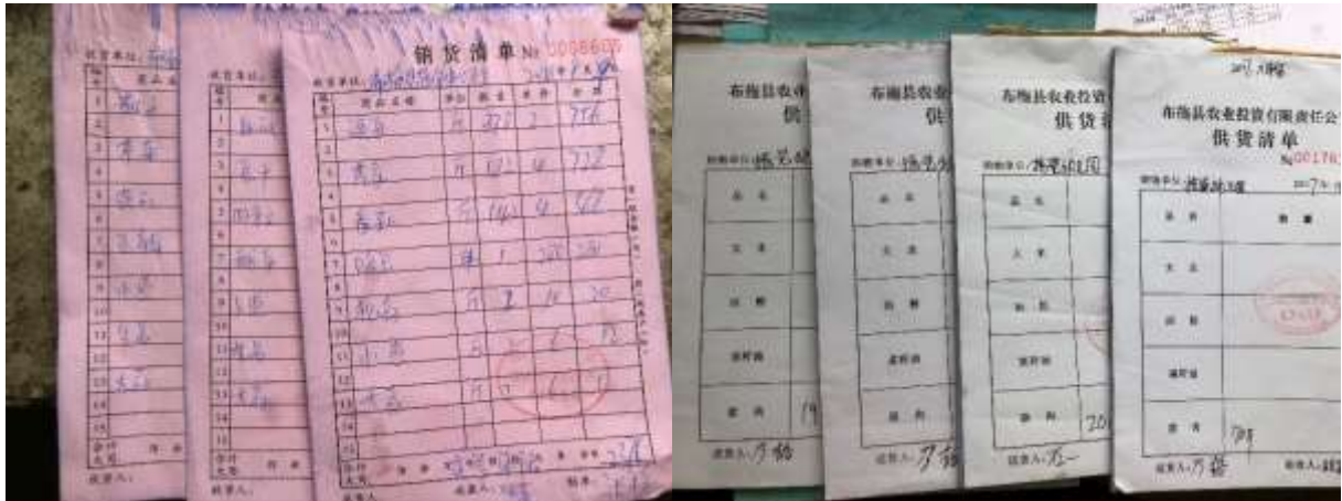
图 9 原始采购单组图（右图为自行填开的采购原始凭证）