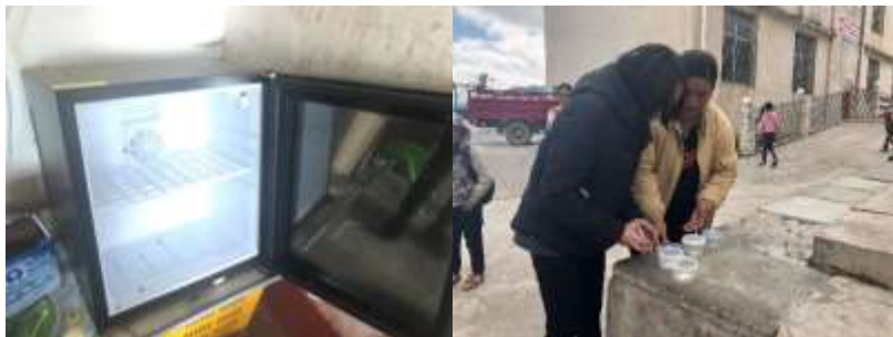
图 14 个别幼教点的食品留样情况