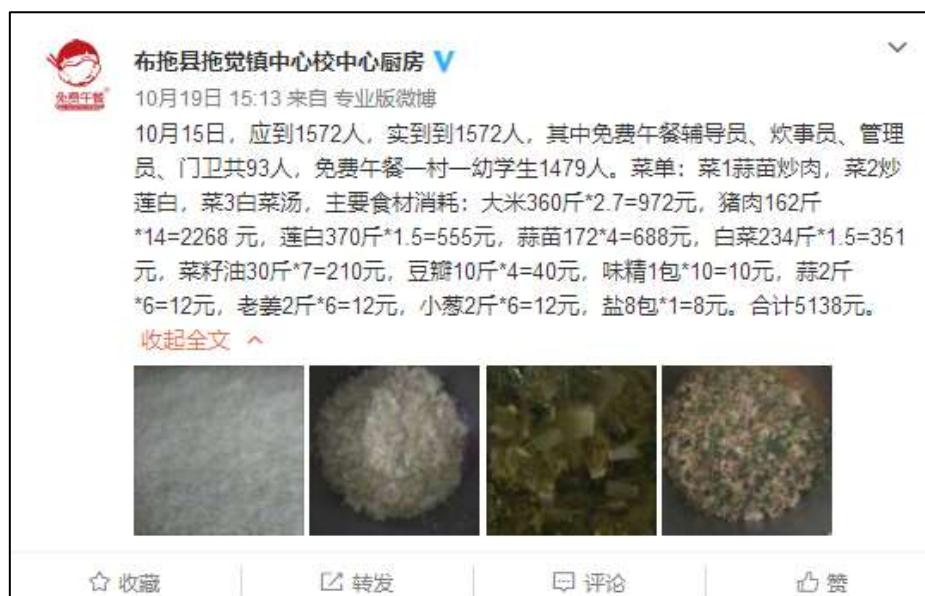
图 12 稽核当日学校微博截图