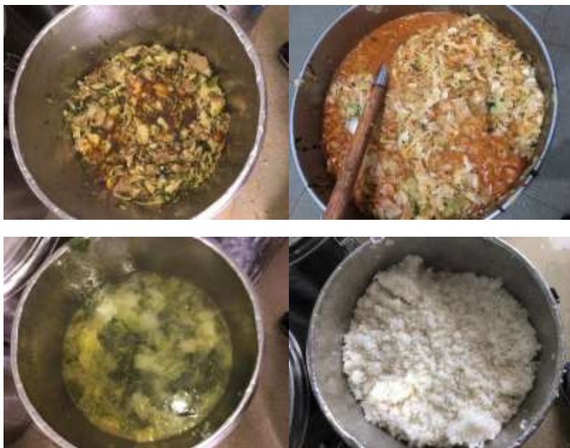
图 4 开餐当天菜品情况组图