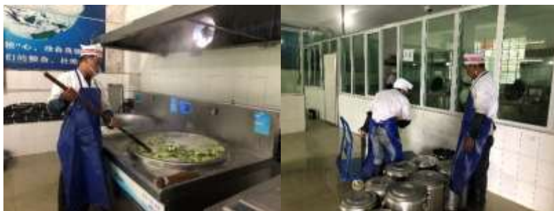
图 6 厨师卫生情况组图