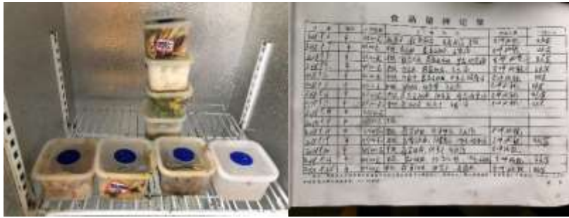
图 8 食品留样情况组图（取样盒油腻、无效）