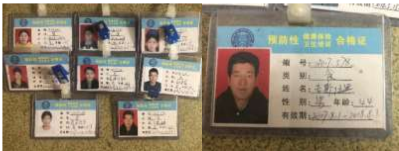
图 5 厨师健康证组图（其中 6 个过期）