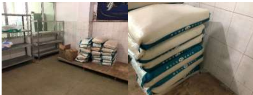
图 7 储藏间情况组图