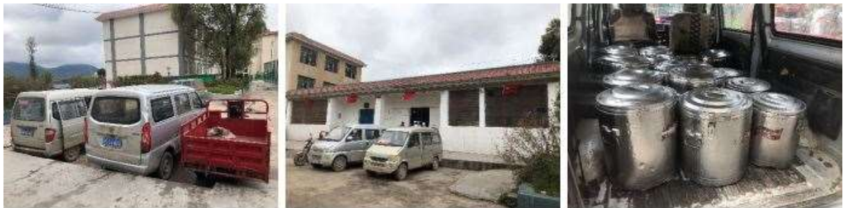
图 10 送餐车情况组图