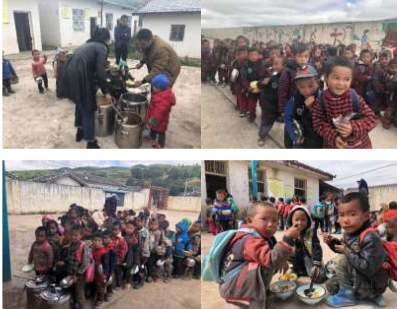
图 13 就餐情况组图