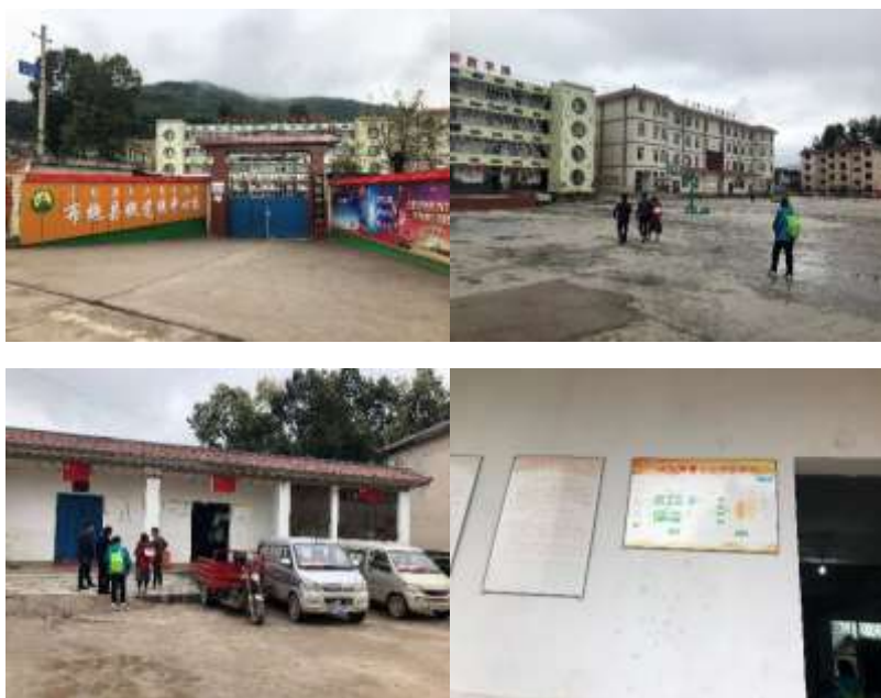
图2 学校及中央厨房情况组图

14个教学点的午餐在拖觉镇免费午餐中央厨房统一烹饪，厨师午餐烹饪好后，分别由三辆车将午餐送至教学点。